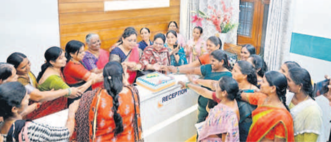
కేక్ కట్ చేసి వేడుకలు జరుపుకుంటున్న మహిళలు