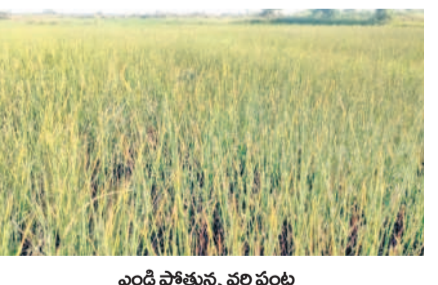
ఎండిపోతున్న వరి పంట

దహాగం, మార్చి 8 : మండలంలోని కొంచెంవెల్లిలో తరచూ ట్రాన్స్ ఫార్మర్లు కాలిపోతుండగా, పొట్లకొచ్చే దశలోనున్న పంటలు ఎండిపోతున్నాయి. పక్షం రోజుల్లో మూడు ట్రాన్స్ ఫార్మర్లు మార్పిడి ఫలితం లేకపోగా, కష్టనష్టాలకోర్కె వేసిన వరి చేతికందకుండా పోయే పరిస్థితులు దాపురించాయి. తాజాగా.. మరో ట్రాన్స్ ఫార్మర్ అమ్మినట్లు తెలుస్తుండగా, లో వోల్టేజీ సమస్య వల్ల ఇద్దెనా పనిచేస్తున్నా.. లేదా అన్న అనుమానాలు వ్యక్తమవుతున్నాయి.