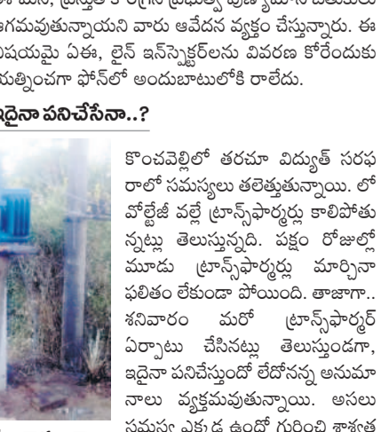
సాంకేతిక సమస్యల కారణంగా పాడైపోయిన ట్రాన్స్ ఫార్మర్ (రైల్)

యూసంగిలో కొంచెంవెల్లి రైతులు బోర్లపై ఆధారపడి వరి సాగు చేశారు. కరెంట్ సరఫరాకు సంబంధించి ఎప్పటికప్పుడు మరమ్మతులు చేపట్టకపోవడంతో తరచూ సమస్యలు ఎదురవుతున్నాయి. ఈ క్రమంలో గత నెల 23న కెనాల్ ఏరియాలోని విద్యుత్ ట్రాన్స్ ఫార్మర్ ప్యాజిపోయింది. 'పంటలు ఎండిపోతున్నాయి.. జర పట్టించుకోండి సార్' అంటూ రైతులు అధికారుల చుట్టూ ప్రదక్షిణలు చేసి మొరటట్టుకోగా, ఈ నెల 3న కొత్త ట్రాన్స్ ఫార్మర్ ను అమ్మారు. అది ఆన్ చేయగానే కాలిపోయింది. ఈ నెల 7 (శుక్రవారం)న మరో ట్రాన్స్ ఫార్మర్ ను ఏర్పాటు చేసి ఆన్ చేయగా, అది కూడా కాలిపోయింది. సాంకేతిక లోపాల కారణంగా తరచూ ట్రాన్స్ ఫార్మర్లు కాలిపోతుండగా, సుమారు 40 ఎకరాల్లో వేసిన వరి చేతికందకుండా పోయే పరిస్థితి వచ్చింది. ఇప్పటికే చాలా వరకు పంట ఎండిపోగా, దిగువపై ప్రభావం చూపే అవకాశమున్నది. కేసీఆర్ సర్కారులో 24 గంటల కరెంట్ రంది లేకుండా పంటలు