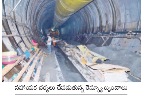
సహాయక చర్యలు చేపడుతున్న రెస్క్యూ బృందాలు

అనుమానంతో మిషన్ ను ఎక్కడికక్కడే కట్ చేస్తూ దాని శకలాలును బయటకు తీసున్నారు. అక్కడక్కడ దుర్ఘటన వస్తుంటే చిక్కుకున్న కార్మికులను రక్షించే పనిలో రెస్క్యూ బృందాలు చురుకైన పాత్ర పోషిస్తున్నాయి. ముద్దాపాటి ఐబిఎస్ రెస్క్యూ బృందం ద్వారా కనకాపూరులోని రైతులకు సహాయక చర్యలు చేపట్టారు. అక్కడక్కడ దుర్ఘటన వస్తుంటే చిక్కుకున్న కార్మికులను రక్షించే పనిలో రెస్క్యూ బృందాలు చురుకైన పాత్ర పోషిస్తున్నాయి. ముద్దాపాటి ఐబిఎస్ రెస్క్యూ బృందం ద్వారా కనకాపూరులోని రైతులకు సహాయక చర్యలు చేపట్టారు. అక్కడక్కడ దుర్ఘటన వస్తుంటే చిక్కుకున్న కార్మికులను రక్షించే పనిలో రెస్క్యూ బృందాలు చురుకైన పాత్ర పోషిస్తున్నాయి.