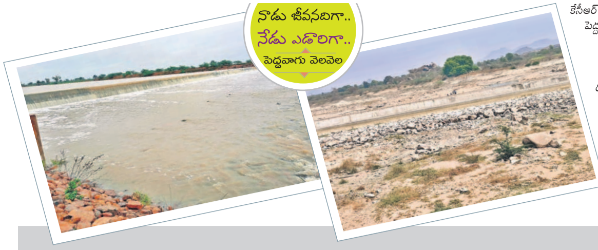
నోడు శీవనదిగా.. నేడు ఎడారిగా.. పెద్దవారు వెలవెల

కేసీఆర్ ప్రభుత్వంలో మూసాపేట-అద్దూరు మండలంలో పావుతున్న పెద్దవారు ఏడాది పొడవునా నీటితో జలకళను సంతరించుకున్నది. టీఆర్ఎస్ ప్రభుత్వంలో ప్రతి నీటి బొట్టును ఒడిసిపట్టేందుకు వెక్కిరించారు. దేవరకల్ల నియోజకవర్గంలో నాటి ఎమ్మెల్యే ఆల వెంకటేశ్వర్లరెడ్డి ప్రత్యేక చొరవ.. కేసీఆర్ సహకారంతో పెద్ద ఎత్తున నిర్మాణాలు చేపట్టారు. ఎంజీఎల్ఎఫ్ పథకం ద్వారా శ్రీశైల జలాలు పారడంతో వారు తదానంతరం ఉండేది. కానీ నేడు కాంగ్రెస్ సర్కారు వచ్చాక వేసిన ప్రారంభంలోనే ఎడారిని తలపిస్తోంది. దీంతో పరిసర గ్రామాల్లో భూగర్భ జలాలు అడుగంటిపోయాయి. బోర్లలో నీటిమట్టం గణనీయంగా తగ్గడంతో వల వోట్ల పంటలు ఎందు తున్నాయి. దీంతో రైతులు తీవ్రంగా సస్పృహకుండా.. అప్పులు మీదపడుతున్నాయి. - మూసాపేట, మార్చి 8