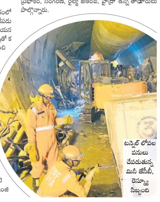
టన్నెల్ లోపల పనులు చేపడుతున్న మినీ జేసీబి, రెస్క్యూ సిబ్బంది

అడవిలో అన్ని ప్రమాదం మహబూబ్ నగర్ మార్చి 8 : మహబూబ్ నగర్ జిల్లాలోని అడవి ప్రాంతాల్లో దాదాపు అర కిలో మీటరు మేర మంటలు వ్యాపించి అగ్ని ప్రమాదం చోటు చేసుకున్నది. స్థానికుల కథనం ప్రకారం.. శుక్రవారం ధర్మాపూర్ అటవీ ప్రాంతంలో ప్రమాదం జరిగింది. సుమారు టువేల చుట్టుపక్కల అర కిలో మీటరు వరకు మంటలు వ్యాపించాయి. ఎండల ప్రభావం వల్ల చెట్లు కాలి బూడిదయ్యాయి. సమాచారం అందుకున్న అటవీ శాఖ అధికారులు సకాలంలో స్పందించి మంటలను అదుపులోకి తీసుకొచ్చారు.