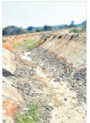
ఎండిపోయిన నెట్టెంపాడు డి-9 కాల్వ