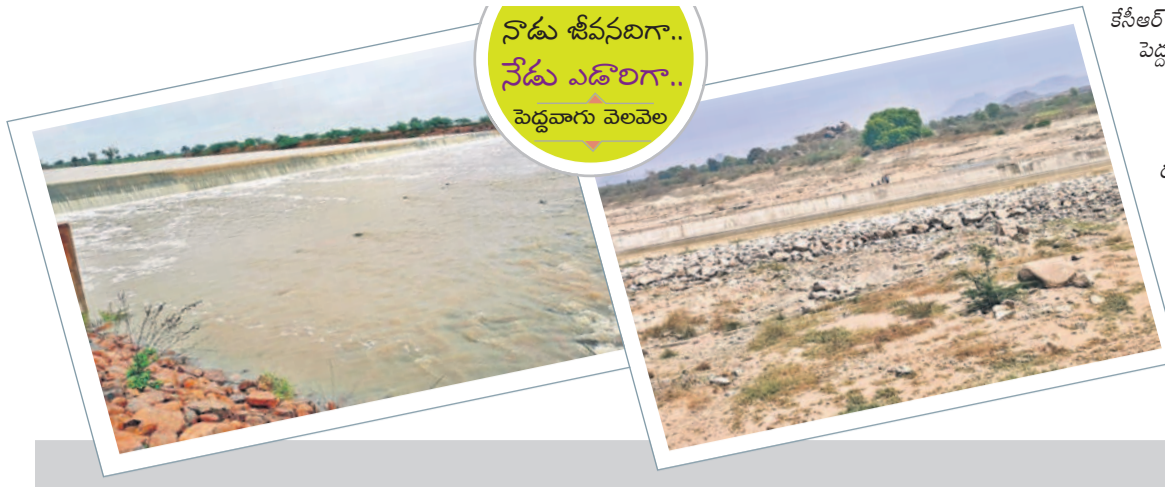
నొడు శీవనదిగా.. నేడు ఎడారిగా.. పెద్దవారు వెలవెల