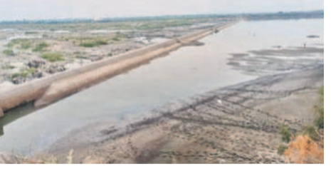
టీటీ డ్యాం లో క్రమేపీ తగ్గుతున్న నీటి నిల్వలు..

కర్ణాటకలోని తుంగభద్ర డ్యాం లో నీటి నిల్వలు క్రమేపీ తగ్గుతున్నాయి. కర్ణాటక, ఏపీ, తెలంగాణ రాష్ట్రాల సాగు, తాగునీటి అవసరాలకు డ్యాం ద్వారా నీటిని విడుదల చేస్తుండటంతో నీటి మట్టం తగ్గుతున్నది. వేసవిలో తాగునీటి అవసరాలకు 20టిఎంసీలను నిల్వ చేసే అవకాశం ఉందని టీటీ డ్యాం అధికారులు చెబుతున్నారు. శనివారం అప్పటివేళే 10,051 క్యూసెక్కులుగా ఉన్నది. 105.788 టీఎంసీల గరిష్ట సామర్థ్యం కలిగిన టీటీ డ్యాం లో ప్రస్తుతం 27.345 టీఎంసీల నీటి నిల్వ ఉన్నదని బోర్డు సెక్రటరీ అధికారి రామవేదం తెలిపారు.