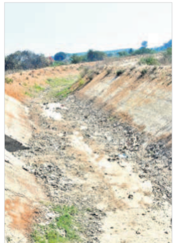
ఎండిపోయిన నెట్టెంపాడు దీ-9 కాల్వ

నంది సాగునీరు అందించాల్సి ఉన్నది. అయితే 4టీఎంసీల నీరు నిల్వ ఉండాలి. రిజర్వాయర్లలో కాంగ్రెస్ ప్రభుత్వం నాసిరకం పనులు చేయడంతో రిజర్వాయర్ల నుంచి నీరు లీకేజీల ద్వారా బయటకు వస్తుండడంతో ప్రస్తుతం 1.5టీఎంసీల నీరు కూడా నిల్వ లేని పరిస్థితి నెలకొన్నది. ఈ రిజర్వాయర్ల కింద కేటీడోడ్డి మండలంలోపాటు గట్టు మండలంలో కొంత భాగం, మల్లం మండలంలో పాలాలకు నీరు పారు తున్నది. గట్టు, కేటీడోడ్డి శివారులో సుమారు 500 ఎకరాలకు పైగానే బివర్ ఆయన కట్టుకు నీరు అందక పంటలు ఎండిపోతున్నాయి. బివర్ ఆయనకు వరకు నీరు ఇచ్చి తమ పంట పాలాలను కాపాడాలని రైతులు కలెక్టరేట్ వద్ద ఆందోళన చేసినా ఇప్పటి వరకు సాగునీరు అందడం లేదు. మల్లం మండలం పాలాలకు గానీ, సర్కారు గానీ ఎటువంటి హామీ ఇవ్వలేదు. మంత్రితోపాటు ఎమ్మెల్యే కర్ణాటక నుంచి 4టీఎంసీల నీరు విడుదల చేస్తారని చెప్పి రైతులను మోసం చేశారు. ఇప్పటి వరకు కేవలం 0.45 టీఎంసీల నీటిని మాత్రమే కర్ణాటక విడుదల చేసింది. మిగతా నీరు విడుదల చేస్తే తప్ప గద్దాల నియోజకవర్గంలో పంటలు చేతికొచ్చే పరిస్థితి లేదు. కేటీడోడ్డి మండలంలో ప్రభుత్వంపై రైతులు ఆగ్రహం వ్యక్తం చేస్తున్నారు.