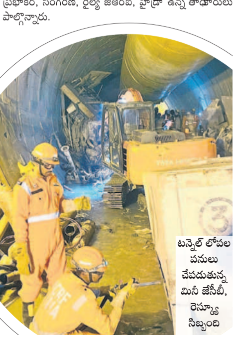
టన్నెల్ లోపల పనులు చేపడుతున్న మిసి జేసీఐ, రెస్క్యూ సిబ్బంది