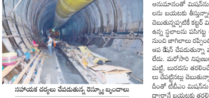
సహాయక చర్యలు చేపడుతున్న రెస్ట్రూక్చర్ బృందాలు

నాగర్ కర్నూల్/అచ్చం ఊరి, మార్చి 8 : ఎన్ఎ టీసీసీలో చిక్కుకున్న కార్మికుల జాడ ఎంతో కానరావడం లేదు. 15 రోజులగా ఎన్ఎమి మంది టెండర్ కోసం 11 రెస్ట్రూక్చర్ టీమ్లలోని దాదాపు 580 మందికిపైగా సహాయక చర్యలు చేపట్టినప్పటికీ ఫలితం లేక పోతున్నది. రాధా డ్యూరా గుర్తిం బు స్థానాల్లో శనివారం రెండు వోట్ల పూర్తిస్థాయిలో మట్టిని తొలగించి చివరటికి కార్మికుల జాడ కనిపించింది. కేరళ నుంచి రప్పించిన ప్రత్యేక జాగిలాలు సైతం కార్మికుల జాడ గుర్తించలేకపోయాయి మట్టి, బురద నీరు ఉండడంతో రాధా మిషన్ ద్వారా గుర్తిం బు స్థానాల్లోనే జాగిలాలు సైతం గుర్తించలేకపోయాయి. దాని వల్ల కార్మికుల జాడ మాత్రం కానరావడం లేదు.