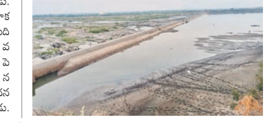
టీటీ డ్యాం లో క్రమేపీ తగ్గుతున్న నీటి నిల్వలు..