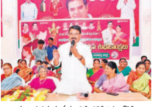
మాట్లాడుతున్న మాజీ మంత్రి సింగిరెడ్డి నిరం జేరెడ్డి