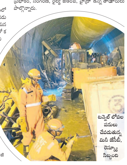
టన్నెల్ లో పనులు చేపడుతున్న మినీ జేసీబీ, రెస్ట్రూక్చర్ సిబ్బంది

ఎన్ఎ టీసీసీ ప్రమాదం ఘటన జాతీయ విపత్తు అని, సారంగంలో చిక్కుకున్న కార్మికులను రక్షించే పనులు సాగు చేశాడు. బోరు మోటలు నుంచి నీళ్లు రాకపోవడంతో పంట ఎండిపోతుంది. ఎలాగైనా పంటను కాపాడకోవాలని బోరును తవ్విం చాడు. ఏకంగా 700 మీటర్ల వరకు వ్యవసాయ బోరును తవ్విం చినా పంటను లితికిపోతున్నాయి. సాగు చేసిన పంటలు కండ్ల ముందే ఎండిపోతుంటే కన్నీరు పెడుతున్నారు.