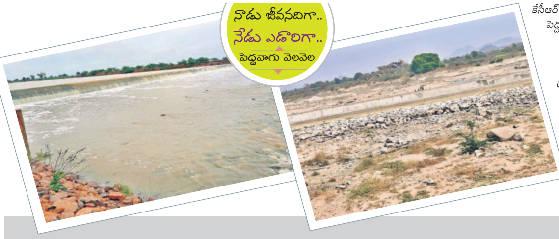
నోడు శీవనదిగా.. నేడు ఎడారిగా.. పెద్దవారు వెలవెల