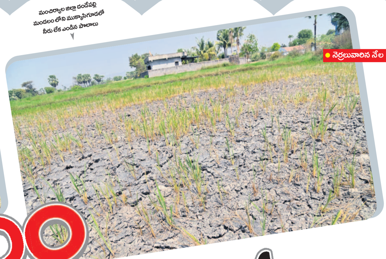
మంచెర్రాల జిల్లా దండేపల్లి మండలం లోని ముక్కాసిగూడలో నీరు లేక ఎండిన పొలాలు