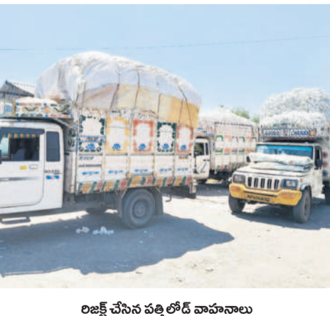
రైల్వే చేసిన పత్తిలోని నీరు వానాలు

ఆదిలాబాద్, మార్చి 8(నమస్తే తెలంగాణ) : కేంద్ర ప్రభుత్వ రంగ సంస్థ కాలన్ కార్పొరేషన్ అఫ్ ఇండియా(సీసీఐ) నిర్మాణం వల్ల ఆదిలాబాద్ జిల్లా రైతులకు తీవ్రంగా నష్టపోవాల్సి వస్తున్నది. పత్తిని కొనుగోళ్లను సీసీఐ కార్పొరేషన్ సంస్థల మాదిరిగా వ్యాపార డోరణితో వ్యవహరిస్తుండడంతో రైతులు ఇబ్బందులు పడుతున్నారు. సీసీఐ ప్రారంభంలో తేమ అధికంగా ఉండటం కొనుగోళ్లను నిరాకరించిన సీసీఐ. ఇప్పుడు నాణ్యత తగ్గించడం ద్వారా తగ్గిస్తున్నది. ముద్దుల ధర క్రిందగా ఉన్న రూ.7521 ఉండగా.. ఏకంగా రూ.100 తగ్గించి రూ. 7,421తో కొనుగోలు చేస్తుండడంతో రైతులు నష్టపోతున్నారు. కొనుగోళ్ల వివర దశకు చేరుకోగా.. రైతులు తమ పద్ద కన్న పంటను ఆదిలాబాద్ మార్కెట్ యార్డుకు సీసీఐకి విక్రయించడానికి తీసుకొస్తున్నారు. పంట నాణ్యత లేదంటూ కొనుగోలు చేయకుండా నిరాకరిస్తుండడం రైతులు ఆగ్రహం వ్యక్తం చేస్తున్నారు. పంటను కొనుగోలు చేయాలని బతిమిలాడిన పట్టించుకోవడం లేదని రైతులు అంటున్నారు. సీసీఐ సిబ్బంది నిర్మాణం ఫలితంగా ప్రైవేటు వ్యాపారులకు పంటను విక్రయించి సప్లయ్ చేస్తున్నారని ఆవేషం వ్యక్తం చేస్తున్నారు.