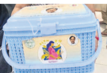
బాలింత మృతి కేసీఆర్ న్యూట్రిషన్ కిట్ (ఫైల్)

ఆదిలాబాద్, మార్చి 8(నమస్తే తెలంగాణ) : జిల్లాలోని ఏజెన్సీ ప్రాంతాల్లో గల గర్భిణులకు రక్తహీనత శాపంగా మారింది. పాప్యూకాహారం అందడం వడతో ప్రసవ సమయంలో తీవ్ర అనారోగ్యానికి గురవుతున్నారు. వైద్యసేవలు అందించినా తల్లిని డ్రైల ప్రాణాలు కు ప్రమాదం ఏర్పడుతుంది. ఈ సమస్యని వారణాశివాయి గర్భిణులకు పాప్యూకాహారం అందించడానికి టీఆర్ఎస్ ప్రభుత్వం కేసీఆర్ న్యూట్రిషన్ కిట్ పథకాన్ని అమలు చేసింది. ఈ కిటిలో కిటి న్యూట్రిషన్ మిల్క్ పౌడర్, కి లో ఖద్దూర పండ్లు, మూడు బాటిళ్ల బెనన్ సీరెత్తో పాలు, ఆర కిలో నెయ్యిని ఉంటాయి.