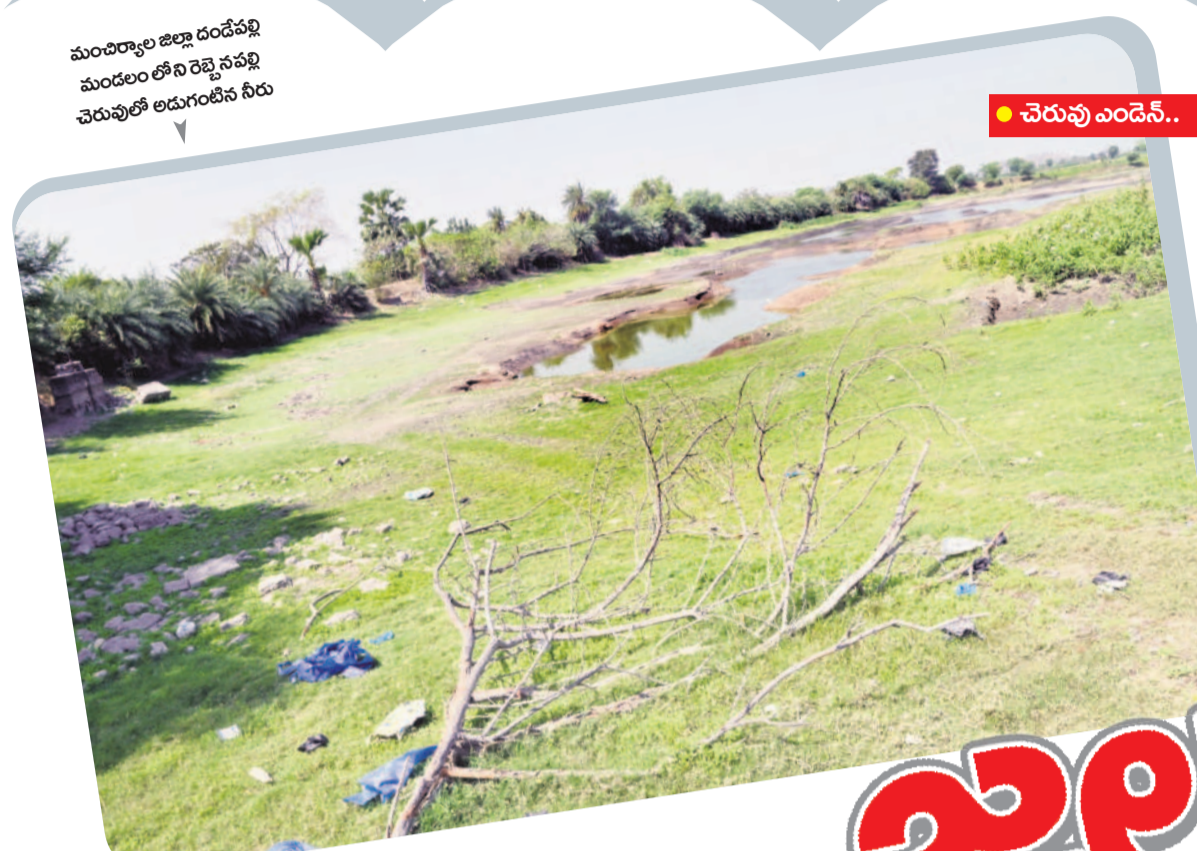
మంచెర్రాల జిల్లా దండేపల్లి మండలం లోని రెడ్డెనపల్లి చెరువులో అడగంటిన నీరు