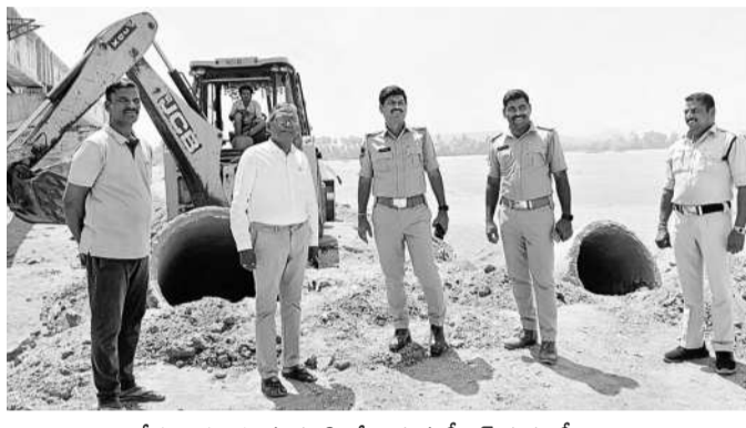
రోడ్డుపై గుంతలను పూడ్చి వేయిస్తున్న దీఆర్ ఈఈ, సీబి, ఎస్సె

నవీపేట, మార్చి 8: నిజామాబాద్ జిల్లా నవీపేట మండల కేంద్రంలో శనివారం నిర్వహించిన మేకల అంగడిలో క్రయవిక్రయాల సారాంశం, కర్ణాటక, పంజాబ్ తదితర జోరుగా సాగాయి. వివిధ రాష్ట్రాల నుంచి తీసుకువచ్చిన మేకలు, గొర్రెల క్రయ విక్రయాలకు మేకల అంగడిలో జీవాల క్రయ గోల్లకూడలు పెద్ద మొత్తంలో జీవాల క్రయ విక్రయాల చేపట్టారు. జీవాలతో అంగడి గిన్నె వ్యాపార వర్గాలు పేర్కొన్నారు. ఈ అంగడిలో మేకల అంగడిలో జీవాల క్రయ నెల 14న హోల్ పండగతోపాటు వరుసగా వివాహాలు, శుభకార్యాలు ఉండటంతో అంగడికి మరింత డిమాండ్ పెరిగింది. రాష్ట్రంలోపాటు మహారాష్ట్ర, గుజరాత్, ఒడిశా, ఆంధ్రప్రదేశ్, పుణె, ఉత్తరప్రదేశ్, హిందూ మేకల అంగడిలో క్రయవిక్రయాల సారాంశం, కర్ణాటక, పంజాబ్ తదితర జోరుగా సాగాయి. వివిధ రాష్ట్రాల నుంచి తీసుకువచ్చిన మేకలు, గొర్రెల క్రయ విక్రయాలకు మేకల అంగడిలో జీవాల క్రయ గోల్లకూడలు పెద్ద మొత్తంలో జీవాల క్రయ విక్రయాల చేపట్టారు. జీవాలతో అంగడి గిన్నె వ్యాపార వర్గాలు పేర్కొన్నారు. ఈ అంగడిలో మేకల అంగడిలో జీవాల క్రయ నెల 14న హోల్ పండగతోపాటు వరుసగా విక్రయాల కొనసాగాయి.