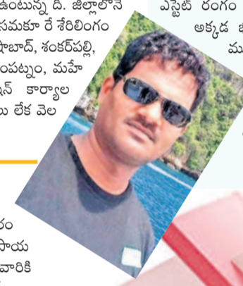
-లండన్ మాసావేలర్ రెడ్డి

గతంలో రియల్ ఎస్టేట్ రంగానికి అదిబట్టి పెట్టింది పేరుగా ఉండేది. ఈ మున్సిపాలిటీలో రియల్ ఎస్టేట్ వ్యాపారులు వందల సంఖ్యలో ఉన్నారు. ఇతర ప్రాంతాలకు చెందిన వారు వచ్చి బీసీఎస్ పరిసర ప్రాంతాల్లో ఫ్లాట్లు, అపార్ట్ మెంట్లు, విల్లాలు అధిక సంఖ్యలో కొనేవారు. అయితే, రియల్ ఎస్టేట్ రంగం పడిపోవడంతో నేడు ఎవరూ అక్కడ భూములు, ఫ్లాట్లు కొనేందుకు ముందు రావడం లేదు. అదిబట్టి, మంగల్పల్లి, పట్టేగూడ, బొంగ్లాడు తదితర ప్రాంతాల్లోనూ ఫ్లాట్ల క్రయవిక్రయాలు పూర్తిగా తగ్గిపోయాయి.