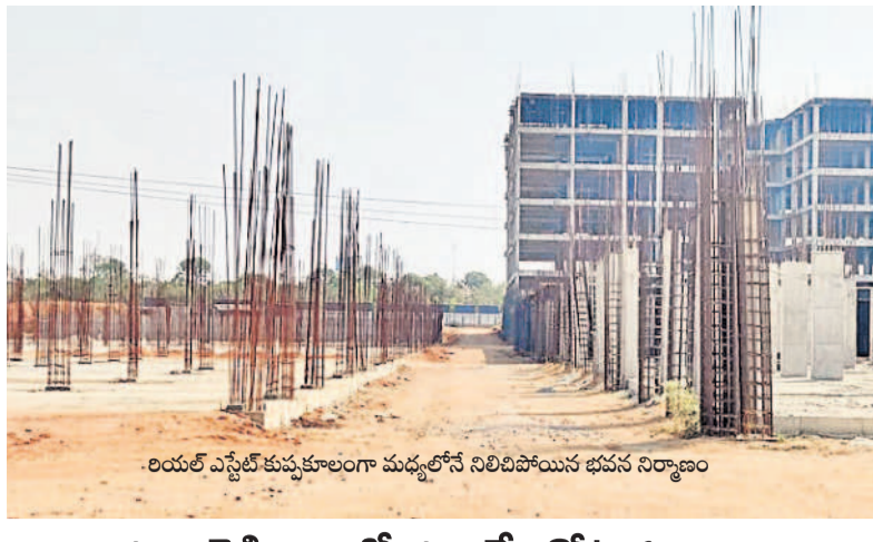
రియల్ ఎస్టేట్ కుప్పకూలగా మధ్యలోనే నిలిచిపోయిన భవన నిర్మాణం