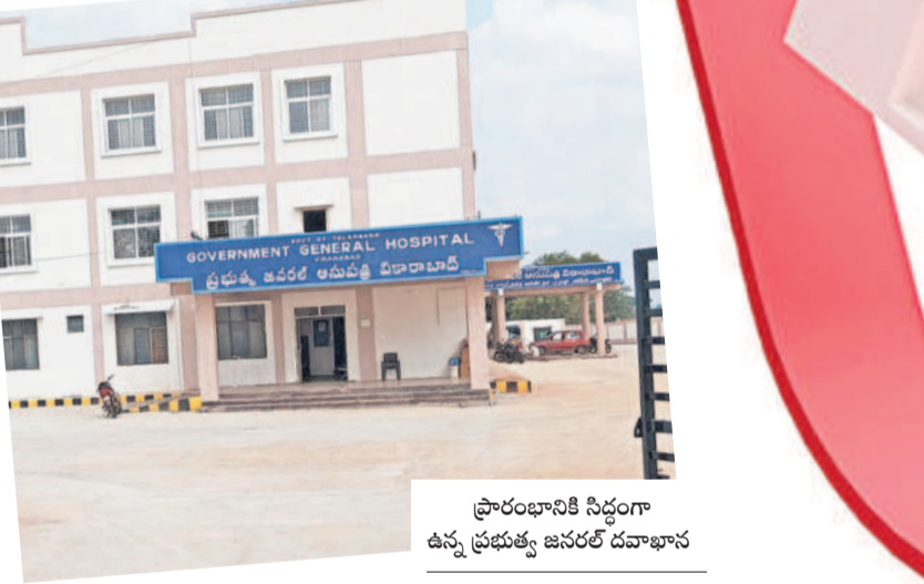
ప్రారంభానికి సిద్ధంగా ఉన్న ప్రభుత్వ జనరల్ దవాఖాన

వికారాబాద్, మార్చి 8 : 300 పడకల దవాఖాన ప్రారంభం ఎప్పుడో.. అని రోగులు, ప్రజలు ఆశగా ఎదురుచూస్తున్నారు. వికారాబాద్ జిల్లా కేంద్రంలోని 50 పడకల ప్రభుత్వ పరియోగ దవాఖానను రోజురోజుకూ రోగుల తాకిడి పెరుగుతున్నది. ప్రతిరోజూ దాదాపుగా వెయ్యి మంది వరకు వైద్యం కోసం వస్తున్నారు. దీంతో గత బీఆర్ఎస్ ప్రభుత్వం రోగులకు మొదలైన సేవలు, సౌకర్యాలు కల్పించేందుకు రూ.30 కోట్లతో మరో 300 పడకల దవాఖానను ఏర్పాటు చేసింది. చిన్న చిన్న పనులు ఉండగా ఇటీవల పూర్తయ్యాయి. అయితే, గత రెండు, మూడు నెలల కిందటే ఈ దవాఖాన ప్రారంభోత్సవం కావాల్సి ఉండగా.. వైద్యారోగ్య శాఖ మంత్రి గారు రాకపోవడంతో పెండింగ్లో పడిపోయింది. మంత్రిగారు స్వం దించి ఆస్పత్రిని ప్రారంభిస్తే తమకు మొదలైన వైద్యసేవలు అందుతాయని ప్రజలు, రోగులు కోరుతున్నారు.