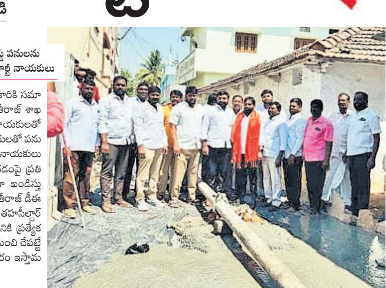
బాకారంలో నీసీ రోడ్డు పనులను ప్రారంభిస్తున్న అధికార పార్టీ నాయకులు