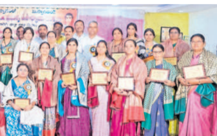
చేవేళ్లలోని మహిళా ఉపాధ్యాయులను సన్మానించిన ఉపాధ్యాయ సంఘం సభ్యులు