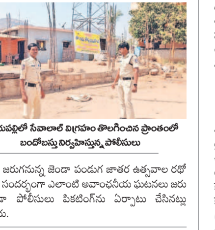
లోయపల్లిలో సీమలార్ విగ్రహం తొలగించిన ప్రాంతంలో బందోబస్తు నిర్వహిస్తున్న పోలీసులు