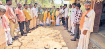
కేసెపేట: చౌదరిగూడలో మహిళలను సన్మానిస్తున్న జిఆర్ఎస్ నేతలు

అప్పారెడ్డిగూడలో.. షాబాద్ : మండల పరిధిలోని అప్పారెడ్డిగూడ గ్రామంలో అంతర్జాతీయ మహిళా దినోత్సవం సందర్భంగా మహిళలతో కలిసి గ్రామ మాజీ సర్పంచ్ ప్రభుత్వ కేకే కట్ చేసిన సందర్భంగా చేసుకున్నారు. కొండుర్లు: కొండుర్లు, చౌదరిగూడ మండలాల్లో మహిళా