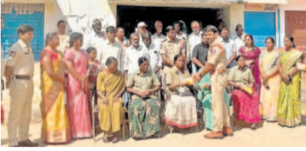
యాచారం : తాటిపల్లి పంచాయతీ సీమ్ కృష్ణారాజు

పెద్దఅంబరపేట: మహిళా సిబ్బందిని సన్మానిస్తున్న ఎన్ఐఐతో అంజలి దీపాలు