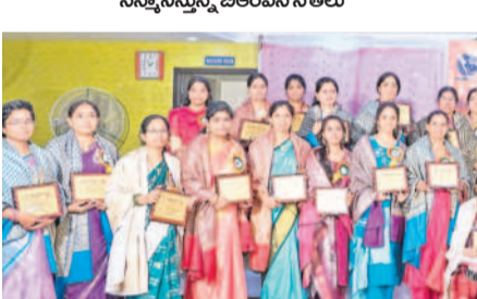
చేవేళ్లలోని మహిళా ఉపాధ్యాయులను సన్మానించిన ఉపాధ్యాయ సంఘం సభ్యులు