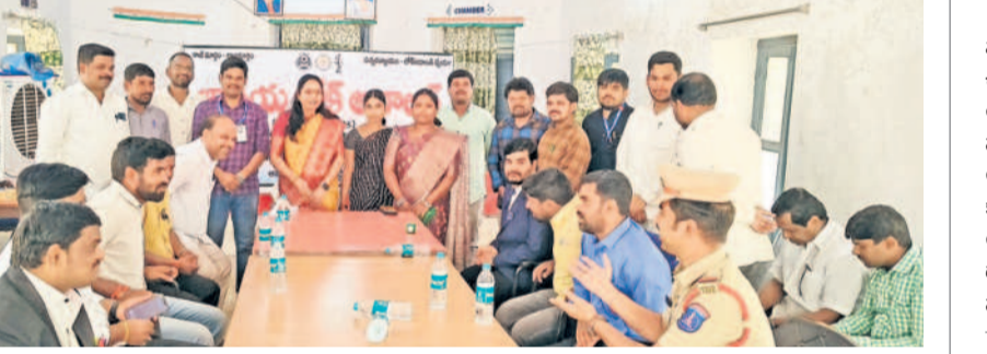
లోక్ అదాలత్ నిర్వహిస్తున్న అమనగల్లు జూనియర్ సివిల్ జడ్జి కాలనీ స్వరూప