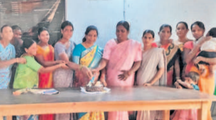
షాబాద్ : మండల పరిధిలోని అప్పారెడ్డిగూడలో మహిళా దినోత్సవం సందర్భంగా కేకే కట్ చేస్తున్న మాజీ సర్పంచ్