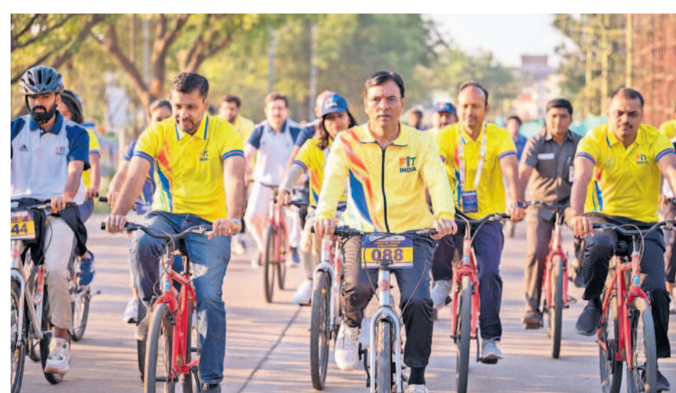
కస్తూరి 3వ డేస్లో పాల్గొన్న కేంద్ర యువజన, క్రీడా శాఖ మంత్రి మన్సుఖ్ మాండవీయ

మహిళా ఉద్యోగులను సత్కరించిన యూనియన్ నేతలు