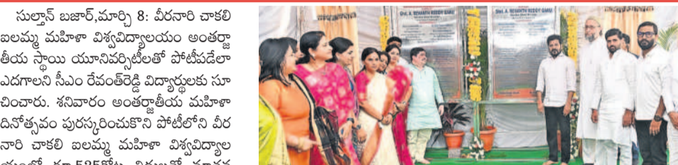
కోలలోని చాకలి బలమ్మ మహిళా విశ్వవిద్యాలయంలో శంకుస్థాపన చేస్తున్న సీఎం

500 కోట్ల నిధులతో కోలలోని వీరనారి చాకలి బలమ్మ మహిళా విశ్వవిద్యాలయంలో శంకుస్థాపన చేసిన సీఎం రేవంత్ రెడ్డి