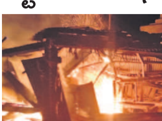
కట్టల కోత మిషన్లో అగ్ని ప్రమాదం