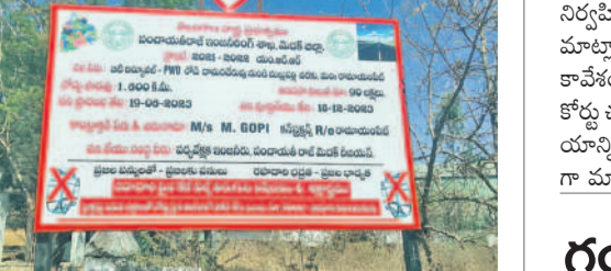
కాంట్రాక్టర్ ఏర్పాటు చేసిన బోర్డు

రామాయంపేట రూర్, మార్చి 8: మండలంలోని దామరచెర్వు బోటి రోడ్డు 1.6 కిలోమీటరు పొడవు ఉన్న నెలల రెన్యూవల్ నిర్మాణం చేపట్టారు. ఇందుకోసం ఎప్పటికీ ప్రభుత్వం రూ.90 లక్షలు మంజూరుచేసింది. సదరు కాంట్రాక్టర్లకు పనులను తూతూ మంత్రంగా చేపట్టి బిట్ట పొందారు. రోడ్డు