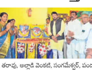
రామాయంపేట, మార్చి 8: విద్యా, వైద్యాన్ని మెరుగుపరుస్తామని మెడక్ ఎమ్మెల్యే రోహిణి రావు అన్నారు.

రామాయంపేట, మార్చి 8: విద్యా, వైద్యాన్ని మెరుగుపరుస్తామని మెడక్ ఎమ్మెల్యే రోహిణి రావు అన్నారు. శనివారం రామాయంపేటలోని శిశుమందిర్ వార్డులోని ఆయన హాజరయ్యారు. శిశుమందిర్ అంటే విజ్ఞానం, విశాసం, పట్టుదల, క్రమశిక్షణతో విద్యార్థులు ఉన్నత శిఖరాలకు చేరుకుంటారన్నారు. కార్యక్రమంలో పీసీసీ సభ్యులు సుప్రభా