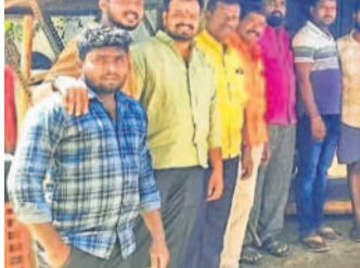
ఆర్థిక సాయం అందజేస్తున్న బీఆర్ఎస్ మాజీ ఎంపీ పురం రవి

మనోహరాబాద్, మార్చి 8: మండలంలోని రామాయంపేటలోని బండి యాదవమ్మకు చెందిన కిరాణి దుకాణంలో శుభవారం అగ్నిప్రమాదం జరిగింది. దీంతో వస్తువులు కాళి బూడిదయ్యాయి. విషయం తెలుసుకున్న బీఆర్ఎస్ మాజీ ఎంపీ పురం రవి