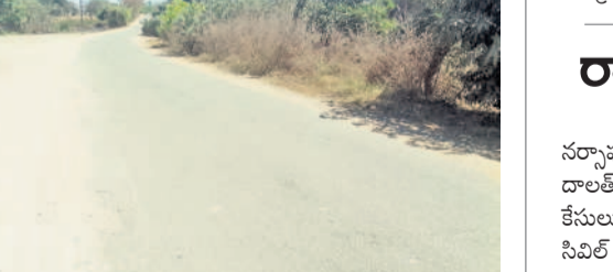
సూచిక బోర్డు లేక ప్రమాదకరంగా ఉన్న మూల మలుపు