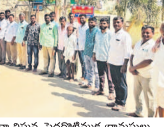
విరాళం అందజేసిన మహిళా గ్రూపును సన్మానిస్తున్న పెద్దగొట్టిముక్క గ్రామస్థులు

శివ్వంపేట, మార్చి 8: మండలంలోని పెద్దగొట్టిముక్క గ్రామంలో నిర్మిస్తున్న పెద్దమ్మతల్లి ఆలయానికి మాజీ జడ్పీటీసీ పట్టమహిళా గ్రూపు రూ.11వేల నగదును ఆలయ కమిటీ సభ్యులకు శనివారం విరాళంగా అందజేశారు. అనంతరం మాజీ జడ్పీటీసీని సన్మానించారు. పట్టమహిళా గ్రూపులో ఫీల్డ్ ఆఫీసర్లు మృతి చెందారు. ఆ కుటుంబాలకు విరాళం చేసారు. 10 వేలు, అదే గ్రామంలో