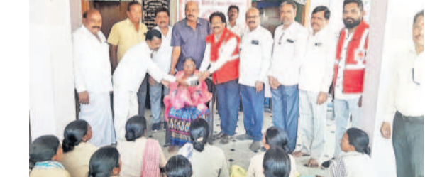
రామాయంపేట: మున్సిపాలిటీలో పాలశుద్ధ్య కార్మికులకు టిఫిన్ బాక్సులను అందించి సన్మానిస్తున్న రెడ్ క్రాస్ సొసైటీ సభ్యులు