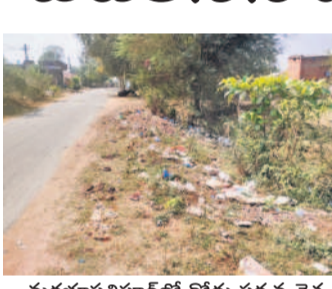
మక్కభూపతిపూర్లో రోడ్డు పక్కన చెత్త

మెడక్ పూర్, మార్చి 8: ప్రత్యేకాధికారుల పాలనలో పారిశుధ్యం పడకెసినది. మెడక్ మండలంలోని పల్లెలో పారిశుధ్యాన్ని పట్టించుకోకపోవడంతో ఎక్కడ చూసినా చెత్తా చెదారం దర్శనమిస్తున్నది. సర్కారుకు బదపీ కాలు ముగిసినప్పటి నుంచి గ్రామాలను పట్టించుకున్న నాడుకు కరువయ్యాడు. పంచాయతీలో నిధులు లేక, ప్రత్యేకాధికారులు నామమాత్రంగా పని చేస్తున్నారు. కొన్ని గ్రామాలలో వీధినిపాలు పనిచేయడం లేదు.