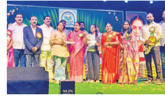
నర్సాపూర్: దానివాళ్ళ స్కూల్లో విద్యార్థులకు బహుమతులు అందజేస్తున్న ఎమ్మెల్యే సునీతారెడ్డి