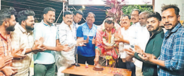
మెడక్ మున్సిపాలిటీ, మార్చి 8: బీఆర్ఎస్ పట్టణ కన్వీనర్ పుట్టిన రోజు