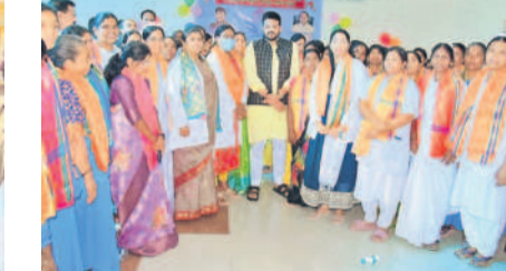
మెడక్ మున్సిపాలిటీ: దవాఖానలో ఎమ్మెల్యే రోహిణి