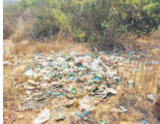
తిమ్మానగర్ దారిలో పడకెసిన చెత్త

మిషన్ భగదత్ పీఠిక, ప్రత్యేకాధికారులు అందుబాటులో లేక ఇబ్బందులు పడుతున్నారని. సమస్యలు ఎవరికీ చెప్పాలో తెలియడం లేదని ప్రజలు ఆవేదన వ్యక్తం చేస్తున్నారు.