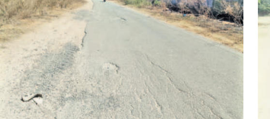
గుంతలమయంగా దామరచెర్వు బోటి రోడ్డు