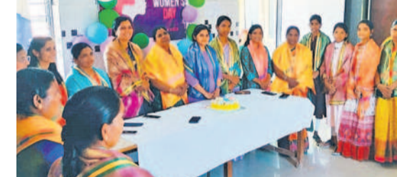
కొడిపల్లి: స్థానిక ప్రాథమిక ఆరోగ్య కేంద్రంలో కేక్ కట్ చేసుకుని సంబరాలు జరుపుకొంటున్న మహిళా ఉద్యోగులు