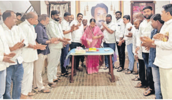
నర్సాపూర్ క్యాంపు కార్యాలయంలో కార్యక్రమ సమక్షంలో కేక్ కట్ చేస్తున్న ఎమ్మెల్యే సునీతారెడ్డి