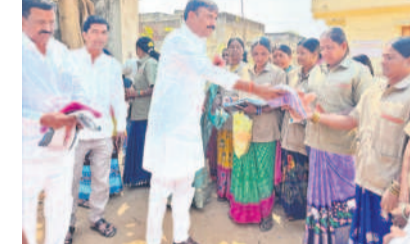
నర్సాపూర్: బీరలు పంపిణీచేస్తున్న ఎమ్మెల్యే