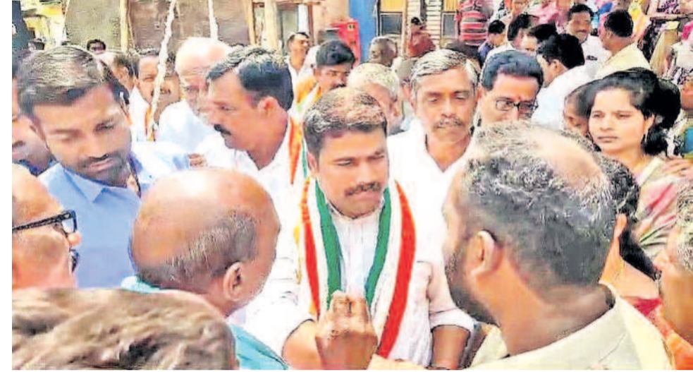
అదివారం కరీంనగర్ జిల్లా గంగాధర మండలం కులక్కాలలో కాంగ్రెస్ ఎమ్మెల్యే మేడిపల్లి నరేంద్రుని సగ తగిలించి, సాగునీరందక వంటలు ఎందుకున్నా పట్టించుకోవడంలేదని రైతులు నిలదీశారు. రుణమాఫీ పూర్తి చేయలేదని, రైతుభరోసా ఇవ్వడం లేదని ఆగ్రహం వ్యక్తం చేశారు. గర్భకుల్లిన మండల కేంద్రం చేస్తానంటూ గతంలో ఇచ్చిన హామీ ఏమైందని ప్రశ్నించారు.