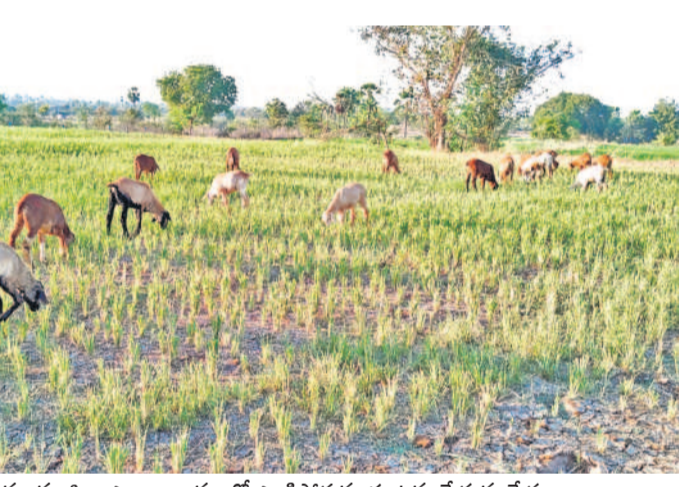
జనగామ జిల్లా ఎల్లం గ్రామంలో ఎండిపోతున్న పంటలు మేస్తున్న మేకలు

దేవపల్లెపల్లి పంపుహౌస్ వల్ల అందకపోయాయి. సైబన్ ఫున్ ఫున్ రిజర్వాయర్ నుంచి నవాబ్ పేట రిజర్వాయర్ ద్వారా మండలంలోని వాగులలో ఆ సంస్థ కమిషనరులకు, సిబ్బందికి