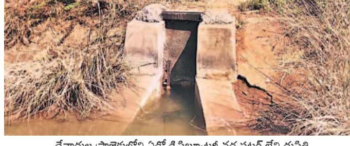
దేవాదుల ప్రాజెక్టులోని ఏడో డిస్ట్రిబ్యూటర్ వద్ద షట్టర్ లేని దుస్థితి

వరంగల్, మార్చి 9(నమస్తే తెలంగాణ ప్రతినిధి): దేవాదుల ప్రాజెక్టు ఆయకట్టు రైతాంగానికి అక్షతప్పిలు మొదలయ్యాయి. యానంగి పంటలకు సాగునీరు అందకపోవడం వల్ల రైతులు అసంతోషంగా ఉన్నారు. సాగునీరు నిర్వహణలో మందకొడిగా సాగునీరు అందకపోవడం వల్ల రైతులు అసంతోషంగా ఉన్నారు. సాగునీరు నిర్వహణలో మందకొడిగా సాగునీరు అందకపోవడం వల్ల రైతులు అసంతోషంగా ఉన్నారు.