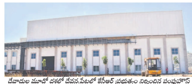
దేవాదుల మూడో దశలో దేవపల్లెపల్లిలో కేసీఆర్ ప్రభుత్వం నిర్మించిన పంపుహౌస్

ఆంధ్రప్రదేశ్ లోని రాజమండ్రి వ్యాప్తంగా ప్రధానంగా అన్నమయ్య అంశం ప్రాచుర్యం పొందింది. అన్నమయ్య అంశం ప్రాచుర్యం పొందింది. అన్నమయ్య అంశం ప్రాచుర్యం పొందింది.