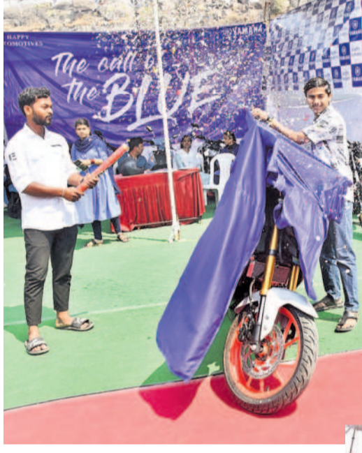
యమహా టైల్ సొంతమైన సంబురంలో పంజీకృష్ణ