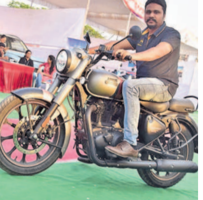
టెన్వైద్ చేస్తున్న కంపెనీ ప్రతినిధి