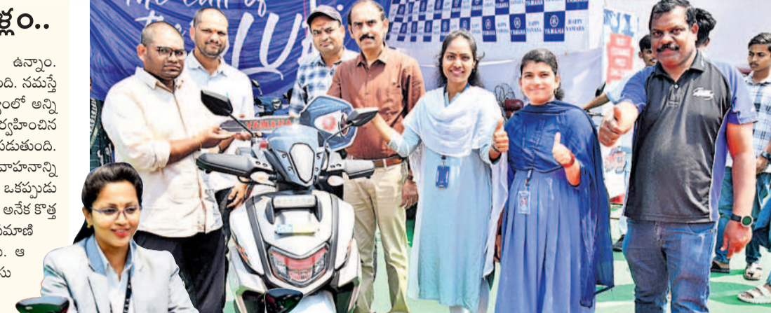
షోరూం నిర్వాహకుల నుంచి టైల్ అందుకుంటున్న వినియోగదారుడు