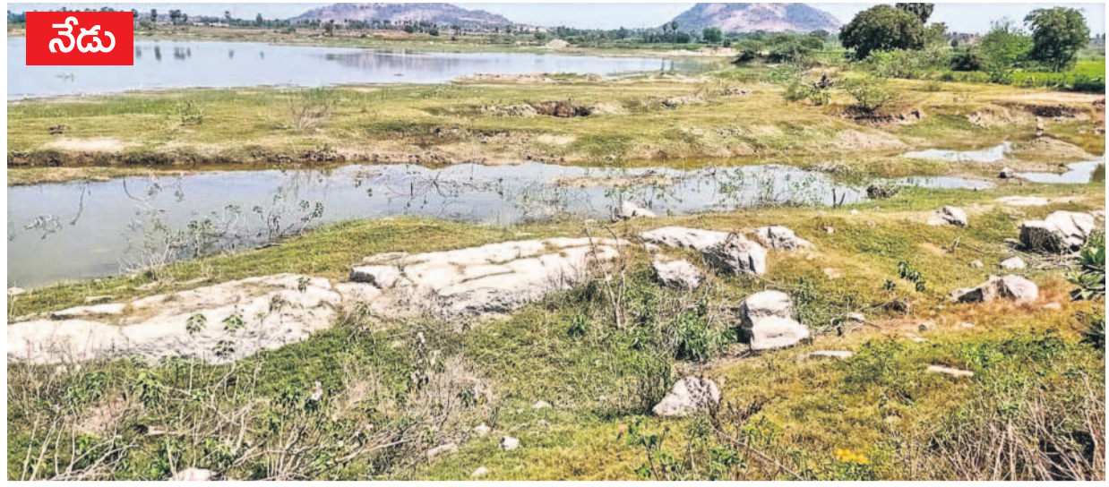
ప్రస్తుతం నీళ్లు అడుగంటి రాళ్లు తేలిస్తే రావిచెరువు