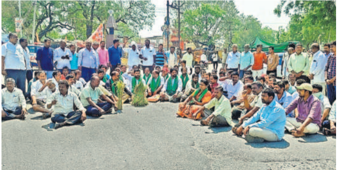
జనగామ జిల్లా బచ్చన్నపేటలో బీఆర్ఎస్ ఆధ్వర్యంలో ధర్నా చేస్తున్న రైతులు, నాయకులు