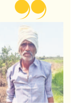
-భూకృషి పంచాయితీ, రైతు, గూడెంపేట తండా, పెన్వహాడ్ మండలం, సూర్యాపేట జిల్లా

కేసీఆర్ పూర్తి చేసిన కాశ్యపరం గోదావరి నీళ్లు కాల్వకు వచ్చినాయి. నేను నాలుగేండ్లగా రావి చెరువు కింద కొంత భూమిని తీసుకొని వేస్తున్నా. ఈ ఏడాది నీళ్లు రాకపోవడంతో చెరువు ఎండిపోతున్నది. చెరువు కింద సాగు చేసిన పంట పొలాలు ఇప్పటికే సగం వరకు ఎండిపోయాయి. పొట్లకు వచ్చిన దశలో ఎండు తుండలంతో కాపాడుకునేందుకు చెరువులోకి పైపులు వేసి నీటిని అందిస్తున్నాం. పూర్తి పంట అయ్యేంత వరకు ఆ నీళ్లు కూడా అందుతాయని లేదో తెలుసు.