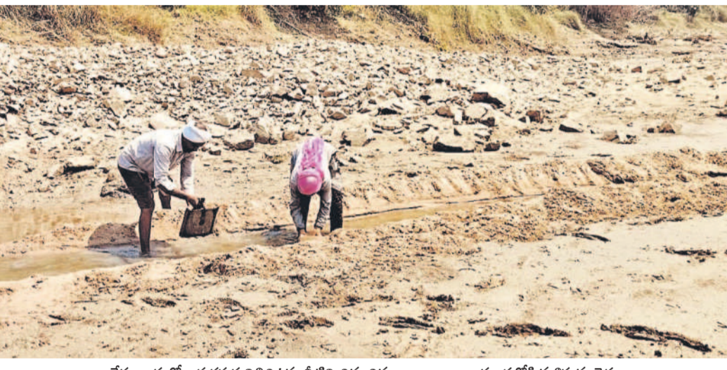
అతేరు వాగులో అక్కడక్కడ నిలిచిన నీటిని చిన్న చిన్న కాల్వల ద్వారా గుంతలోకి మళ్ళిస్తున్న రైతులు