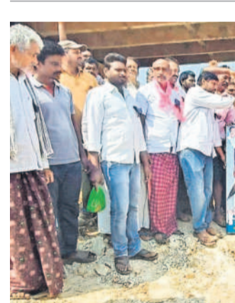
సీతారామ ప్రాజెక్టు నిర్మించిన కేసీఆర్కు ప్రత్యేక కృతజ్ఞతలు తెలుపుతూ గుంపిన శివారులోని కాలువ వద్ద ఆయన ఫ్లెక్సిటీ పాలు, గోదావరి జిల్లాలో అభిషేకం చేస్తున్న సీతారామ ప్రాజెక్టు నిర్మాణ రైతులు

పర్యవేక్షణ, మార్చి 9: వరంగల్ జిల్లా పర్యవేక్షణ మండలం ఇన్చార్జ్ తండాలో 25 కేబీ విద్యుత్ ట్రాన్స్మిషన్ కాలిపోవడంతో రైతులు ఇబ్బంది పడ్డారు. ఈ విషయాన్ని విద్యుత్ శాఖ అధికారులకు సమాచారం ఇచ్చినా స్పందించలేదు. దీంతో రైతులే ఎడమదిలో ట్రాన్స్మిషన్లను తీసుకొచ్చి పర్యవేక్షణ సహాయంతో చేర్చారు. ఆదివారం మరో ట్రాన్స్మిషన్లను తీసుకొచ్చి వారే బిగించుకున్నారు. నాణ్యమైన విద్యుత్ సరఫరా చేయకపోవడంతోనే ట్రాన్స్మిషన్లతోపాటు మోటార్లు కాలిపోతున్నాయని రైతులు వాపోతున్నారు. ఇప్పటికైనా అధికారులు స్పందించి నాణ్యమైన విద్యుత్ అందించాలని కోరుతున్నారు.