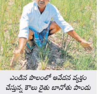
ఎండిన పొలంలో ఆవేదన వ్యక్తం చేస్తున్న కౌలు రైతు బానోతు మండు