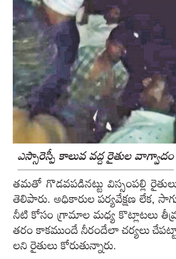
ఎస్సార్సీ కాలువ వద్ద రైతుల వాగ్వాదం

చిన్నగూడూరు, మార్చి9: సర్కార్ నిర్లక్ష్యంతో ఎస్సార్సీ జలాలు కోసం రెండు గ్రామాల రైతులు కొట్లాటుకు పుట్టిన శని వారం రాత్రి మహబూబాబాద్ జిల్లాలో చోటుచేసుకున్నది. మరివెడ మండలంలోని ఆర్ధగడ్డ తండా నుంచి వెళ్ళే డీబీఎం 80 ప్రధాన కాలువ నుంచి 18ఎంట్ల ఉప కాలువ దుబ్బితండా, బాల్యతండాల మీదుగా చిన్న గూడూరు మండలంలోని విన్నంపల్లి, తుమ్మల చెరువుతండా గ్రామాల చెరువులకు వెళ్తుంది. విన్నంపల్లి, తుమ్మల చెరువు తండా ఆయకట్టు రైతులు కలిసి రూ.70 వేలు ఖర్చు పెట్టుకుని కాలువను బాగుచేసుకున్నారు. తీరా నీళ్ళొచ్చే సమయానికి బాల్యతండా వాసులు ఎస్సార్సీ కాలువకు అడ్డుకట్ట వేసి తమ నీటిని మళ్ళించుకున్నారు. తమ గ్రామానికి కూడా నీళ్లు వదలాలని పలుమార్లు చెప్పినప్పటికీ బాల్యతండా వాసులు వినకుండా