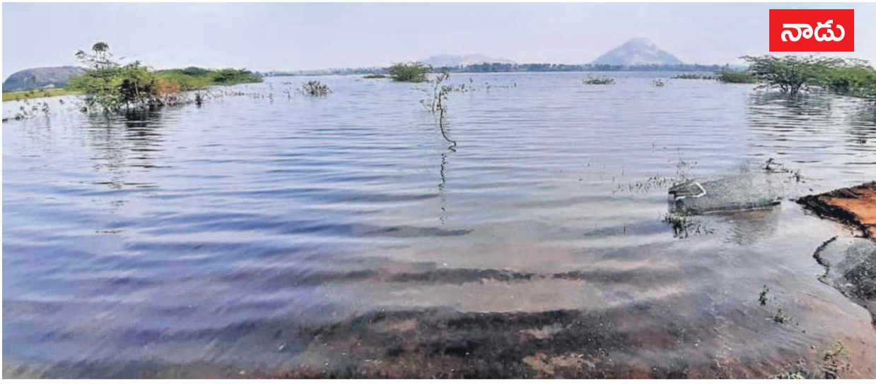
2023లో కాశ్యపరం నీటితో కళకళలాడుతున్న సూర్యాపేట జిల్లా పెన్వహాడ్ మండలం మాచారం వద్దలోని రావి చెరువు