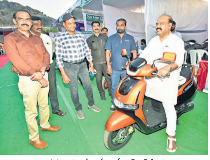
హనుమకొండ ఆటో షోల్ నూటీస్ టెన్స్ టైమ్ చేస్తున్న శాసనమండలిలో విజ్ఞాన సలికొండ ముందు సందర్శన