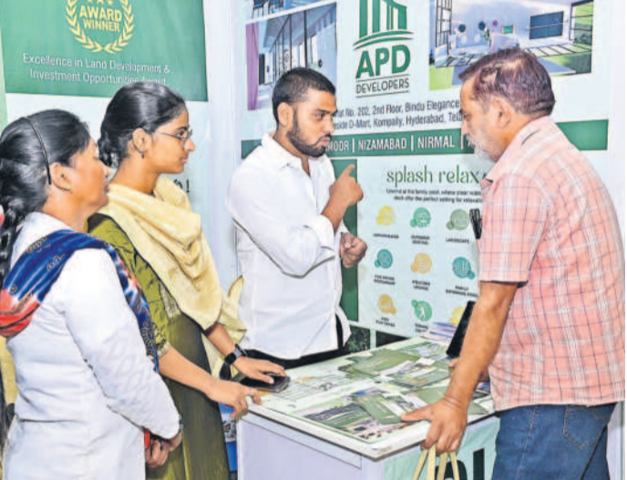
నిజామాబాద్ ప్రావృత్తి షోల్ స్టాల్ వద్ద వివరాలు తెలుసుకుంటున్న సందర్శకులు