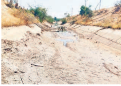
నీరులేక బోసిపోయిన సంగంబండ కాల్వ