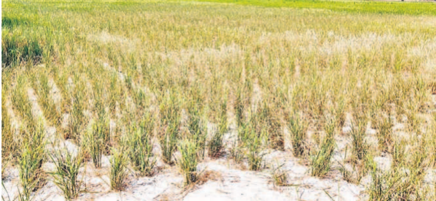
మాగనూరు మండలం అడవిసత్యారంలో సాగునీరు లేక ఎండిపోయిన వలపంట

మాగనూరు, మార్చి 9 : వరిపంటలకు భూగర్భజలాల అడుగంటి చుక్కనీరు రాక పొలాలు బీటలుగా మారాయి. మాగనూరు మండలం కొల్లూర్ పరి డో అడవి సత్యారం, కొల్లూర్, మందిపల్లి, పుంజనూరు