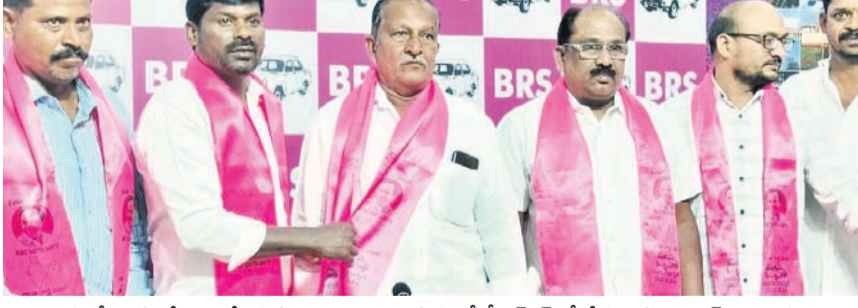
అచ్చంపేట మాజీ ఎమ్మెల్యే గుమ్మల బాలరాజు సమక్షంలో బీఆర్ఎస్ లో చేరుతున్న కాంగ్రెస్ నాయకులు