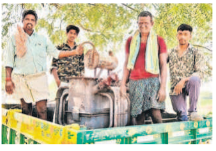
కాలిపోయిన ట్రాన్స్ ఫార్మర్లను తీసుకెళ్తున్న రైతులు

మాగనూరు, మార్చి 9 : వరిపంటలకు భూగర్భజలాల అడుగంటి చుక్కనీరు రాక పొలాలు బీటలుగా మారాయి. మాగనూరు మండలం కొల్లూర్ పరి డో అడవి సత్యారం, కొల్లూర్, మందిపల్లి, పుంజనూరు