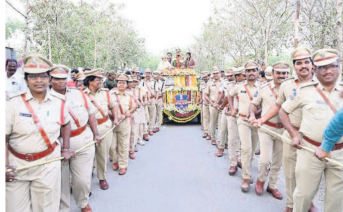
ఎస్పీ ఉన్న ప్రత్యేక వాహనం తాడును లాగుతున్న పోలీసులు స్వాగతం సాగించి తనదైన ముద్రను అదిలాబాద్ జిల్లాలో ప్రారంభించామన్నారు. డి