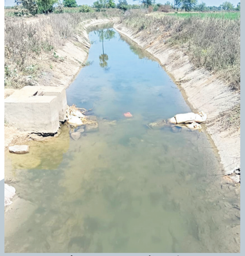
కాలవలో తూముకు దిగువన తక్కువ మట్టంలో పారుతున్న నీరు