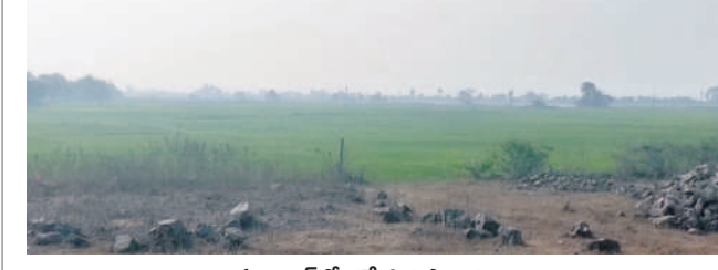
దస్తూరాబాద్ లో కమ్మేసిన పొగ మంచు

దస్తూరాబాద్, మార్చి 9 : మార్చి నెలలో ఓ వైపు పగడి పూట ఎండలు ముడుచుకున్నప్పటికీ రాత్రి నుంచి తెల్లవారు జాము వరకూ వాతావరణంలో భిన్న మార్పులు కనిపిస్తున్నాయి. ఆదివారం మండలాన్ని పొగ మంచు కమ్మేసింది. వేసవి కాలంలోను శీతాకాలాన్ని తలపించింది. వేసవి కాలం సమీపిస్తున్న డిసెంబర్, జనవరి నెలల వలే ఉడయం, రాత్రి వేళలో చలి బజికిస్తుంది. పగటి పూట మాత్రం సూర్యుడు తన ప్రతాపాన్ని చూపిస్తున్నాడు. ఇలా వాతావరణం మార్పుతో ప్రజలు ఇబ్బందులు పడుతున్నారు. పచ్చని పొలాల్లో మంచు కమ్ముకోవడంతో శీతాకాలాన్ని తలపించింది.