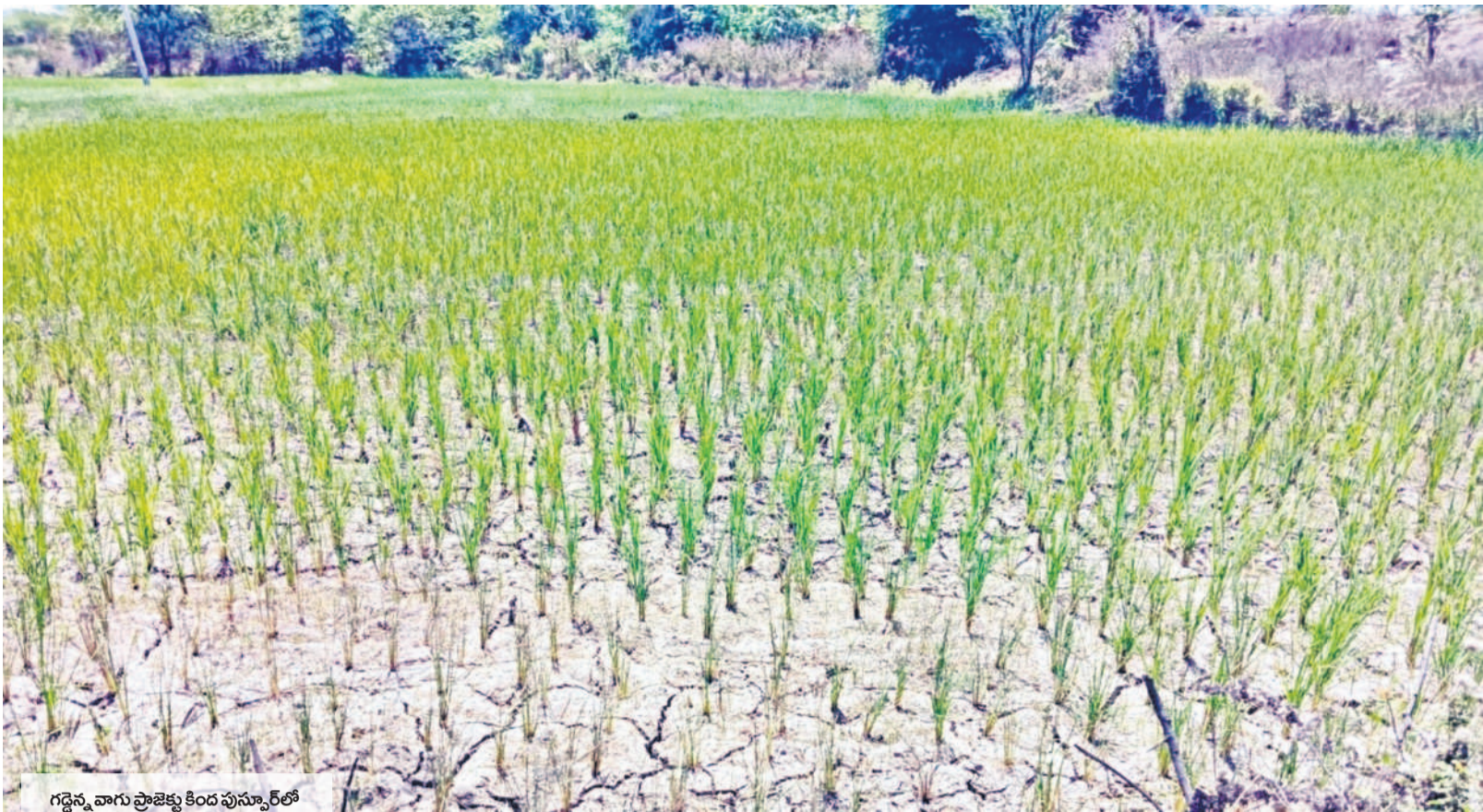
గడ్డెన్నవారు ప్రాజెక్టు కింద పుస్కార్ లో నిరంతరం అందిన వరి పైరు