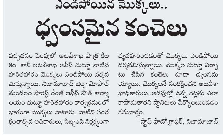
పార్వే రేంజ్ ఆఫీస్ సౌత్ కార్యాలయం చుట్టూ ఎండిపోయిన మొక్కలు

చచ్చడం పెంపుతో అటవీశాఖ పాత్ర కీలకం. కానీ అటవీశాఖ ఆఫీస్ చుట్టూ నాటిన హరితహారం మొక్కలు ఎండిపోయి దర్శనమిస్తున్నాయి. నిజామాబాద్ జిల్లా మోపాల్ మండలం పార్వే రేంజ్ ఆఫీస్ సౌత్ కార్యాలయం చుట్టూ హరితహారం కార్యక్రమంలో భాగంగా మొక్కలు నాటారు. వాటిని సరంక్షించాలని అధికారులు, సిబ్బంది నిర్లక్ష్యంగా వ్యవహరించడంతో మొక్కలు ఎండిపోయి కంకణాలుగా మారుతున్నాయి. మొక్కలనే సరంక్షించని అటవీశాఖాధికారులు.. అడవుల్లో ఉన్న చెట్లను ఎలా కాపాడుతారని స్థానికులు పేర్కొంటుండడం గమనార్హం.