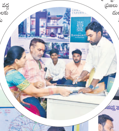
స్టాక్ వద్ద వివరాలు తెలుసుకుంటున్న సందర్శకులు