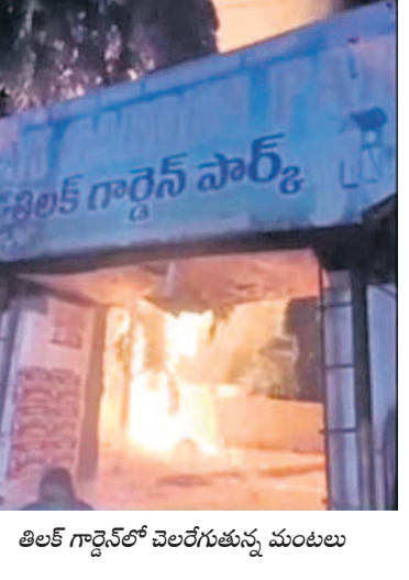
తిలక్ గార్డెన్ లో చెలరేగుతున్న మంటలు

విషయం తెలుసుకున్న అగ్గిమాపక శాఖ సిబ్బంది హుటా హుటే అక్కడికి చేరుకున్నారు. గార్డెన్ లో మంటలు దాగింది పంటలు అదుపు చేశారు. అసలు మంటలు ఎలా అంటుకున్నాయోనే విషయం అంతు పట్టడంలేదని పార్క్ నిర్వాహకులు పేర్కొన్నారు. పార్క్ కు వచ్చిన వారిలో ఎవరో పోకీరీలు ఉద్దేశపూర్వకంగానే అక్కడ నిప్పంటించి ఉంటారనే అనుమానాలు సైతం వ్యక్తంవుతున్నాయి. ఈ ప్రమాదం గార్డెన్ పర్యాటకులు పెద్దసంఖ్యలో తరలివచ్చారు. ఆకస్మాత్తుగా మంటలు చెలరేగడంతో భయాందోళనకు గురయ్యారు. విషయం తెలుసుకున్న అగ్గిమాపక శాఖ సిబ్బంది హుటా హుటే అక్కడికి చేరుకున్నారు. గార్డెన్ లో మంటలు దాగింది పంటలు అదుపు చేశారు. అసలు మంటలు ఎలా అంటుకున్నాయోనే విషయం అంతు పట్టడంలేదని పార్క్ నిర్వాహకులు పేర్కొన్నారు. పార్క్ కు వచ్చిన వారిలో ఎవరో పోకీరీలు ఉద్దేశపూర్వకంగానే అక్కడ నిప్పంటించి ఉంటారనే అనుమానాలు సైతం వ్యక్తంవుతున్నాయి. ఈ ప్రమాదం గార్డెన్ పర్యాటకులు పెద్దసంఖ్యలో తరలివచ్చారు. ఆకస్మాత్తుగా మంటలు చెలరేగడంతో భయాందోళనకు గురయ్యారు.