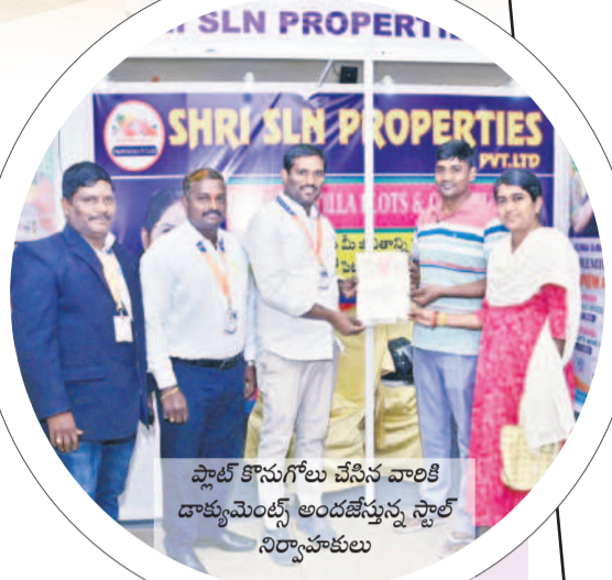
ప్రావర్తి షోలోని వేణుమాల్లో డాక్యుమెంట్స్ అందజేస్తున్న స్టాల్ నిర్వాహకులు

సందర్శకులు అభినందించారు. నగరవాసులకు అందుబాటులో.. నిజామాబాద్ నగరవాసులకు వ్యయభారం కాకుండా వినూత్న ఆలోచనలతో సమస్తే తెలంగాణ, తెలంగాణ టుడే ప్రావర్తి షో నిర్వహిస్తున్నది. ప్రతి సంవత్సరం ఏడో ఒక కార్యక్రమంతో ప్రజల ముందుకు ఆలోచన తీసుకువస్తున్నది. ఆలోచనలో కొనుగోలు దారుల అభిరుచులకు అనుగుణంగా వివిధ కంపెనీల వాహనాలను అందుబాటులోకి తెచ్చింది. అన్ని పరిష్కార ఉన్న సంస్థలే ప్రావర్తి. ఆలోచనలో అనుమతిస్తున్నది. ప్రజలు మోసపోకుండా ఎలాంటి ఇబ్బందులు కలుగకుండా ఉండేందుకు ముఖ్యంగా మూడో సారి ప్రావర్తి షో నిర్వహించినట్లు నిజామాబాద్ సమస్తే తెలంగాణ ట్రాన్స్ మేనేజర్ ధర్మాజి తెలిపారు. కార్యక్రమంలో సమస్తే తెలంగాణ బ్యాంకో చీఫ్ జూబిల్ రిమేట్, ఏడీ వీటి సిబ్బంది పాల్గొన్నారు.