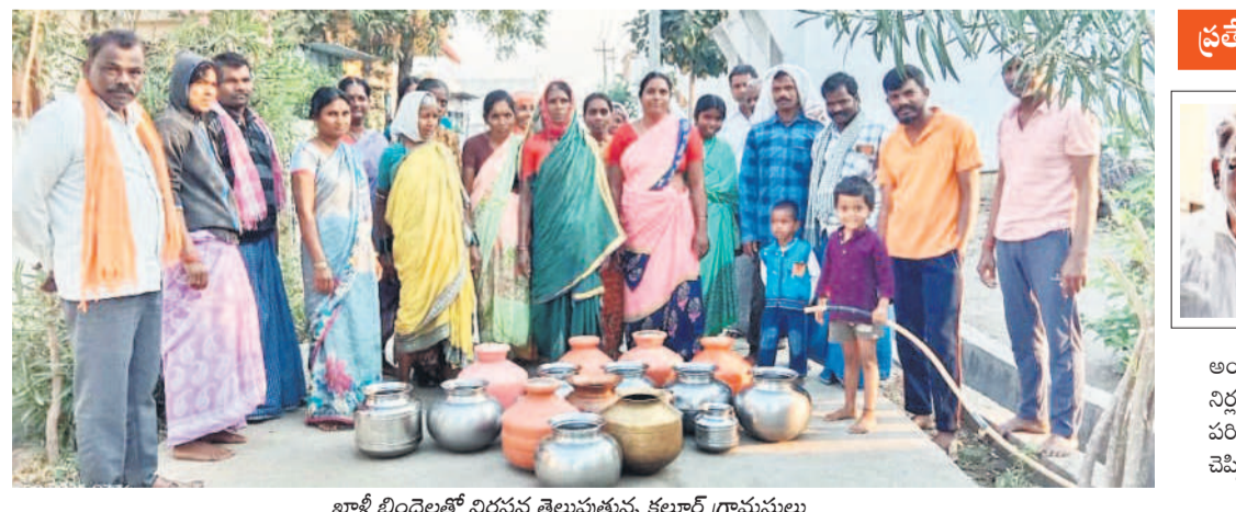
ఖాళీ బిందెలతో నిరసన తెలుపుతున్న కల్లూర్ గ్రామస్థులు