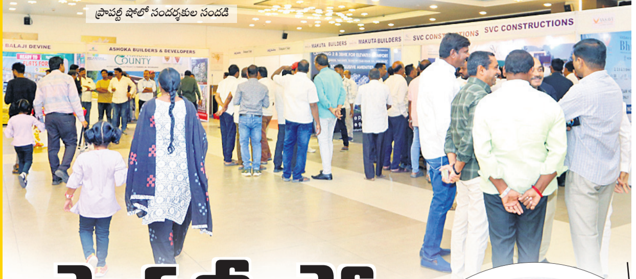
ప్రావర్తి షోలో సందర్శకుల సందడి