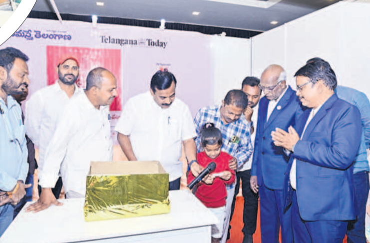
లక్ష్మీ విజిటర్ డ్రా తీస్తున్న ఓ చిన్నారు