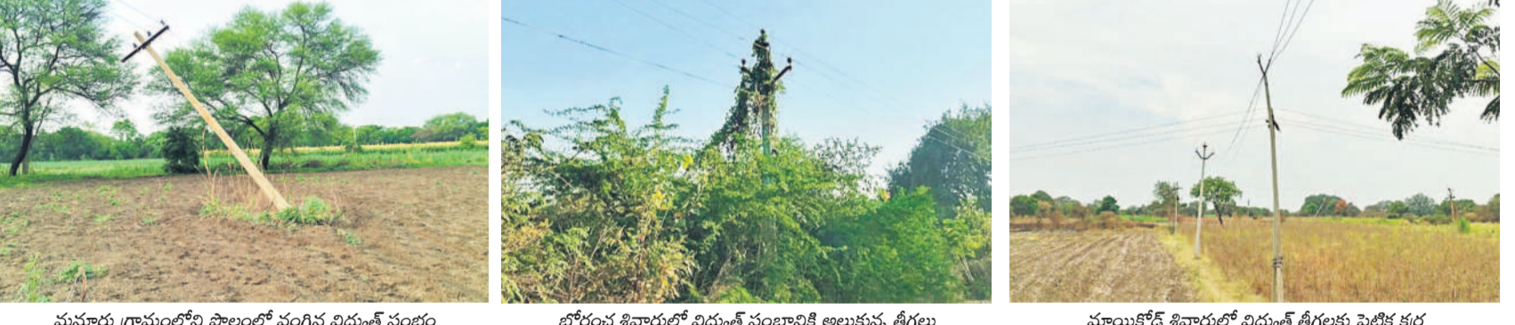
మనూరు గ్రామంలోని పొలంలో వంగిన విద్యుత్ స్తంభం, బోరుచం శివారులో విద్యుత్ స్తంభానికి అల్లుకున్న తీగలు, మాంకోడ్ శివారులో విద్యుత్ తీగలకు పెట్టిక కర్ర