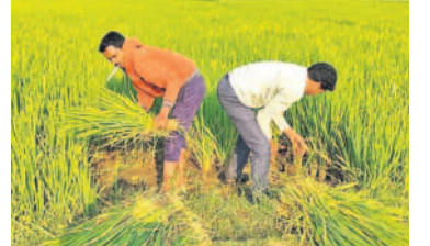
కొమురవెల్లిలో ఎండిన వరిని కోస్తున్న రైతు కేసీఆర్ సీఎంగా ఉన్నప్పుడు ఒక్క గుంట ఎండలేదని, గిప్పుడు 4 ఎకరాల పంట పశువులకు మేతగా వేశానని, రూ. 1.20 లక్షల నష్టం వాటిల్లినన్నారు.

కొమురవెల్లి, మార్చి 9: కాంగ్రెస్ పాలనలో రైతులకు నీళ్ల కష్టాలు మొదలయ్యాయి. కొమురవెల్లికి చెందిన రైతు సార్ల సర్పంచులు యాసంగిలో ఎనిమిది ఎకరాలలో వరి పంట వేశాడు. కొన్ని రోజులుగా నాలుగు బోర్ల నుంచి నీళ్లు తక్కువగా వస్తుండడంతో వరి పంటకు పూర్తిగా నీళ్లు అందడం లేదు. తపోస్పర్థి రిజర్వాయర్ ద్వారా కాలువల్లోకి నీళ్లు వదులుతారని చూసిన రైతు సర్పంచులుకు నిరాశ మిగిలింది. కేసి డేమి లేక వేసిన పంటలో సగమైన కాపాడుకుందామని పొట్ట దశకు వచ్చిన 8 ఎకరాల వరిలో 4 ఎకరాల వరి పంటను కోసి పశువులకు మేత వేశాడు. ఈ సందర్భంగా రైతు సర్పంచులు మూడుతుతూ..