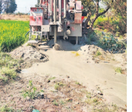
సిద్దిపేట జిల్లా చేర్యాల మండలం అకుసురులో బోరు తవ్విస్తున్న దృశ్యం

సిద్దిపేట జిల్లాలో 7.28 మీటర్లు, మెదక్ జిల్లాలో 10.46 మీటర్లు, సంగారెడ్డి జిల్లాలో 9.75 మీటర్ల లోతులో జలమట్టం ఉంది. కాంగ్రెస్ ప్రభుత్వం వచ్చాక ఈసారి 2025లో జనవరి నెలలో సిద్దిపేట జిల్లాలో 10.60 మీటర్లు, మెదక్ జిల్లాలో 10.89 మీటర్లు, సంగారెడ్డి జిల్లాలో 10.27 మీటర్లు ఉంది. ఫిబ్రవరి నెలలో సిద్దిపేట జిల్లాలో 12.14 అంటే 5 మీటర్ల లోతుకు పడిపోయింది. మెదక్ జిల్లాలో 13.25 మీటర్లు ఇక్కడ 3.25 మీటర్ల లోతుకు, సంగారెడ్డి జిల్లాలో 12.60 మీటర్లు ఇక్కడ 3 మీటర్ల లోతుకు భూగర్భజలాలు పడిపోయాయి. కేసీఆర్ పాలనలో భూగర్భజలాలు మెరుగ్గా ఉన్నాయి. కాంగ్రెస్ పాలనలో భూగర్భజలాలు అడుగుంటే పంట పొలాలు ఎండిపోతున్నాయి. వాటని కాపాడుకోవడానికి రైతు ఆరిగిన పడుతున్నారు.