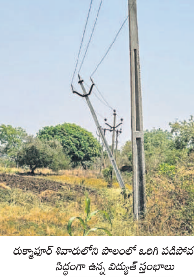
దుర్గాపూర్ శివారులోని పొలంలో ఒరిగి పడిపోవడానికి సిద్ధంగా ఉన్న విద్యుత్ స్తంభాలు

పలుచోట్ల ప్రమాదకరంగా విద్యుత్ స్తంభాలు చేతికండ్ల ఎత్తులో వేలాడుతున్న తీగలు బిక్కుబిక్కుమంటున్న రైతులు