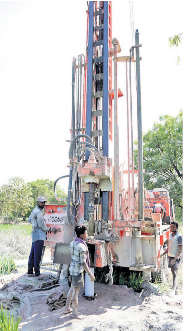
వ్యవసాయానికి నీరందక సంగారెడ్డి జిల్లాలోని పుల్లూలో బోరు వేస్తున్న దృశ్యం