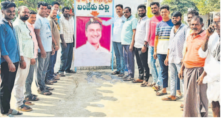
బంజేరుపల్లిలో హాళిరావు చిత్రపటానికి క్షీరాభిషేకం చేస్తున్న రైతులు