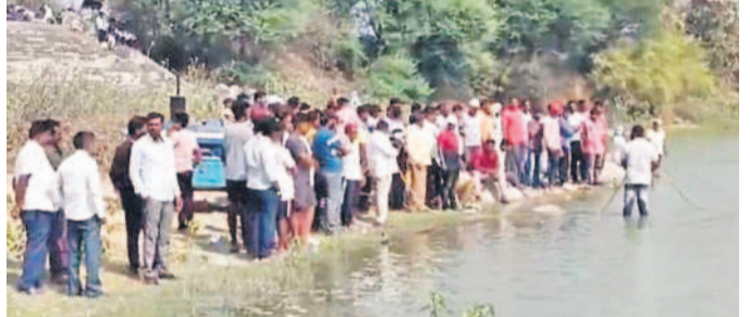
చెరువులో గాలిస్తున్న అధికారులు