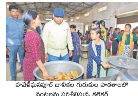
హావేలిపునపూర్ బాలికల గురుకుల పాఠశాలలో పంటలను పరిశీలిస్తున్న కలెక్టర్

మెదక్ మున్సిపాలిటీ, మార్చి 9: గురుకులాల, వసతి గృహాల్లో రోజూ వారి మెనూ పక్కాగా అమలుచేయాలని కలెక్టర్ రాహుల్ రాజ్ అధికారులను ఆదేశించారు. ఆదివారం హావేలిపునపూర్ మండల కేంద్రంలోని మహాత్మా జ్యోతిబా పూలే బాలికల గురుకుల పాఠశాలను తనిఖీ చేశారు. పాఠశాలలోని పంట గది, సరుకుల నిల్వ, పప్పులు, వంట నూనె, బియ్యం, కూరగాయలు, ఆకుకూరలు వంటివి, నాణ్యతా ప్రమాణాలు పాటించాలని సూచించారు. అనంతరం పాఠశాలలోని ప్రయోగశాలను పరిశీలించారు. పాఠశాలలోని పంట గది, సరుకుల నిల్వ, పప్పులు, వంట నూనె, బియ్యం, కూరగాయలు, ఆకుకూరలు వంటివి, నాణ్యతా ప్రమాణాలు పాటించాలని సూచించారు. అనంతరం పాఠశాలలోని ప్రయోగశాలను పరిశీలించారు.