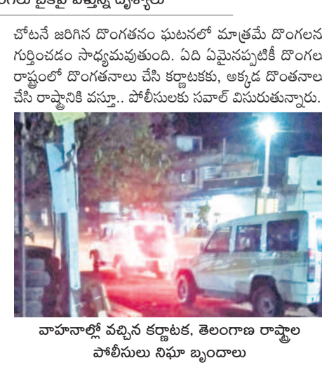
హాహాలో వచ్చిన కర్ణాటక, తెలంగాణ రాష్ట్రాల పోలీసులు నిఘా బృందాలు

చేపట్టారు. డోపిడీ దొంగలు డబ్బుల వెళ్లడం బైక్పై బీదర్ పట్టణ సమీపంలోని సుల్తాన్పూర్ గ్రామ చౌరస్థాలో ఉన్న సీసీ కెమెరాలో న్యూకెల్ వైపు వస్తున్న దృశ్యాలు రికార్డుయ్యాయి. అక్కడ నుంచి న్యూకెల్, మునూర్, రాయకోడ్, మునిపల్లి, సంగారెడ్డి, జోగిపేట్, పటనెరెవె ప్రాంతాల్లోని సీసీ కెమెరాల్లో దొంగలు వెళ్తున్న దృశ్యాలు నమోదు కాకపోవడం పోలీసులకు అతుకుటప్పడంలేదు. రెండు రాష్ట్రాలకు చెందిన పోలీసుల కళ్లు కప్పి అడ్డదారుల్లో దొంగలు ఎలా చేరుతున్నారో కోణంలో నిఘా వర్గాలు దర్యాప్తు చేస్తున్నాయి. బంగాళు ఆభరణాలు తరలివేస్తే వ్యక్తులు, స్థిరాస్థి వ్యాపారులు, బ్యాంకులలో లక్షలాది డోపిడీ దొంగలు పక్కా ప్రణాళికలతో ఆయా ప్రాంతాల్లో చోరీలకు పాల్పడుతున్నారు. ఇందుకు దొంగలు జమ్మిరాబాద్ నుంచి సరైన ప్రాంతంగా ఎంచుకున్నారు. రెండు మూడు సంవత్సరాల క్రితం ప్రజాప్రతినిధులు, కంపెనీలు, దాతల సహకారంతో ప్రధాన రోడ్డు మార్గాల్లో ఏర్పాటు చేసిన సీసీ కెమెరాల ద్వారా పసిపేయడం లేదని తెలిసింది. సీసీ కెమెరాల ఉన్న