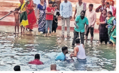
ముత్యదేవస్వామి వెలికితీస్తున్న సీనియర్