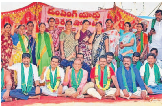
గుమ్మడిదలలో రిలే నిరాహార దీక్షలో పాల్గొన్న సభ్యులు, జేపీసీ నాయకులు