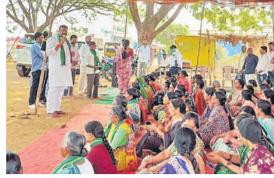
నల్లపల్లి రిలే నిరాహార దీక్షలో పాల్గొన్న గ్రామస్థులు