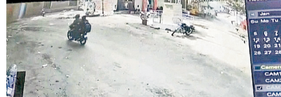
కర్ణాటక రాష్ట్రం బీదర్ జిల్లా సరిహద్దు ప్రాంతంలోని సుల్తాన్పూర్ గ్రామ చౌరస్థాలో సీసీ కెమెరాలో నమోదైన దొంగలు బైక్పై వెళ్తున్న దృశ్యాలు

జమ్మిరాబాద్, మార్చి 9: సంగారెడ్డి జిల్లా సరిహద్దు ప్రాంతంలోని కర్ణాటక రాష్ట్రం బీదర్ జిల్లా కేంద్రంలో రాబర్ల మిస్సరిగానే మిగిలిపోయింది. పట్టుగల్గే అందరూ చూస్తుండగానే సీఎంఎస్ సిక్యూరిటీ, ఉద్యోగులపై కాల్పులు జరిపి ఏటీఎంలలో తగ్గదస్తున్న రూ.93 లక్షలను దొంగలు ఎత్తికెళ్లిన విషయం తెలిసింది. రెండు రాష్ట్రాల పోలీసుల కళ్లు కప్పి దొంగలు సంగారెడ్డి జిల్లా మీదుగా హైదరాబాద్ కు ఎలా వెళ్లారు. అక్కడ నుంచి పోలీసులు క్రమంలో కాల్పులకు పాల్పడడంతో నిఘా వర్గాలు లోతుగా దర్యాప్తు చేపడుతున్నారు. కర్ణాటక, తెలంగాణ రాష్ట్రాలకు చెందిన నిఘా వర్గాల బృందాలు జిల్లాలోని న్యూకెల్లో మండలంలో పలు ప్రాంతాల్లో ఉన్న సీసీ కెమెరాల్లో డోపిడీ దొంగలు బైక్పై వెళ్తున్న దృశ్యాలును పరిశీలించారు. కర్ణాటక పోలీసుల ఆదేశాల మేరకు బీదర్ సరిహద్దు ప్రాంతంలోని తెలంగాణలో వచ్చే బీదర్-జమ్మిరాబాద్, నాగల్గొంట్ల-నారాయణపేట, జమ్మిరాబాద్-నారాయణపేట, రురాసంగం, అల్లూరు-మెటలీకుంట్ల, హైదరాబాద్-ముంబయి ప్రధాన రోడ్డు మార్గాల్లో రెండు రాష్ట్రాల పోలీసులు ముమ్మరంగా తనిఖీలు