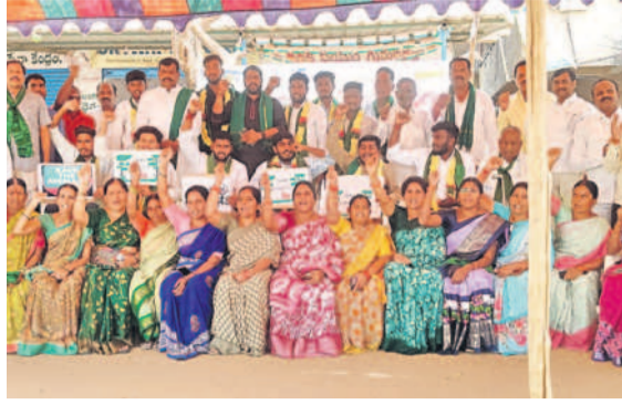
కొత్తపల్లి రిలే నిరాహార దీక్షలో పాల్గొన్న గ్రామస్థులు