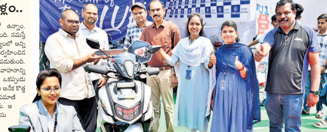
షోరూం నిర్వాహకుల నుంచి టైల్ అందుకుంటున్న వినయోగదారుడు