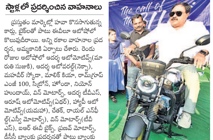
స్టాళ్లలో ప్రదర్శించిన వాహనాలు

5 వరంగల్, సోమవారం 10 మార్చి 2025 WARANGAL