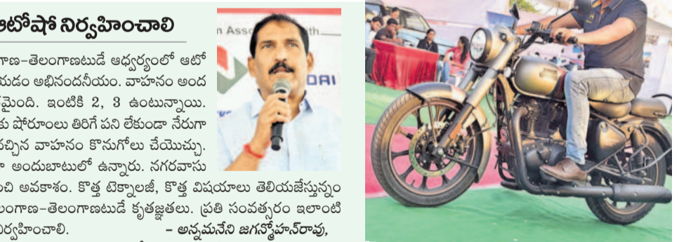
టెన్వైడ్ చేస్తున్న కంపెనీ ప్రతినిధి