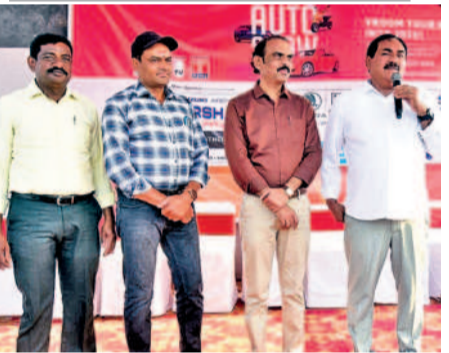
మాట్లాడుతున్న మాజీ మంత్రి ఎర్రబెల్లి