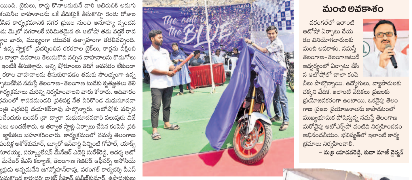
యమహా టైల్ సొంతమైన సంబురంలో పంజీకృష్ణ