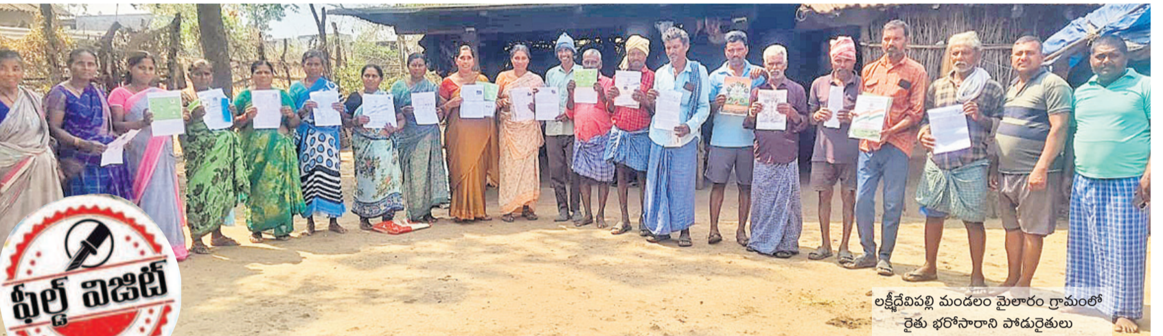
లక్ష్మీదేవిపల్లి మండలం మైలారం గ్రామంలో రైతు భరోసాని సాధారణ రైతులు