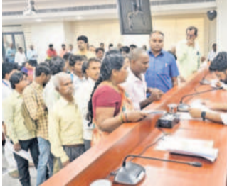
విజ్ఞప్తులు స్వీకరిస్తున్న కలెక్టర్ జితేష్ వి పాటిల్

ప్రజావాణిలో భద్రాద్రి కలెక్టర్ జితేష్ వి పాటిల్