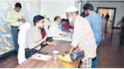
అభిల్య స్వీకరిస్తున్న కమిషనర్ అభిషేక్ అగస్త్య

ఖమ్మం, మార్చి 10: ప్రజావాణి కార్యక్రమంలో ప్రజలు ఇచ్చిన దరఖాస్తులకు అదే రోజు పరిష్కారం చూపాలని మున్సిపల్ అధికారులను కమిషనర్ అభిషేక్ అగస్త్య ఆదేశించారు. ఖమ్మం నగర పాలక సంస్థ కార్యాలయంలో ఆయన సోమవారం ప్రజావాణి కార్యక్రమంలో ప్రజల నుంచి దరఖాస్తులను స్వీకరించారు. అధికారులతో మాట్లాడుతూ.. దరఖాస్తులను వెనెంటినే (అదే రోజు) పరిష్కారమయ్యేలా చూడాలని ఆదేశించారు. ఒక సారి వచ్చిన దరఖాస్తుదారు.. మళ్ళీ రాకుండా అదే రోజు పరిష్కారమయ్యేలా చూడాలన్నారు. ఎల్ఆర్ఎస్ మరో రెండు కౌంటర్లు ఖమ్మం మున్సిపల్ కార్యాలయానికి ఎల్ఆర్ఎస్ దరఖాస్తుదారులు పెద్ద సంఖ్యలో వస్తున్నందున,