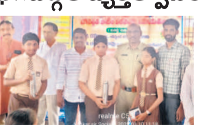
విద్యార్థులను అభినందిస్తున్న కళాశాల యాజమాన్యం, విజేతలకు బహుమతులు అందజేస్తున్న అతిథులు