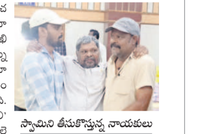
స్వామిని తీసుకోవచ్చు నాయకులు

కలెక్టరేట్, మార్చి 10 : 'నా ఆరోగ్యం సహకరించకపోవడంతో మెడికల్ అసిస్టెంట్ అయ్యాను. నా ఉద్యోగం నా కొడుకు ఇవ్వాలని అధికారులకు లిఖిత పూర్వకంగా తెలిపా. వైద్యశాల నివేదికతో సన్ను ఉద్యోగంలో నుంచి తొలగించారు. నా కొడుకుకు మాత్రం ఉద్యోగం ఇవ్వలేదు. ఎనిమిది నెలలుగా వేతనం రాక, నా కుటుంబం పన్నులందీ పరిస్థితి నెలకొన్నది. కలెక్టర్ మ్యా.. మీరే నాకుటుంబాన్ని ఆదుకోవాలి' అంటూ దివ్యాంగుడైన మెడికల్ అసిస్టెంట్ ఉద్యోగి కలిగి ఎదుట కన్నీటి పర్యంవేస్తున్నాడు. వివరాల కోసం కలెక్టర్ కేంద్రంలోని జిడ్పీ కార్యాలయంలో రిపోర్ట్ అప్లోడ్ చేసి స్టాండ్ గా ఆయనకు ఆరోగ్యం సహకరించకపోవడంతో వైద్యులు ఆయనను ఉద్యోగానికి అనుమతి నిర్ధారించారు. దీంతో, అధికారులు స్వామిని ఉద్యోగ బాధ్యతల నుంచి వదలిపెట్టారు. గత డావి ఆగస్టు నుంచి వేతనం కూడా నిలిపేశారు. అయితే, తన స్థానంలో తన కుమారుడికి ఉద్యోగం ఇవ్వాలంటూ స్వామి ఉన్నతాధికారులకు దరఖాస్తు చేశాడు. ఉన్నతాధికారులు అవార్డు కోసం దానిని పంపగా, ఇప్పటివరకు వెండిగోల్డోనే ఉన్నది. పలుసార్లు కలెక్టర్ కు కలిసి నివేదించినా, తన కుమారుడికి ఉద్యోగం కల్పించకపోవడంతో మరోసారి కలెక్టర్ కు కలిసి నివేదించేందుకు కలెక్టరేట్ ఆడిటోరియంలో జరుగుతున్న ప్రజావాణికి సోమవారం దివ్యాంగు గల హక్కుల పోరాట సమితి జిల్లా శాఖ ప్రతినిధులతో కలిసి వచ్చారు. కలెక్టర్ కు కలిసి, కుమారుడికి ఉద్యోగావకాశం కల్పించేందుకు అవసరమైన ఏర్పాట్లు చేయాలంటూ సంబంధిత అధికారులను ఆడిటోరియంలో విహాన్ పేపర్ జిల్లా అధ్యక్షుడు జక్కం సంపత్, దివ్యాంగ ఉద్యోగుల సంఘం జిల్లా ప్రధాన కార్యదర్శి విన్నం శ్రీనివాస్ తెలిపారు.