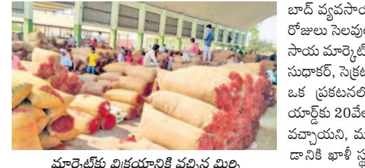
మార్కెట్ కు విక్రయానికి వచ్చిన మిర్చి

10వేల బస్తాలు రాక.. సందర్శించిన సీల కేసముద్రం, మార్చి 10: మూడు రోజుల సెలవుల తర్వాత సోమవారం మార్కెట్ ప్రారంభమైంది. 10వేల బస్తాల మిర్చి విక్రయానికి వచ్చింది. ఉదయం 8 గంటల్లోనే మార్కెట్ కు విక్రయానికి తీసుకువచ్చిన సుమారు 6వేల బస్తాల మిర్చి ఈ-నామ్ విధానం ద్వారా బిందర్ నిర్వహించి కాంటాలు నిర్వహించారు.