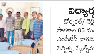
జోర్జ్ పల్లె: ముల్లపల్లి జిల్లా పాఠశాలలో