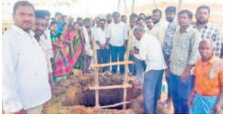
భూమి పూజ చేస్తున్న యాదవులు