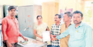
వినతిపత్రం అందిస్తున్న తెలంగాణ ప్రగతిశీల గ్రామపంచాయతీ చర్చర్చి యూనియన్