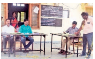
వేలం నిర్వహిస్తున్న ఎంపీడీవో యాకయ్య