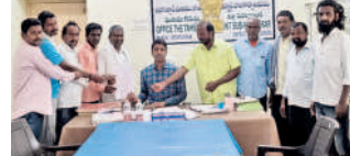
తనసీలార్ కు వినతిపత్రం అందిస్తున్న రైతులు