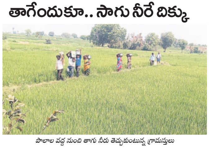
పొలాల వద్ద నుంచి తాగు నీరు తెచ్చుకుంటున్న గ్రామస్థులు

గంటిరావుపేట, మార్చి 11: రాజన్న సిరిసిల్ల జిల్లా గంటిరావుపేట మండలంలోని రాజేశ్వరరావునగర్ గ్రామస్థులు తాగు నీటి కోసం వారం రోజులగా తండ్రాడుతున్నారు. గ్రామ పంచాయతీకి చెందిన నాలుగు బోర్లతో పాటు మంచినీటి బావిలో భూగర్భ జలాలు పూర్తిగా అడుగంటి పోవడంతో వ్యవసాయ బావుల నుంచి బిందెలలో తెచ్చుకుంటూ కాలం వెల్లడిస్తున్నారు. ఈ గ్రామంలో 180 కుటుంబాలు ఉండగా 728 జనాభా ఉన్నది. మిషన్ భగీరథ ద్వారా ప్రతి రోజు 60 వేల లీటర్ల తాగు నీరు అందించాల్సి ఉండగా, ప్రస్తుతం మామూలు రోజులకు ఒక్కసారి మాత్రం వంతు 20 వేల లీటర్ల తాగు నీరు మాత్రమే అందిస్తున్నారు. అటు పంచాయతీ బోర్డు ఎండ్ పోయి, ఇటు మిషన్ భగీరథ నీరు సరిపడా రాకపోవడంతో దూరంలో ఉన్న వ్యవసాయ బావుల వద్దకు నడుచుకుంటూ వెళ్లి బిందెలతో తెచ్చుకుంటున్నారు. దీంతో మిగతా వసులు చేసుకోలేకపోతున్నామని అందోళన చెందుతున్నారు.