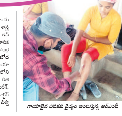
గాయాలైన బిడిమకు వైద్యం అందిస్తున్న అర్ఎంపీ