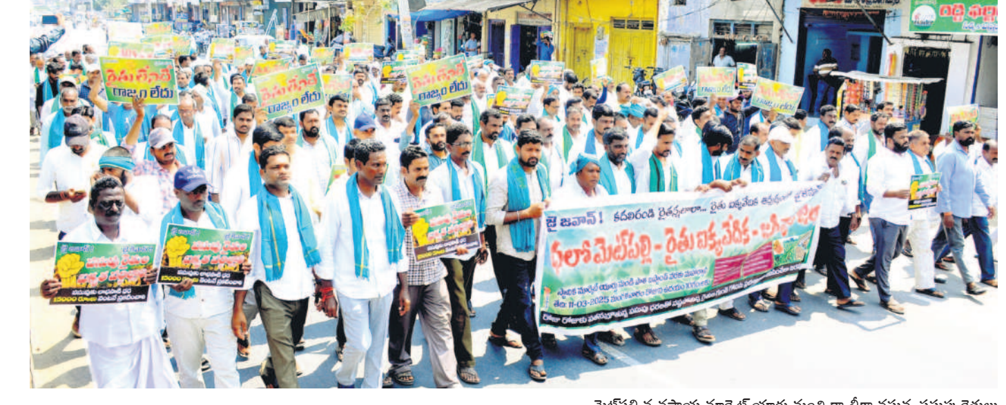
మేడిపల్లి వ్యవసాయ మార్కెట్ యార్డు నుంచి ర్యాలీగా వస్తున్న పసుపు రైతులు