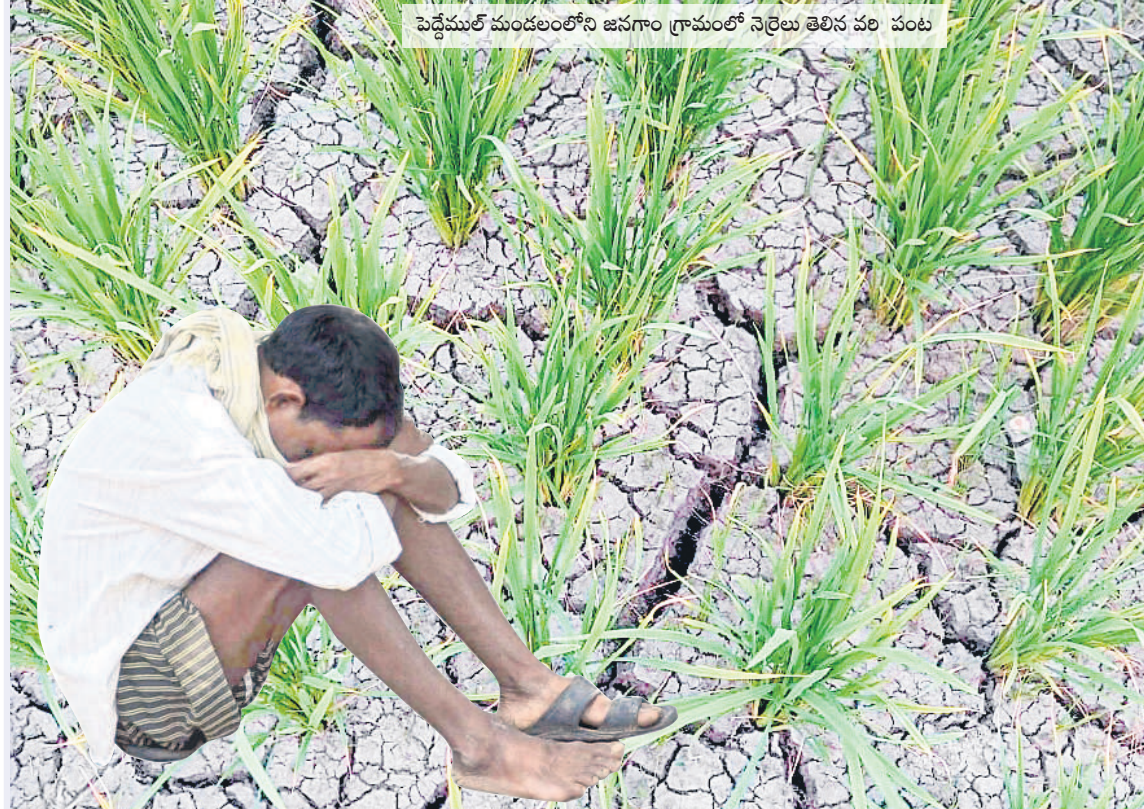
పెద్దేముల్ మండలంలోని జనగాం గ్రామంలో నెల్రలు తెలిసిన వరి పంట

గతంలో ఎన్నడూలేని విధంగా వికారాబాద్ జిల్లాలో భూగర్భజలాలు తగ్గడంతో భూములు నెల్రలు తేలి ఎండుముఖం పట్టాయి. అప్పులు తెచ్చి సాగు చేసిన పంట ఎండుతుండడంతో అన్నదాత పుట్టేడు దుఃఖంలో ఉన్నాడు. జిల్లాలో ఇప్పటివరకు దాదాపుగా 5,000 ఎకరాల వరకు వరి ఎండుముఖం పట్టినట్లు అధికారులు అంచనా వేస్తున్నారు. అత్యధికంగా కులకచర్ల, దొల్తాబాద్, బొంరాన్ పేట మండలాల్లో ఉన్నట్లు పేర్కొంటున్నారు. ఎండిన పంటను అన్నదాతలు మేతకు వదిలేస్తున్నారు. ప్రభుత్వం స్పందించి తమను ఆదుకోవాలని కోరుతున్నారు.