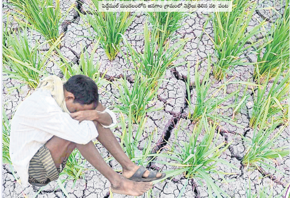
పెద్దెముల్ మండలంలోని జనగాం గ్రామంలో నెల్రలు తెలిసిన పంట పంట