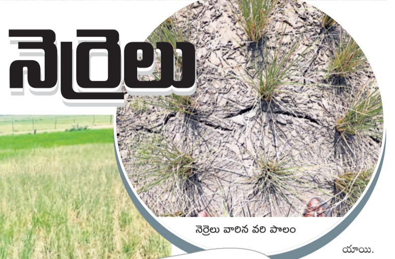
నెర్రెలు వారిని వరి పాలెం

యాసంగికి ముందు ప్రాజెక్టులో సమ్మట్టిగా సాగునీళ్లు వాటిపై భరోసాతో 120 ఎకరాల్లో వరి పంట వేసిన రైతులు తరువాత తూము నుంచి వృధాగా పోయిన జలాలు దీంతో అందులోని 80 ఎకరాల మేర నెర్రెలు వారిని పాలాలు మరమ్మతుల కోసం ముందడుగు వేయని కాంగ్రెస్ ప్రభుత్వం గత సర్కారులో 'సీతారామ' తో అనుసంధానానికి ప్రాధాన్యం ప్రస్తుత ప్రభుత్వంలో గోదావరి జలాలును తెచ్చేందుకు విముఖత లింకే కెనాళ్ల ద్వారా పారుగు జిల్లాలకు తరలింపున కోసముఖత