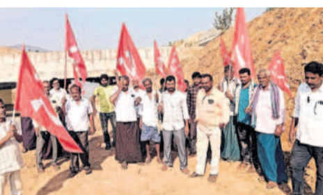
సీతారామ కాల్య వద్ద నిరసన తెలుపుతున్న సీపీఎం నాయకులు