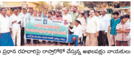
బచ్చోడు ప్రధాన రహదారిపై రాష్ట్రారోకో చేస్తున్న అఖిలపక్షం నాయకులు

తిరుమలరావుపాలెం, మార్చి 12 : ఎన్నికలకు ముందు ఇచ్చిన హామీ మేరకు మంత్రి పాంగులేటి శ్రీనివాసరెడ్డి బచ్చోడు కేంద్రంగా కొత్త మండలాన్ని ఏర్పాటు చేయాలని డిమాండ్ చేస్తూ బచ్చోడు సెంటర్లో అఖిలపక్షం ఆధ్వర్యంలో ప్రజలు బుధవారం గంట పాటు రాష్ట్రారోకో నిర్వహించారు. ఈ సందర్భంగా అఖిలపక్షం నాయకులు పలువురు మాట్లాడుతూ ఎన్నికల సమయంలో భట్టి విక్రమార్కు, పాంగులేటి శ్రీనివాసరెడ్డి కాంగ్రెస్ అధికారంలోకి వచ్చిన అరు నెలల్లోనే బచ్చోడు కేంద్రంగా కొత్త మండలాన్ని ఏర్పాటు చేస్తామని హామీ ఇచ్చారని గుర్తు చేశారు. రాష్ట్రంలో కొత్త మండలాన్ని, రెవెన్యూ డివిజన్లను ఏర్పాటు చేస్తున్న ప్రభుత్వం బచ్చోడు కేంద్రంగా కొత్త మండలాన్ని ఎందుకు ఏర్పాటు చేయడం లేదని ప్రశ్నించారు. దీనిపై ఆందోళనలు చేస్తున్నా