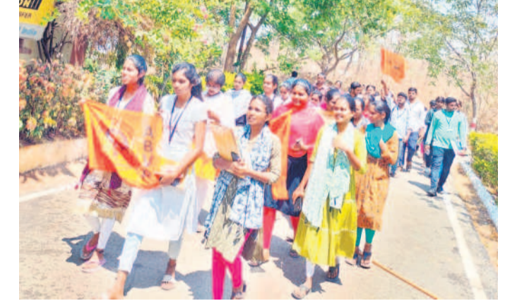
వర్షిలో పేరు మార్చేవద్దని టీఎంసీలో విద్యార్థులు రాల్చి నిర్యహిస్తున్న విద్యార్థులు

డివీషన్ల మార్చి 12: తెలంగాణ యూనివర్సిటీ వారి అయిన వైఎస్ రాజశేఖరరెడ్డి తెలంగాణ పేరును మార్చునున్నారనే ప్రచారం ఉమ్మడి జిల్లాలో తీవ్ర చర్చనీయాంశమైంది. మన ఆత్మగౌరవానికి, అస్తిత్వానికి ప్రతిక అయిన 'తెలంగాణ'ను మార్చాలన్న ప్రతిపాదనలపై సంస్కృతా ఆగ్రహం వ్యక్తమవుతున్నది. ఇప్పటికే విద్యార్థి లోకం భగ్గుమంటున్నది. విద్యార్థి సంఘాలు అందోళన బాట పట్టాయి. రెండో జూలూ యూనివర్సిటీలో నిరసనలు, ధర్నాలు చేపట్టాయి. టీఆర్ఎస్, ఏపీ, ఎస్ఎఫ్ఐ, పీడీఎంసూ, బీసీ విద్యార్థి సంఘం పోరాటాలకు సిద్ధమవుతున్నాయి. ఈశ్వరీబాయి యూనివర్సిటీగా మార్చాలన్న ప్రతిపాదనలు వెంటనే వెనక్కి తీసుకోవాలని, లేక విద్యార్థి సంఘం లేవనెత్తిన ఇప్పటికే హెచ్చరికలు జారీ చేశారు.