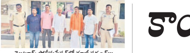
వెల్లూరు: పోలీసుస్టేషన్లో మాజీ సర్దంబలు

మాజీ సర్దంబలుపై నిర్బంధకాండ నమస్తే నెట్వర్క్, మార్చి 12: మాజీ సర్దంబలను ప్రభుత్వం నిర్బంధించింది. బుద్ధవారం వేకువజామునే పోలీసులతో ఆరెస్ట్ చేయించింది. గతంలో గ్రామాల అభివృద్ధి కోసం చేసిన పనులకు సలబంధించి పెండింగ్ బిల్లులు చెల్లించాలని కోస్తా నెలకాల మాజీ సర్దంబలు పోరాటం చేస్తున్నారు. నిరసనలు, ఆందోళనలు చేపడుతున్నా సర్కారు సృష్టించిన పరిస్థితులతో ఆసెంట్ల ముట్టడించి తన ఆవేదన తెలియజేయాలని భావించారు. అయితే బుద్ధవారం నుంచి ఆసెంట్ల సమావేశాలు మొదలైన నేపథ్యంలో కరీంనగర్ ఉమ్మడి జిల్లాలోని మాజీ సర్దంబలను ముందస్తుగా పోలీసులు ఆరెస్ట్ చేశారు. స్థానిక తాణాలకు తరలించారు. కాగా, మాజీ సర్దంబలు మాట్లాడుతూ ఓ వైపు ప్రజా పాలనగా అందిస్తున్నామని చెబుతున్న ప్రభుత్వం, మరోవైపు మాజీ సర్దంబలను అక్రమంగా ఆరెస్ట్ చేయడం విడ్డూరంగా ఉందన్నారు. ఇప్పటికైనా తమకు రావాల్సిన పెండింగ్ బిల్లులను వెంటనే చెల్లించాలని డిమాండ్ చేశారు.