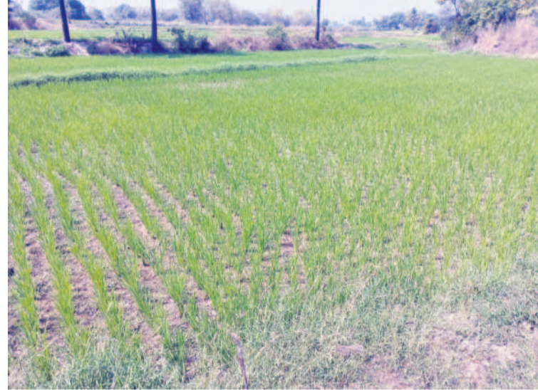
గంగాధర మండలం వెంకంపల్లిలో నీరు లేక నిలబెట్టిన బావిని పాలం

పదానివర కిందటి వరకు పుష్పలమైన నీళ్లు కనిపించిన కరీంనగర్ ఉమ్మడి జిల్లాను ఇప్పుడు కరువు పరిస్థితులు వెంటాడుతున్నాయి. ప్రాజెక్టుల్లో నీళ్లున్నా ప్రభుత్వ ప్రణాళికా లోపంతో సాగునీటికి ఇబ్బందులు తలెత్తుతున్నాయి. భూగర్భజలాలను రోజురోజుకూ గణనీయంగా తగ్గి తుండగా, కాలువల్లో నీరు రాక రైతులు బోర్డు, బావుల బాట పడుతున్నారు. అప్పులు తెచ్చి మరీ తవ్విస్తున్నారు. అయినా పెద్దగా ప్రయోజనం లేక పంటలను కాపాడుకునేందుకు తండ్లాడుతున్నారు. ప్రభుత్వ వైఫల్యం వల్లే తమకీ దుస్థితి వచ్చిందని వాపోతున్నారు.