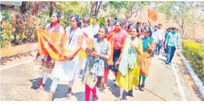
వర్షిలో పేరు మార్చడంపై టీయాలో ఏబీవీటీ అధ్యక్షులలో ర్యాలీ నిర్వహిస్తున్న విద్యార్థులు

డివైల్లి, మార్చి 12: తెలంగాణ యూనివర్సిటీ తెలంగాణ పేరును మార్చుతున్నారనే ప్రచారం ఉమ్మడి జిల్లాలో తీవ్ర చర్చనీయాంశమైంది. మన ఆత్మగౌరవానికి, అస్తిత్వానికి ప్రతికూలమైన 'తెలంగాణ'ను మార్చాలన్న ప్రతిపాదనలపై సర్కారు ఇప్పుడు 'తెలంగాణ' అస్తిత్వమే సర్వత్రా ఆగ్రహం వ్యక్తమవుతున్నది. ఇప్పటికే విద్యార్థి లోకం భగ్గుమంటున్నది. విద్యార్థి సంఘాలు అందోళన బాట పట్టాయి. రెండ్రా జిల్లా యూనివర్సిటీలో నిరసనలు, ధర్నాలు చేపట్టాయి. బీఆర్ఎస్, ఏబీవీటీ, ఎస్ఎఫ్ఐ, పీడీఎన్యూ, టీసీ విద్యార్థి సంఘం పోరాటాలకు సిద్ధమవుతున్నాయి. ఈశ్వరీ బాయి యూనివర్సిటీగా మార్చాలన్న ప్రతిపాదనలు వెంటనే వెనక్కి తీసుకోవాలని, లేక తక్షణమే తిరిగిపట్టాలని విద్యార్థులు డిమాండ్ చేస్తున్నారు. అయితే ఏదైనా ముందుగా దానిని తీసుకోవాలని, లేక తక్షణమే తిరిగిపట్టాలని విద్యార్థులు డిమాండ్ చేస్తున్నారు. అలా 2006లో నిజామాబాద్ గడ్డ మీద తెలంగాణ యూనివర్సిటీ పురుష పోస్ట్ ఉద్యమం లేదనిపామని ఇప్పటికే హెచ్చరికలు జారీ చేశాయి. పేరు మార్చేందుకు? యూనివర్సిటీ కోసం ఉమ్మడి నిజామాబాద్ జిల్లాలో గతంలో అనేక పోరాటాలు జరిగాయి. వర్షిలో సాధన పోరులో అనేక మంది విద్యార్థులు నేతలు జైలుకు వెళ్లారు. లాఠీచెట్టలు తిన్నాయి. అయినప్పటికీ ఎక్కడా వెనక్కి తగ్గలేదు. దీంతో దిగివచ్చిన అప్పటి కాంగ్రెస్ ప్రభుత్వం వర్షిలో ఏర్పాటుకు ముందుగా దానిని తీసుకోవాలని, లేక తక్షణమే తిరిగిపట్టాలని విద్యార్థులు డిమాండ్ చేస్తున్నారు. అయితే ఏదైనా ముందుగా దానిని తీసుకోవాలని, లేక తక్షణమే తిరిగిపట్టాలని విద్యార్థులు డిమాండ్ చేస్తున్నారు.