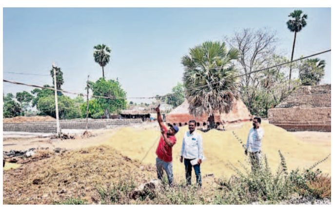
ఇటుక బట్టలలో విద్యుత్ వైర్లను తొలగిస్తున్న విద్యుత్ సిబ్బంది