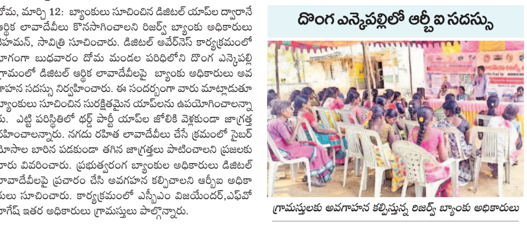
దొంగ ఎన్ఫోర్స్ లో ఆర్థిక సదస్సు