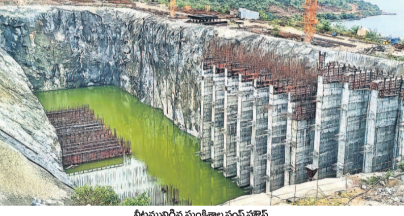
నీటిమందిగిన సుంకిశాల వంట్ వూర్