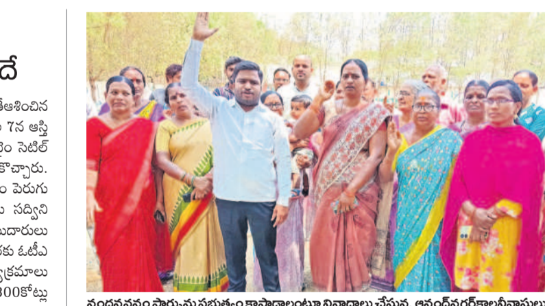
నందనవనం పార్కును ప్రభుత్వం కాపాడాలంటూ నివాసాలు చేస్తున్న ఆనంద్ నగర్ కాలనీవాసులు