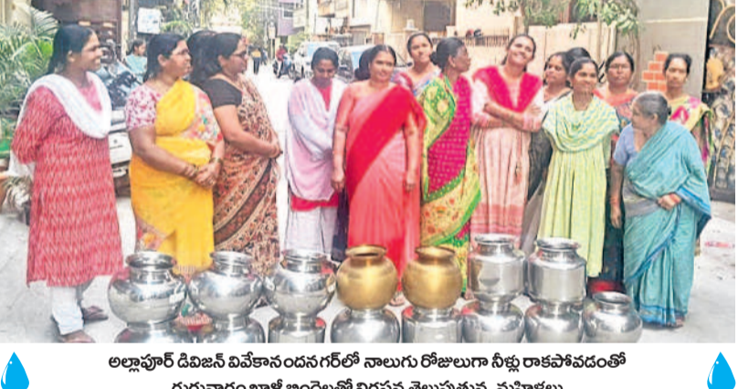
అల్లాపూర్ డివిజన్ వివేకానందనగర్లో నాలుగు రోజులూగా నీళ్లు రాకపోవడంతో గురువారం ఖాళీ బిందెలతో నిరసన తెలుపుతున్న మహిళలు