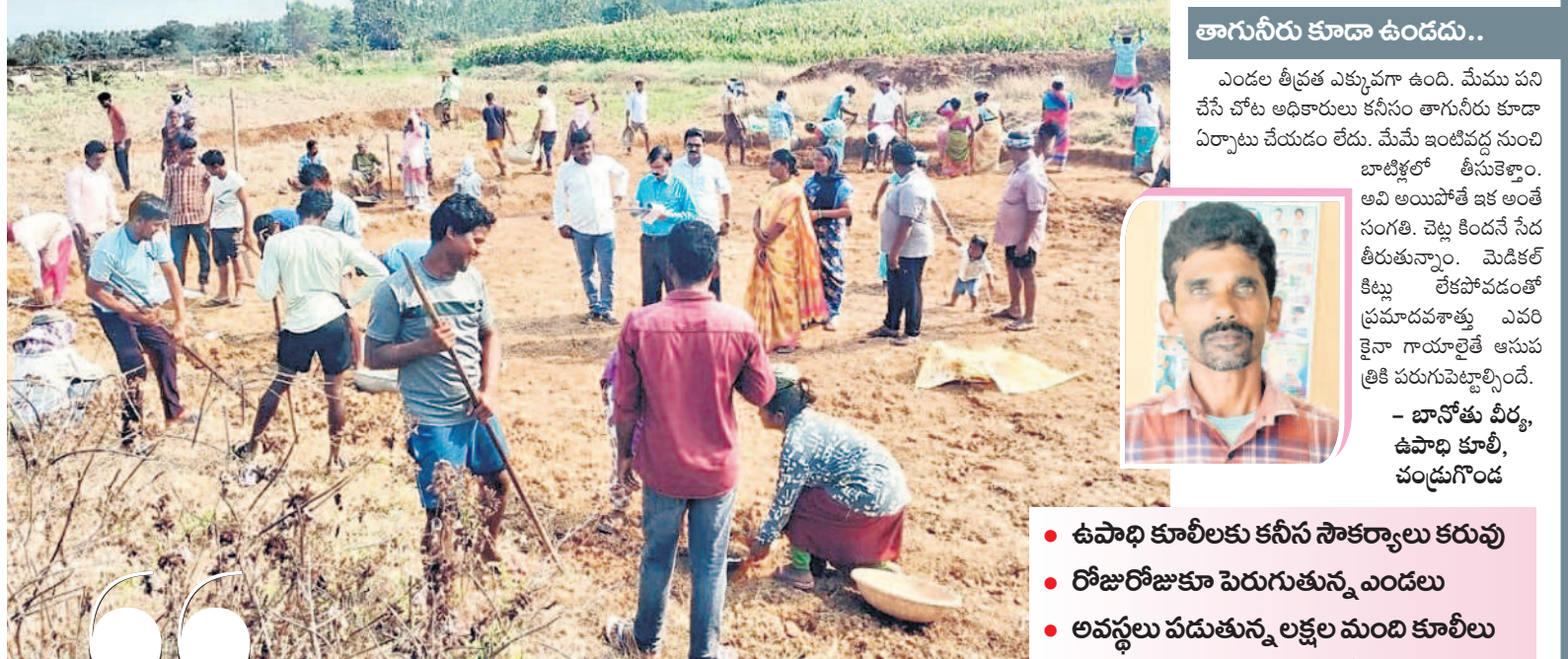
ఎండలోనే ఉపాధి పనులు చేస్తున్న కూలీలు

అన్నీ ఉన్నా అల్లుడు నోట్లో శని అన్నట్లు ఉంది ఖమ్మం జిల్లా రూరల్ మండలంలోని మద్దులపల్లి వ్యవసాయ మార్కెట్ తీరు. జిల్లాలో ఎనిమిదో మార్కెట్గా మద్దులపల్లి వ్యవసాయ మార్కెట్ ఆరేళ్ల క్రితం ఏర్పడింది. ఖమ్మం వ్యవసాయ మార్కెట్ నుంచి 2018లో విడిపోయింది. ఈ మార్కెట్ పరిధిలో ఖమ్మం రూరల్, తిరుమలూరుపాలెం, కూసుమంచి మండలంలోని కొన్ని గ్రామాలకు కలిపి మొత్తం 44 గ్రామాల సరుకాదులో నాటి మార్కెటింగ్ శాఖ అధికారులు పోస్టింగ్ చేశారు. మరుసటి ఏడాది 2019 నుంచి ఆదాయ లాభాలను సైతం నిర్దేశించారు. ఒకే ఒక చెక్కింపు మల్ సాగు జిల్లాలోని మిల్లులు, రైస్ మిల్లులపైనే ఆదాయం దీని మద్దులపల్లి మార్కెట్ కమిటీ నిబంధించి నాటినుంచి నేటి వరకు తమవంతుగా ఆదాయం రాష్ట్ర మార్కెటింగ్ శాఖ నిర్దేశించిన దానికంటే అధికంగానే ఆదాయం సమకూరుతున్నాయి. దీంతో గత కేసీఆర్ సర్కార్ కొత్త మార్కెట్ నిర్మాణానికి గ్రీన్ సిగ్నల్ ఇస్తూ రూ.19 కోట్ల నిధులను మంజూరు చేసింది. మార్కెట్ నిర్మాణ పనులు కొనసాగుతున్న తరు