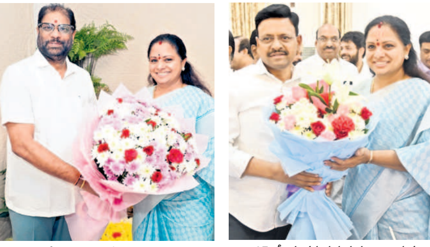
ఎమ్మెల్యే కవితకు షాకే అందించి పుట్టినరోజు శుభాకాంక్షలు తెలుపుతున్న ఎంపీ వద్దిరాజు

ఖమ్మం, మార్చి 13: ఎమ్మెల్యే, తెలంగాణ జాగృతి అధ్యక్షురాలు కవితకు షాకే అందించి పుట్టినరోజు శుభాకాంక్షలు తెలుపుతున్న ఎంపీ వద్దిరాజు. తాతా మధు, కేకే కట్ చేసిన మాజీ ఎమ్మెల్యే వనమా, ఉమ్మడి జిల్లాలో ఉత్సవాలు.