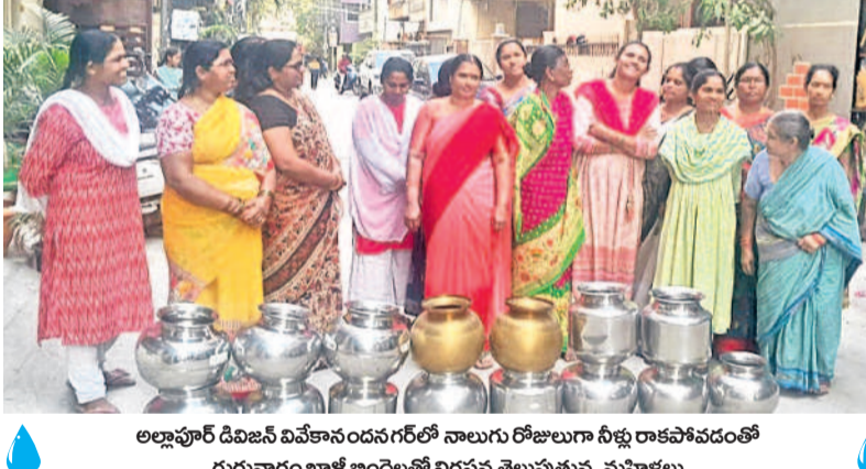
అల్లాపూర్ డివిజన్ వివేకానందనగర్లో నాలుగు రోజులుగా నీళ్లు రాకపోవడంతో గురువారం ఖాళీ బిందెలతో నిరసన తెలుపుతున్న మహిళలు