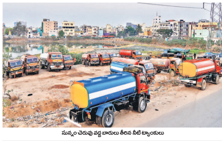
సున్నం చెరువు వద్ద బారులు తీలిన నీటి ట్యాంకులు