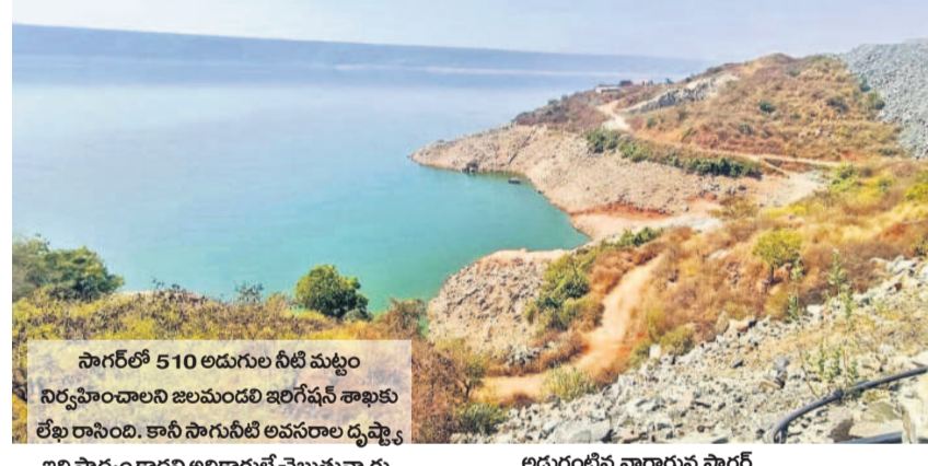
సాగర్లో 510 అడుగుల నీటి మట్టం నిర్వహించాలని జలమండలి ఇంగ్లీషన్ శాఖకు లేఖ రాసింది. కానీ సాగునీటి అవసరాల దృష్ట్యా ఇది సాధ్యం కాదని అధికారులే చెబుతున్నారు. అడుగుంటిన నాగార్జున సాగర్

సాగర్లో డెడ్ స్టోర్లే ఉన్న హైదరాబాద్ తాగునీటికి ఇబ్బంది లేకుండా ఉండేందుకు కేసీఆర్ ప్రభుత్వం సుంకిశాల పథకాన్ని చేపట్టింది. కాంగ్రెస్ ప్రభుత్వం ఏర్పడే నాటికి 80 శాతానికి పైగా పనులు పూర్తయినా సర్కారు పర్యవేక్షణలోపంత్ వేగంగా పనులు జరగలేదు. ఈలోగా జలమండలి ఇంజనీర్ల ఫౌర వైఫల్యంతో మేఘా ఇంజనీ రింగ్ కంపెనీ ఇష్టానుసారంగా వ్యవహరించి తప్పుడు అంచనాలతో సాగర్ను తెరిచి పంపువనాసలోని రిటెయినింగ్ వాల్, గేట్లను కుప్పకూల్చింది. దీంతో అయ్యింది. సుంకిశాల సుంకిశాల పనులు నిలిచిపోయాయి. వాస్తవ వాని ఇప్పటికే పనులు పూర్తయితే ఇలాంటి అత్యవసర సమయంలో కోట్లాది రూపాయల ప్రజాధనం ఆదా అయ్యింది. సుంకిశాల నిర్వాహణ మూలన జలమండలి ఇప్పుడు రూ. 4.68 కోట్లతో ఎమర్జెన్సీ మోటార్లను ఏర్పాటు చేసుకోవాలి వస్తున్నది.