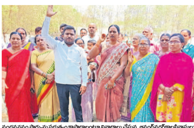
నందనవనం పార్కును ప్రభుత్వం కాపాడాలంటూ నివాసాలు చేస్తున్న ఆసంద్ నగరకాలనీవాసులు

వారిపై స్పెషల్ డ్రైవ్ చేపడుతున్నారు. అయితే ఆశించిన స్థాయిలో వసూళ్లు రాకపోవడంతో ఈ నెల 7న ఆస్తి పన్ను బకాయిదారులకు ఓటీఎస్ (పన్ టైం సెటిల్ మెంట్) స్కీంను అందుబాటులోకి తీసుకొచ్చారు. ఓటీఎస్ ద్వారా రోజుకు ఆస్తిపన్నులో వేగం పెరుగుతుందని భావించారు. కానీ ఓటీఎస్ను సర్దుబాటు యోగం చేసుకునేందుకు పెద్దగా బకాయిదారులు ముందుకు రావడం లేదు. ఈ మేరకు ఓటీఎస్పై విస్తృత అవగాహన కార్యక్రమాలు చేపట్టాలని, కనీసం రూ. 300 కోట్ల ఓటీఎస్ వసూళ్లు వచ్చేలా చర్యలు తీసుకోవాలని డీసీలకు ఆదేశాలు జారీ చేశారు. రాష్ట్ర ప్రభుత్వాల బకాయిలపై దృష్టి సారించి సంబంధిత శాఖలను నోటిఫీషన్లు ఇవ్వనున్నారు. మొత్తంగా ప్రజా సమస్యలను పక్కన పెట్టి ఆస్తిపన్ను కలెక్షన్ల టార్గెట్ల అధికారులు పనిచేయనున్నారు.