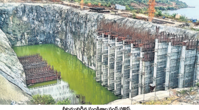
నీటిమునిగిన సుంకిశాల వంట్ వూస్