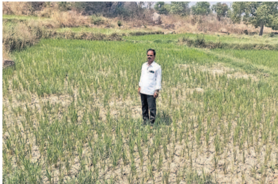
కొడంగల్: సాగునీరు అందక ఎండిపోయిన వరిపంట

చేస్తున్నారు. గతంలో చెరువులు కుంటలో నీటి నిల్వలు పుష్కలంగా ఉండటంతో భూగర్భ జలాలు నిండగానే బోరు బావుల్లో నీటి కళ ఏర్పడి ఉండేది. సంవత్సరం పొడవునా మూడు పంటలు పండించుకున్న నీటికి ఎటువంటి లోటు ఉండేది కాదు. కానీ ఈ సారి వేసవి ప్రారంభంలోనే నీటి ఎద్దడిని ఎదుర్కోవాల్సి వస్తుందని రైతులను వాపోతున్నారు. కాంగ్రెస్ ప్రభుత్వం నుంచి పంట పెట్టుబడి రాక, వేసవి పంటలకు అప్పులు ఏర్పడినా ఇబ్బందులకు గురొతున్నట్లు రైతులు ఆందోళన చెందుతున్నారు. గతంలో కేసీఆర్ ప్రభుత్వ హయాంలో పంట పెట్టుబడికి రైతులందరూ వచ్చేదని, డాంట్ పంట నష్టంపై అంతగా బాధ పడే పరిస్థితి ఉండేది కాదని తెలుపుతున్నారు. కానీ ఆ కాలంలో పంట నష్టం కాకుండా అతి చివరకే మేరకు పంటను పండించుకొని గిట్టబాటు దరత పంటలను ప్రభుత్వం తప్పిస్తోంది అని దీనివల్ల బతికే అలంకా పేర్కొంటున్నారు. రైతులను రక్షించే కేసీఆర్ అందక ఎంపీ ప్రస్తుతం అర్థం అవుతుందని, కేసీఆర్ అందించిన రైతులకు సంక్షేమం అంతా ఇంతా కాదని రైతులు కొనియాడుతున్నారు.