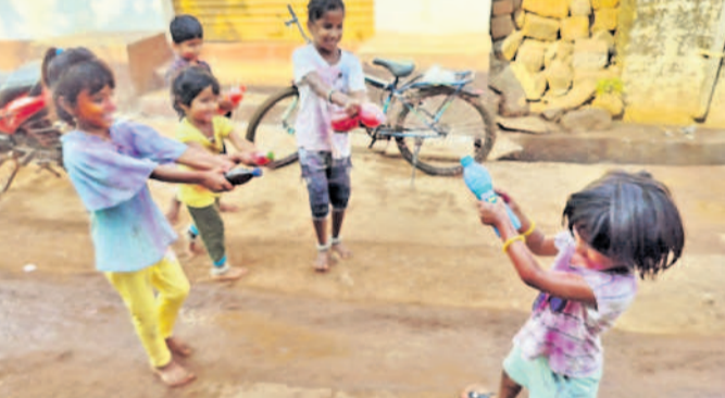
బంటూరు: కుంభావరంలో హాళి సంబురాలలో చిన్నారులు