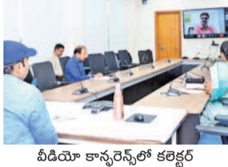
వీడియో కాన్ఫరెన్స్ లో కలెక్టర్