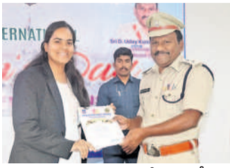
ప్రశంసా పత్రం అందజేస్తున్న ఎస్సీ

మెదక్, మార్చి 13: అంతర్జాతీయ మహిళా దినోత్సవం పురస్కరించుకుని జిల్లా పోలీస్ ప్రధాన కార్యాలయంలో ఎస్సీ అధ్యక్షుర్యంలో జిల్లాలోని మహిళా పోలీస్ అధికారులు, సిబ్బందికి అంతర్జాతీయ మహిళా దినోత్సవ శుభాకాంక్షలు తెలిపారు. ఈ సందర్భంగా ఎస్సీ మాట్లాడుతూ... తల్లిదండ్రులు మన ఇంట్లో నుంచే మగ పిల్లలు, ఆడ పిల్లలను సమానంగా చూడాలన్నారు. మగ పిల్లలకు ఇచ్చే స్వేచ్ఛను ఆడపిల్లలకు ఇస్తూ మంచి విద్యను అందించాలన్నారు. విధి నిర్వహణలో ఉత్తమ ప్రతిభ కనబర్చిన మహిళలకు ప్రశంసా పత్రాలు అందజేశారు.