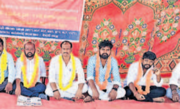
కలెక్టరేట్ వద్ద నిరాహార దీక్ష చేస్తున్న ఎమ్మెల్యేల నాయకులు

మెదక్, మార్చి 13 (నమస్తే తెలంగాణ): గతంలో పశ్చిమ బెంగాల్ గ్రామీణులకు ఏర్పాటు చేసిన పశ్చిమ బెంగాల్ రేషన్ పథకం నిరాయకాలు చేపట్టడంపై మెదక్ పార్లమెంట్ లోని నిరసన దీక్షలు ప్రారంభించారు. ఈ సందర్భంగా ఆయన మాట్లాడుతూ కాంగ్రెస్ ప్రభుత్వం మాదిగలకు అన్యాయం చేస్తున్నదని, ఇప్పటికే కట్టుబడి ఉండాలన్నారు. రేషన్ కార్డులు పోషించిన వారిని మూల్యం చెల్లించక తప్పదని హెచ్చరించారు.