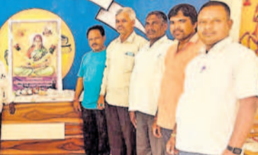
నర్సాపూర్: మొలకలకు తొలి కవయిత్రి నివాళులర్పిస్తున్న కుమ్మరి సంఘం నాయకులు