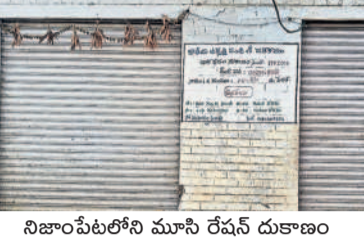
నిజాంపేటలోని మూసీ రేషన్ దుకాణం

నిజాంపేట, మార్చి 13: నెల మొదటి 12 రోజుల్లోనే రేషన్ పథకం రేషన్ దుకాణాలకు బియ్యం సరఫరా కాక పోవడంతో పేదల ఆందోళన చెందుతున్నారు. నిజాంపేట మండలంలో 14 గ్రామ పంచాయతీలు ఉన్నాయి. జనాభా ప్రాతిపదికన 18 రేషన్ దుకాణాలు ఉన్నాయి. మార్చి ప్రారంభమై 12 రోజులు గడిచినా మండల వ్యాప్తంగా ఉన్న రేషన్ దుకాణాలకు బియ్యం సరఫరా కావడం లేదు. అతడికి నివాళులర్పించారు. ఆయన వెంట మాజీ ఎంపీ జంగం శ్రీనివాస్, నాయకులు మాజీ రెడ్డి, సుభాష్, వెల్గే నివాళులర్పించారు. బాధితులకు తుకారా, రాములు తదితరులున్నారు.