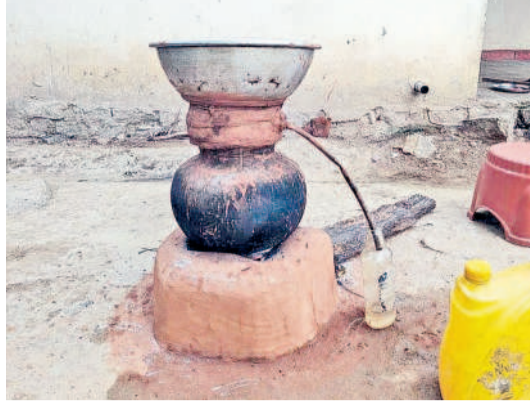
రాయపర్తి తండాలో తయారవుతున్న గుడుంబా

వర్తన్ ఏటా, మార్చి 13: ఎక్స్ ప్లజ్ అధికారులు మామూళ్లకు అలవాటు పడడంతో గ్రామంలో ఏర్పలవి డిగా బెల్లు షాపులు, గుడుంబా కేంద్రాల ద్వారా మద్యం న్యాయని ప్రజలు అంటున్నారు. నిరుపేద కుటుంబాలను విచ్చేస్తున్న బెల్లు షాపులు, గుడుంబా కేంద్రాలను కట్టడి చేయాల్సిన అధికారులే నిలవారీ పనులు పూర్తి చేయాలని ఆరోపణలు వినిపిస్తున్నాయి. దీంతో పైస షాపుల కంటే బెల్లు షాపుల్లో పెద్ద మొత్తంలో మద్యం విక్రయాలు జరుగుతున్నాయని ప్రజలు అంటున్నారు. ఒక్కో క్వార్టర్ మద్యం బాటిల్స్ బెల్లు షాపుల నిర్మాణాలు రూ. 20 అధికంగా మూల్యం చేస్తున్నారు. అలాగే, వర్తన్ ఏటా పట్టణ సమీపంలోని తండాలో పాటు రాయపర్తి మండలంలోని తండాలో జోరుగా గుడుంబా తయారు చేస్తున్నారు. అధికారులు మామూళ్లకు అలవాటు పడి ఉన్నారని వ్యవహారిస్తుండడంతో గుడుంబా ఏరులై పారుతున్నదని తండావాసులు వాపోతున్నారు. వర్తన్ ఏటా మండలంలోని ఐదు వైస్ ల నిర్మాణాలు బెల్లు