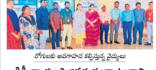
రోగిలకు అవగాహన కల్పిస్తున్న వైద్యులు