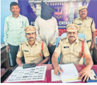
వివరాలు వెల్లడిస్తున్న పోలీసులు