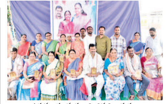
డిప్యూటీ కలెక్టరులను సన్మానించిన నిర్వాహకులు

మాత్రమే అందిస్తున్నట్లు తెలుస్తున్నది. కానీ, రాయపర్తి మండలంలో బెల్లు షాపులకు మద్యం దుకాణాదారులు నేరుగా అమ్ముతుండడంతో నెలకు రూ. 40 వేల వరకు షాపు వారిగా అధికారులకు మామూళ్ల ముట్టజెప్పుతున్నట్లు సమాచారం. వర్తన్ ఏటా మండలంలో తక్కువ మొత్తంలో రాబడి ఉండడంతో ఎక్స్ ప్లజ్ అధికారులే నేరుగా పనులు పూర్తి చేయాలని ఆరోపణలు వినిపిస్తున్నాయి. బెల్లు షాపుల నుంచి నెలవారీగా మూల్యం కోసం ఇద్దరు జవాబు ప్రత్యేకంగా పని చేస్తున్నారని ఆరోపణలు ఉన్నాయి. వాహన డ్రైవర్ లోపాలు మరో జవాబు నిలవారీగా బెల్లు షాపుల వద్దకు వెళ్లి ఒక్కో బెల్లు షాపు వద్ద రూ. 2 వేల వసూలు చేస్తున్నట్లు తెలిసింది. డబ్బులు ఇవ్వకుంటే మద్యం సీసాలు స్వాధీనం చేసుకుని కేసులు నమోదు చేస్తున్నారు. దీంతో ఎక్స్ ప్లజ్ అధికారులపై తీవ్ర స్థాయిలో విమర్శలు వస్తున్నాయి. ఉన్నతాధికారులను వివారణ జరపాలని ప్రజలు కోరుతున్నారు.