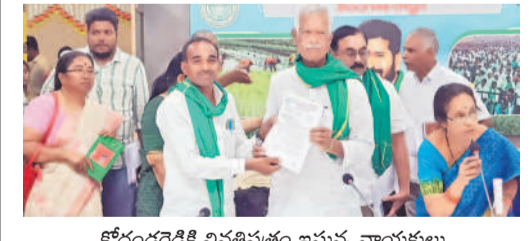
కోడండరెడ్డికి వినతిపత్రం ఇస్తున్న నాయకులు