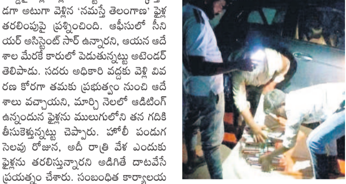
ములుగు పి అండ్ ఆకౌంట్స్ ఆఫీస్ నుంచి రాత్రి 8 గంటలకు పైళ్లను తరలిస్తున్న అధికార, మరో ఇద్దరు వ్యక్తులు

ములుగు, మార్చి 14 (నమస్తే తెలంగాణ): ప్రభుత్వ కార్యాలయం నుంచి గుట్టు చప్పుడు కాకుండా రాత్రి సమయంలో పైళ్లను తరలించిన ఘటన ములుగు జిల్లా కేంద్రంలోని పి అండ్ ఆకౌంట్స్ కార్యాలయంలో శుక్రవారం చోటుచేసుకున్నది. ములుగు పోలీస్ స్టేషన్ పక్కన ఉన్న జిల్లా సంక్షేమ శాఖ అధికారి కార్యాలయం కాంప్లెక్స్ లో ఉన్న పి అండ్ ఆకౌంట్స్ కార్యాలయం నుంచి అసిస్టెంట్ శుక్రవారం రాత్రి తన జిల్లా అధికారి సంక్షేమలో పైళ్లను తరలించి చార్జి ఉండగా అతనిదే సహాయంతో తరలింపడం పలు అనుమానాలకు తావిస్తున్నది.