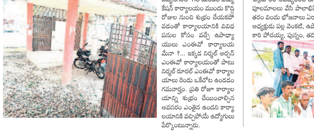
సోన్, మార్చి 14: నిర్వహణలోని దివ్యనగర్ లో గల మండల ఎదుగు కేషన్ కార్యాలయం ముందు కొద్ది రోజుల నుంచి శుభ్రం చేయకపోవడంతో కార్యాలయానికి వివిధ పనుల కోసం వచ్చే ఉపాధ్యాయులు ఎంతవో కార్యాలయమేనా?... ఇక్కడ నిర్వహణ అర్హత ఎంతవో కార్యాలయంతో పాటు నిర్వహణ ఎంతవో కార్యాలయాల రెండు ఒకే ఒక ఉండడం గమనార్హం. ప్రతి రోజు కార్యాలయాన్ని శుభ్రం చేయడానికైనా అవసరం ఎంతైనా ఉంది కార్యాలయానికి వచ్చినవారి ఉద్యోగులు వేర్పొందుతారు.