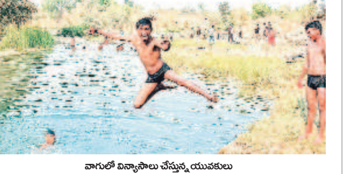
వాగులో విన్యాసాలు చేస్తున్న యువకులు

కెరమెల, మార్చి 14: మార్చిలోనే ఎండలు దంచి కొడుతున్నాయి.. ఈ నేపథ్యంలో హోటీ పండుగ వచ్చింది. కొందరు ఆటపాటల్లో.. మరకొందరు విందు, విసోదాల్లో నిమగ్నమయ్యారు. వీటన్నింటికీ దూరంగా ఉన్న యువకులు మాత్రం మండలపై ఎండల్లో వాగులాట పట్టారు. కెరమెలకి సమీపంలో ఉన్న వాగులో యువకులు నీటి విన్యాసాలు చేస్తుండగా 'నమస్తే' క్లికపివీడించింది.