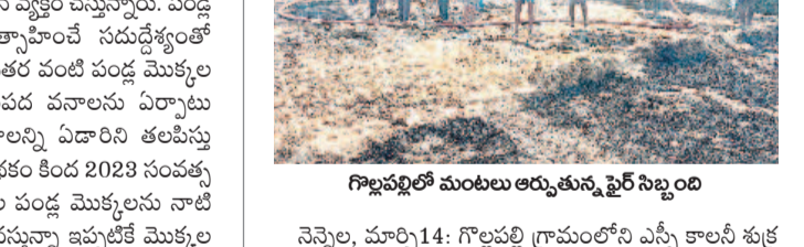
గొల్లపల్లిలో మంటలు ఆధ్వర్యంలో పైర సిద్ధం