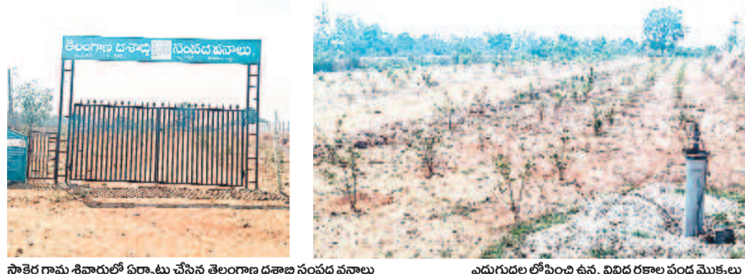
సాకెర గ్రామ శివారులో ఏర్పాటు చేసిన తెలంగాణ దశాబ్ది సంపద వనాలు ఎదుగుదల లోపించి ఉన్న విధగరకాల వండ్ల మొక్కలు