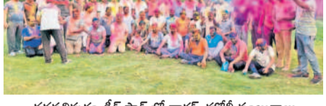
వస్తవలిపురం డీర్ పార్క్ లో వాకర్స్ హోలీ సంబురాలు