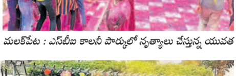
వస్తవలిపురం : బీఎన్ రెడ్డినగర్ డివిజన్ క్రిస్టల్ విల్లెజ్ లో..