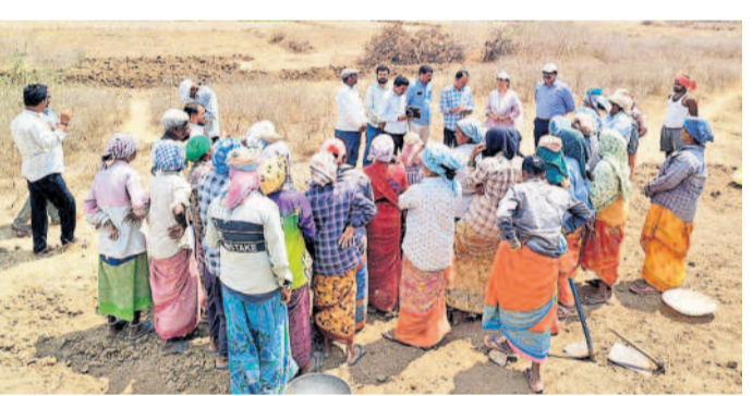
ఉపాధి హామీ పథకంలో పనిచేస్తున్న కూలీలు (ఫైల్)

కందుకూరు, మార్చి 14 : పల్లెల్లో వలసలను నివారించి స్థానికంగా పనులు కల్పించేందుకు కేంద్ర ప్రభుత్వం జాతీయ గ్రామీణ ఉపాధి పథకాన్ని ప్రవేశపెట్టింది. ఈ పథకం కింద పనులు జరిగే ప్రదేశంలో కూలీలకు రాష్ట్ర ప్రభుత్వం కనీస సౌకర్యాల కల్పించాల్సి ఉన్నది. ఇందుకు నిధులను కూడా కేటాయిస్తుంది. ముఖ్యంగా వేసవిలో కూలీలు సేద తీరేందుకు టింట్లు, తాగునీరు, ప్రథమ చికిత్స కిట్లు అందజేయాలి అంటూ ఆయితే వసతుల కల్పనలో రాష్ట్ర ప్రభుత్వం పట్టించుకోవడం లేదని కూలీలు ఆవేదన వ్యక్తం చేస్తున్నారు. కనీసం ఎండలో సేద తీరేందుకు టింట్ సేద తీయాలి. తాగునీరు కూడా ఇంటి వద్ద నుంచే తెచ్చుకుంటున్నట్లు పేర్కొంటున్నారు. దాంతో ఎండకాలం కూలీలు వడ దెబ్బకు