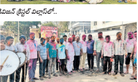
బండంగపేట : మహేశ్వరంలో..