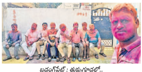
బండంగపేట : తుక్కుగూడలో..