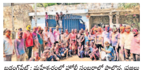
బండంగపేట : మహేశ్వరంలో హోలీ సంబురాలు పాల్గొన్న ప్రజలు