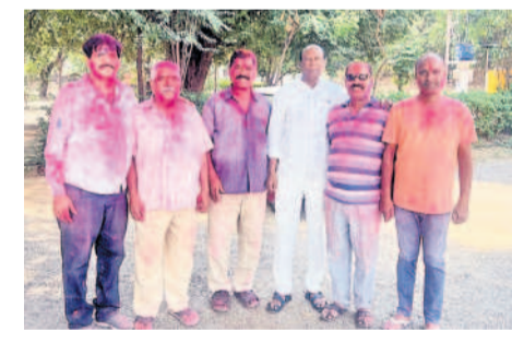
మన్నారాబాద్ : మాజీ కార్యకర్తల కోవలపై విలేజ్ రెడ్డి హోలీ శుభాకాంక్షలు తెలుపుతున్న కార్యకర్తలు