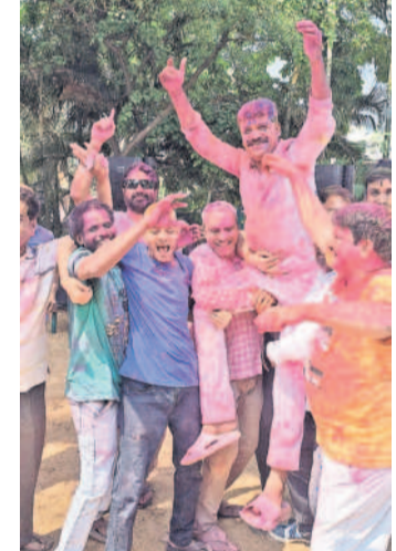
మన్నారాబాద్ : హోలీ సంబురాలు కార్యకర్తల కోవలపై సర్పంచిహోరెడ్డి తదితరులు