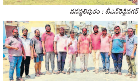
కందుకూరులో హోలీ సంబురాలు నవతరం యూత్ సభ్యులు