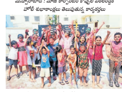
చంపాపేట : కర్నూలులో హోలీ ఆడుతున్న చిన్నారులు