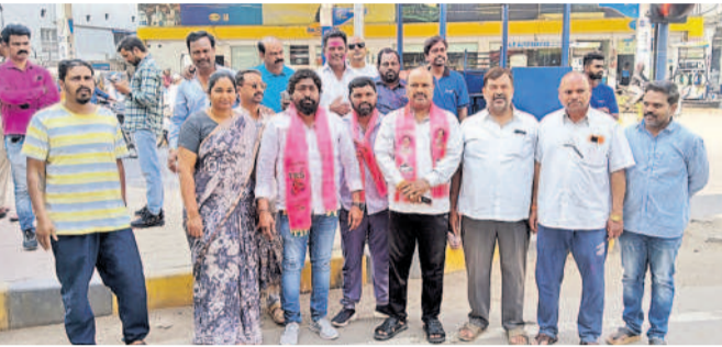
చాదర్పూల్ పోలీసులు కేసులు నమోదు చేసిన బీఆర్ఎస్ నాయకులు వీరే.