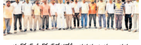
బండంగపేట : మీరపేటలో హోలీ జరుపుకుంటున్న నాయకులు