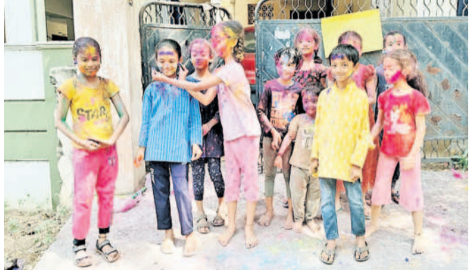
ఎల్సీనగర్ : రంగులు పూసుకుని హోలీ ఆడుతున్న చిన్నారులు