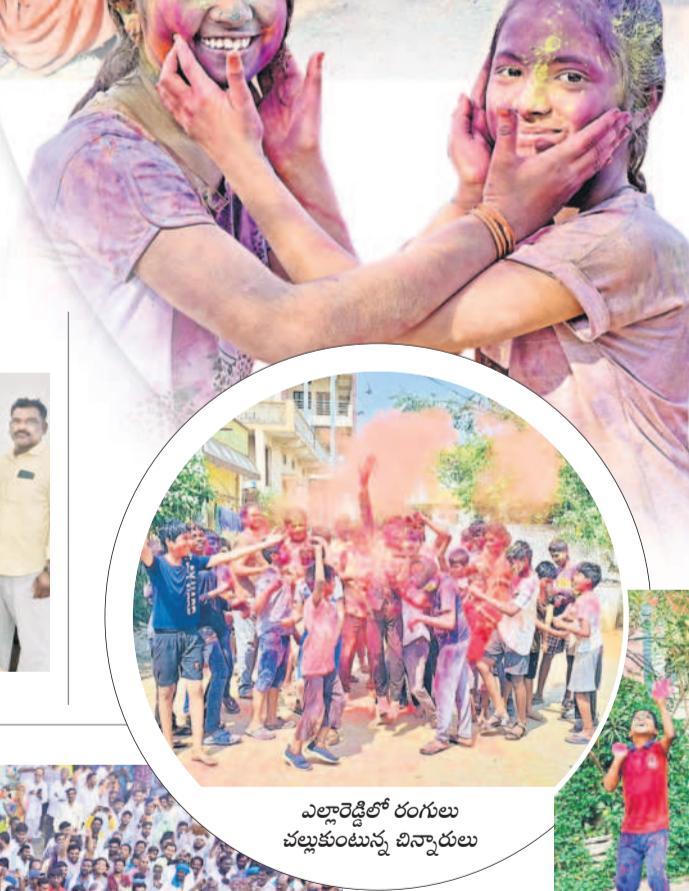
ఎల్లారెడ్డిలో రంగులు చల్లుకుంటున్న బిచ్చారులు