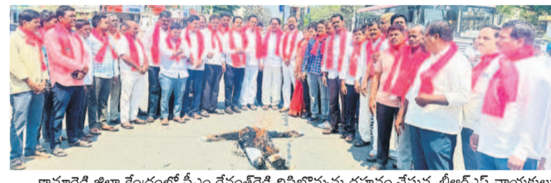
కామారెడ్డి జిల్లా కేంద్రంలో సీఎం రేవంత్ రెడ్డి దిష్టిబొమ్మను దహనం చేస్తున్న బీఆర్ఎస్ నాయకులు