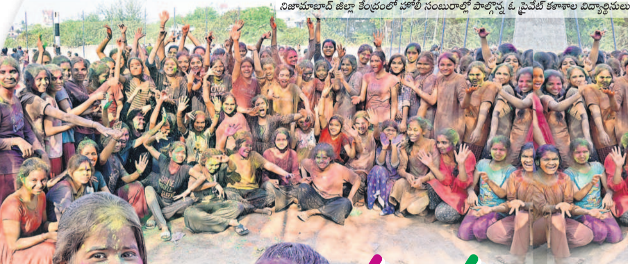
నిజామాబాద్ జిల్లా కేంద్రంలో హోలీ సంబురల్లో పాల్గొన్న ఓ ఓంవేట్ కళాకాల విద్యార్థినులు