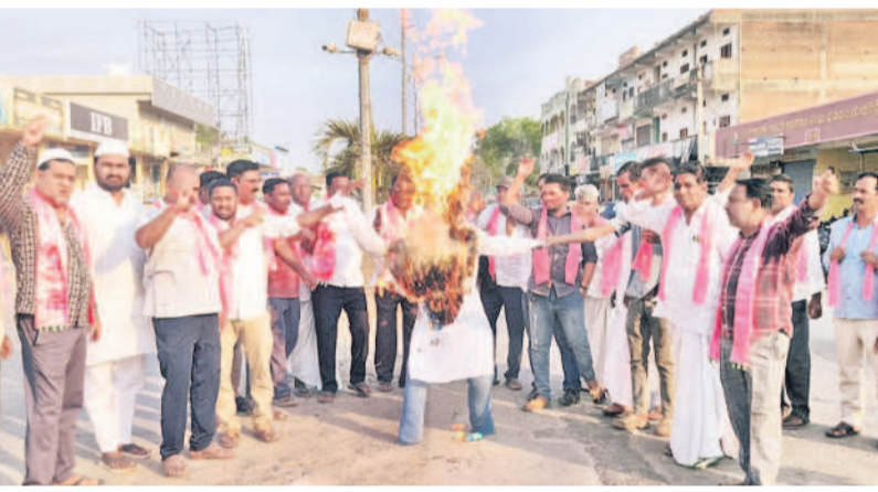
ఎల్లారెడ్డి ప్రధాన రహదారిపై తెలంగాణ తల్లి విగ్రహ ప్రాంగణం వద్ద సీఎం దిష్టిబొమ్మను దహనం చేస్తున్న బీఆర్ఎస్ శ్రేణులు

హామీల అమలుపై అడుగుదూరంగా నిలబడాలి.. ప్రజా సమస్యలపై పవ వద ప్రశ్నిస్తాము.. కాంగ్రెస్ ప్రభుత్వాన్ని వెంటాడుతున్న బీఆర్ఎస్ శ్రేణులు.. పాలనలో ఘోర వైఫల్యం చెందిన రేవంత్ సర్కారు గులాబీ పార్టీపై కక్ష గట్టింది. ప్రజలకిచ్చిన వాగ్దానాలను అమలు చేసే చేతకాని ప్రభుత్వం ప్రశ్నించే గొంతును నొక్కుతున్నది. అక్రమ కేసులు పెట్టి లోపలేయడమే.. అసెంబ్లీలో నిలదీస్తున్న ఎమ్మెల్యేలను సభ నుంచి గెంటిస్తున్నది. అందులో భాగంగానే మాజీ మంత్రి, బీఆర్ఎస్ ఎమ్మెల్యే జగదీశ్ రెడ్డిని బద్దిపూర్ సమావేశాలు పూర్తయ్యే వరకు అసెంబ్లీ నుంచి అక్రమంగా సస్పెన్షన్ వేటు వేసింది. సర్కారు తీరును నిరసిస్తూ గులాబీ శ్రేణులు శుక్రవారం ఉమ్మడి జిల్లా వ్యాప్తంగా నిరసనలు చేపట్టాయి. రేవంత్ ప్రభుత్వ దిష్టిబొమ్మలను దహనం చేశాయి. అక్రమ సస్పెన్షన్ను వెంటనే ఎత్తివేయాలని, లోకపాత అందోళనలు మదింప ఉద్దేశం చేస్తామని హెచ్చరించాయి.