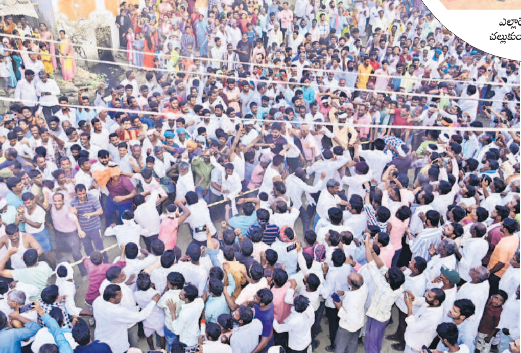
హుస్సా గ్రామంలో పిడిగుడ్డులలో తలపడుతున్న గ్రామస్థులు