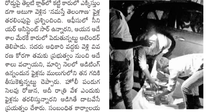
ములుగు పే అండ్ అకౌంట్స్ ఆఫీస్ నుంచి రాత్రి 8 గంటలకు పైళ్ల తరలింపును అరిగిపోయింది, మరో ఇద్దరు వ్యక్తులు

ములుగు, మార్చి 14 (నమస్తే తెలంగాణ): ప్రభుత్వ కార్యాలయం నుంచి గుట్టు చప్పుడు కాకుండా రాత్రి సమయంలో పైళ్ల తరలింపును పుటల ములుగు జిల్లా కేంద్రంలోని పే అండ్ అకౌంట్స్ కార్యాలయంలో శుక్రవారం పోలీసులకున్నది. ములుగు పోలీస్ స్టేషన్ పక్కన ఉన్న జిల్లా సంక్షేమ శాఖ అధికారి కార్యాలయం కాంప్లెక్స్ లో ఉన్న పే అండ్ అకౌంట్స్ కార్యాలయ సీనియర్ అసిస్టెంట్ శుక్రవారం రాత్రి తన జిల్లా అధికారి సంక్షేమలో పైళ్ల తరలింపు చార్జీ ఉండగా అరిగిపోయింది. తరలింపు అనిచడం పలు అనుమానాలకు తావిస్తున్నది.