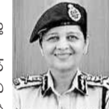
సీఎస్ టీ డీజి శిఖా గోయల్

హైదరాబాద్, మార్చి 14 (నమస్తే తెలంగాణ): సైబర్ నేరగాళ్ల మూలలోని మొత్తం 15 మంది ఏజెంట్లు, మధ్యవర్తుల్లో 8 మందిని అరెస్టు చేసినట్లు సీఎస్ టీ డీజి శిఖా గోయల్ ఓ ప్రకటనలో వెల్లడించారు. మిగిలినవారు పదిహేనే ఉన్నారు, వారిలో ఐదుగురు విదేశాల్లో ఉన్నారని వివరించారు. తెలంగాణ వ్యాప్తంగా 10 మంది బాధితుల నుంచి వచ్చిన ఫిర్యాదుల మేరకు ఈ ముఠాపై 9 కేసులు నమోదైనట్లు తెలిపారు.