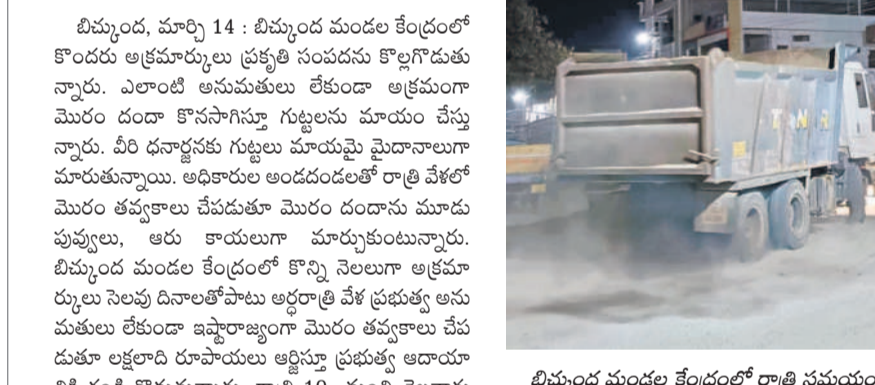
బిమ్మండల మండల కేంద్రంలో రాత్రి సమయంలో మొరం తరలింపును టిప్టర్ (వైల్) మొరం తరలింపును టిప్టర్ (వైల్)

బిమ్మండల, మార్చి 14 : బిమ్మండల మండల కేంద్రంలో కొందరు అక్రమార్కులు ప్రకృతి సంపదను కొల్లగొడుతున్నారు. ఎలాంటి అనుమతులు లేకుండా అక్రమంగా మొరం దండా కొనసాగిస్తూ గుట్టలను మాయం చేస్తున్నారు. వీరి ధనాధారకు గుట్టలు మాయమై మైదానాలుగా మారుతున్నాయి. అధికారుల అండదండలతో రాత్రి వేళలో మొరం తవ్వకాలు చేపడుతూ మొరం దండాను మూడు పువ్వులు, ఆరు కాలులుగా మార్చుకుంటున్నారు. బిమ్మండల మండల కేంద్రంలో కొన్ని నెలలుగా అక్రమార్కులు నిలవు దినాలతోపాటు అర్ధరాత్రి వేళ ప్రభుత్వ అనుమతులు లేకుండా ఇష్టానుసారంగా మొరం తవ్వకాలు చేపడుతూ లక్షలాది రూపాయలు అమ్మి ప్రభుత్వ ఆదాయానికి గండి కొడుతున్నారు. రాత్రి 10 నుంచి తెల్లవారుజాము 5 గంటల వరకు పాస్టయిన్ సహాయంతో టిప్టర్లలో మొరం జోరుగా రవాణా చేస్తున్నారు. ఇంత జరుగుతున్నా అధికారులు చూసినట్లున్నట్లు వ్యవహరిస్తున్నారనే ఆరోపణలున్నాయి. గ్రామ శివారులోని గుట్ట ప్రాంతాల నుంచి పాస్టయిన్ సహాయంతో మొరం తవ్వకం చేస్తూ, టిప్టర్ల ద్వారా వెంచర్లు, ఇండ్ల బరంజీలకు తరలిస్తూ ఒక్కో టిప్టరుకు 3 వేల రూపాయల చొప్పున తీసుకుంటూ లక్షల రూపాయలను సామ్యం చేసుకుంటున్నారు. ఇదంతా జరుగుతున్నా అధికారులు పట్టించుకోవడంలేదని రెవెన్యూ, పోలీస్ శాఖ