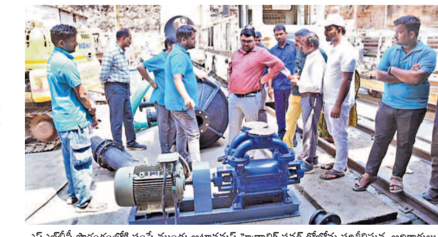
ఎస్ఎల్ బీసీ సారంగంలో పంపే ముందు అటానమస్ హైడ్రాలిక్ పవర్ లోహోను పరిశీలిస్తున్న అధికారులు

కాపు కార్యరేపన్ ఇస్తామని కాంగ్రెస్ పార్టీ హామీ ఇచ్చి అధికారంలోకి వచ్చిన తరువాత ఇంత అన్యాయం చేస్తుందని ఊహించలేదని అన్నారు. పార్లమెంట్ ఎన్నికలకు ముందు కూడా అన్ని జిల్లా కేంద్రాల్లో బాల బాలికల పనికి గృహం కోసం రెండేకల స్థలం ఏర్పాటు చేసి ప్రత్యేక జీవో కూడా ఇచ్చిన విషయాన్ని గుర్తుచేశారు. ఇప్పుడు మంత్రులు పాస్టం ప్రభాకర్, దుద్దిక్ శ్రీధర్ బాబు, ప్రభుత్వ వీపీ ఆది శ్రీనివాస్ మున్నూరు కాపులకు ఇచ్చిన వాగ్దానాలను నిలుపుకోలేదు. ఇలాంటి ప్రకారం రాష్ట్రంలో మొదటి స్థానంలో ఉన్న కాపులను కులగణన సర్వేలో ఐదో స్థానంలోకి నెట్టేశారని విమర్షించారు. ఇప్పుడు బహిరంగ లేఖను బహిరంగ లేఖను నామినేట్ పదవులు అడిగి అవకాశం లేకుండా చేశారని ఆగ్రహం వ్యక్తం చేశారు. పథకం ప్రకారమే సంస్థల ఎన్నికల్లో తమను ఓట్లను అడిగి కాపు కార్యరేపన్ పదవి కూడా అడిగి అవకాశం లేకుండా చేశారని దుయ్యబల్టారు. తమ డిమాండ్లను నెరవేర్చకపోతే స్థానిక సంస్థల ఎన్నికల్లో తమను ఓట్లను అడిగి హక్కును కోల్పోతారని ఆ లేఖలో స్పష్టం చేశారు. ప్రస్తుతం ఈ లేఖ సామాజిక మాధ్యమంలో వైరల్ గా మారింది.