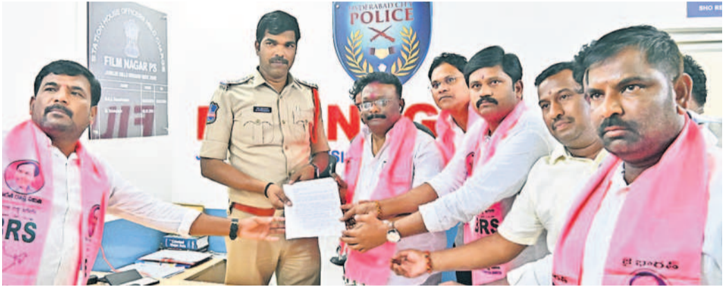
సీఎం రేవంత్ రెడ్డిపై హైదరాబాద్ ఫిట్నెస్ గర్ల పోలీసులకు ఫిర్యాదు చేస్తున్న ఎమ్మెల్యే దాసోజు శ్రవణ్ కుమార్, బీఆర్ఎస్ నేతలు

కాదనవారు ఎవరున్నారని ప్రశ్నించారు. అలాగా మరొక పోరాటంలో కేసీఆర్ తెలంగాణ జెండా పట్టుకోకుంటే ఈ రోజు కాంగ్రెస్, బీజేపీ, టీడీపీ నాయకులకు తెలంగాణ జెండా ఉండేదా? అన్నది గుర్తు చేసుకోవాలని చెప్పారు. అలాంటి మహానేతను పట్టుకొని మార్కులకి పోతారని మాట్లాడటం బాధాకరమని అన్నారు. ఏ రోజైనా మార్కులకి పోవాలిందేననే వాస్తవం గుర్తుంచుకోవాలని చెప్పారు. ఏ రాజకీయ నేతనైనా అందులోనూ ముఖ్యమంత్రి స్థాయిలో ఉన్న వ్యక్తికి ఇలాంటి వ్యాఖ్యలు శోభనీయవని స్పష్టం చేశారు. రేవంత్ రెడ్డి ఎందుకు నోరుజూరుతున్నారో అర్థంకావడంలేదని అన్నారు. అధికారంలోలేని వ్యక్తి ఇష్టమొచ్చినట్లు మాట్లాడితే ప్రజలకు అనాధారంగా కనిపిస్తుందని పేర్కొన్నారు. రేవంత్ మాటలు ఆయనలో వెలిగిన ఆసహసం, అక్కసుకు నిదర్శనంగా ఉన్నాయని చెప్పారు.