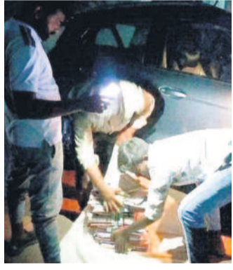
ములుగు ఏ అండ్ అకౌంట్స్ ఆఫీస్ నుంచి రాత్రి 8 గంటలకు పైత్యం తరలింపు అధికారి, మరో ఇద్దరు వ్యక్తులు

హైదరాబాద్, మార్చి 14 (నమస్తే తెలంగాణ): మయనూర్ సైబర్ నేరగాళ్ల మూలలోని మొత్తం 15 మంది ఏజెంట్లు, మధ్యవర్తుల్లో 8 మందిని అరెస్టు చేసినట్లు సీఎస్ టీ డిజి శిఖా గోయల్ ఓ ప్రకటనలో వెల్లడించారు. మిగిలినవారు పరారీలో ఉన్నారని, వారిలో ఐదుగురు విదేశాల్లో ఉన్నారని వివరించారు. తెలంగాణ వ్యాప్తంగా 10 మంది బాధితుల నుంచి వచ్చిన ఫిర్యాదుల మేరకు ఈ ముఠాపై 9 కేసులు నమోదిస్తున్నట్లు తెలిపారు.