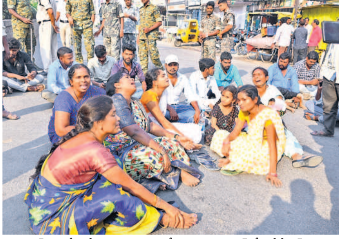
సంపత్ను పోలీసులే కొట్టి చంపారని ఆరోపిస్తూ నిజామాబాద్ లోని జీజీహెచ్ ఎదుట దర్శా చేస్తున్న కుటుంబ సభ్యులు, బంధువులు, చిత్రంలో మోహించిన పోలీసులు

హైదరాబాద్, మార్చి 14 (నమస్తే తెలంగాణ) / వినియోగదారు: నిజామాబాద్ సైబర్ క్రైమ్ పోలీసుల కస్టోడియన్ గురువారం రాత్రి అనుమానాస్పద స్థితిలో మృతి చెందడం విచారణలో ఉంది. పోలీసులు కొట్టడంపై నిందితుడు చనిపోయాడని ఆరోపిస్తూ మృతుడి కుటుంబ సభ్యులు ఖత్ర వారం ప్రభుత్వ జిల్లా దవాఖాన ముందుకు కుటుంబ సభ్యులు తెలిపిన వివరాల ప్రకారం పెద్దపల్లి జిల్లా అంతర్గతం చెందిన ప్రకారం (32) జగిత్యాల జిల్లాలో మ్యాన్ పవర్ కన్స్ట్రక్షన్స్ ద్వారా నిర్మిస్తున్న గురువారం లాండ్, ముందుగా, లాండ్ తదితర డిమాండ్ లకు పంపించారు. విదేశాలకు వెళ్లిన యువకులు తాము మానపోయామని తిరిగి వచ్చి పోలీసులకు ఫిర్యాదు చేశారు. దీంతో నిజామాబాద్ సైబర్ క్రైమ్ పోలీసులు సంపత్ తో