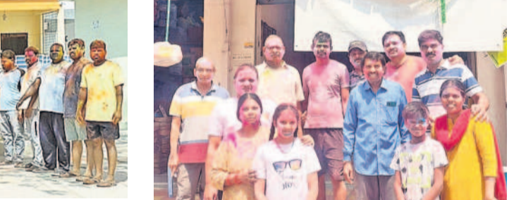
మణికోండలోని వాసవీ సంఘం అభ్యర్థులతో..