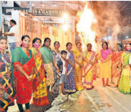
బంజారాహిల్స్ రోడ్డు నంబర్ 12లోని ఎన్.బీ.నగర్ లో కామ దూసం చేస్తున్న మల్కారంపల్లి గ్రామస్థులు