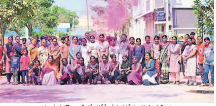
భూవనీనగర్ కాలనీలో హోలీ వేడుకల్లో పాల్గొన్న మహిళలు