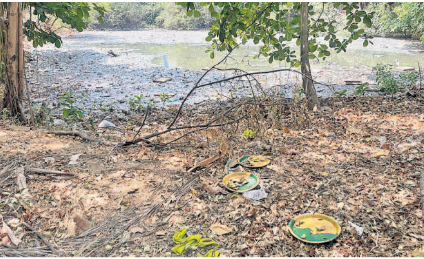
జూబ్లీహిల్స్ రోడ్డు నంబర్ 5లోని జీహెచ్ఎస్సీ పార్కును ఆసుకుని ఉన్న మురుగునీటి గుంట

బంజారాహిల్స్, మార్చి 14: సంబరకులకు ఆహ్లాదాన్ని పంచాలని జీహెచ్ఎస్సీ పార్కును సరైన నిర్వహణ లేకపోవడంతో అనారోగ్యాలను కలిగిస్తున్నాయి. సరైన భద్రతా చర్యలు తీసుకోకపోవడంతో పార్కులో అసాంఘిక కార్యక్రమాలు జోరుగా కొనసాగుతున్నాయి. జీహెచ్ఎస్సీ సర్కిల్ 18 పరిధిలోని జూబ్లీహిల్స్ రోడ్డు నంబర్ 5లోని పార్కులో సమస్యలు రాజ్యమేలుతున్నాయి. ● ఉమన్ కో - ఆపరేటివ్ సొసైటీ, వెంకటగిరి, దుర్గాభవానీ నగర్ బస్స్, జూబ్లీహిల్స్ రోడ్డు నంబర్ 1లోని నివాసీతుల కోసం ఏర్పాటు చేసిన జీహెచ్ఎస్సీ పార్కును ఆసుకుని ఉన్న మురుగు నీటి గుంటతో దుర్వాసన వెదజల్లుతోంది. ఎగువ భాగంనుంచి వచ్చే నీవరేజీ మొత్తం పార్కును ఆసుకుని ఉన్న భారీ గుంటలోకి చేరింది. దీంతో పాలు ప్యాక్స్, ఆహార వ్యర్థాలను నిత్యం దానిలో పారవేస్తుంటారు. దీంతో విపరీతమైన దుర్వాసనతో పాలు రోమలు విజృంభిస్తున్నాయి. ● పార్కులో ఉదయం పూట వాకింగ్ కోసం వచ్చేవారు ముక్కుమూసుకుని వెళ్లాలి వస్తోంది. కాస్తానే స్వచ్ఛమైన గాలిని పీల్చుకుందామని వచ్చి కూర్చుంటే రోమకాలు ఒక వైపు, భరించలేని దుర్వాసన మరోవైపు ఉక్కిరి బిక్కిరి చేస్తోంది. ● పార్కులో రాత్రి అయిందంటే చాలు అసాంఘిక శక్తులు తిట్టవేస్తున్నారు. తాగుబోతులతో పాలు ట్రాన్స్ జెండర్ల వేసే అరాచకాలు అన్నీ ఇన్నీ కావు. గతంలో పార్కు భద్రత కోసం డిఆర్ఎస్ లో పనిచేస్తున్న సిబ్బందిని సెక్యూరిటీ కోసం వినియోగించే వారు. దాంతో ట్రాన్స్ జెండర్ల పార్కులోకి వచ్చేవారు కాదు.