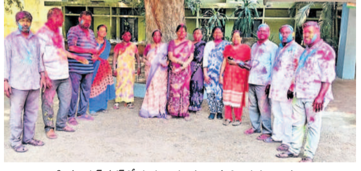
హిమాయత్ నగర్ లో రంగులు చల్లుకుంటున్న పాలిశుద్ధ కార్యక్రమం