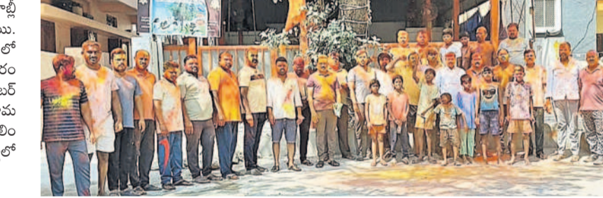
ఖాసాపురం గ్రామంలో హోలీ సంబురల్లో పాల్గొన్న నాయకులు, యువకులు