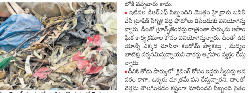
జీహెచ్ఎస్సీ పార్కులో వాడిపారేసిన కండ్లీమ్ ప్యాకెట్లు