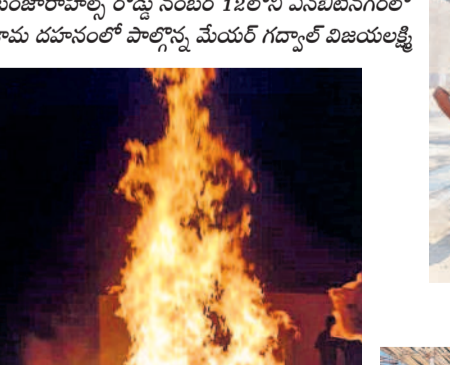
కామ దూసం చేస్తున్న మల్కారంపల్లి గ్రామస్థులు