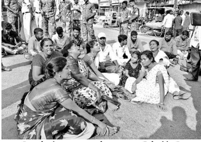
సంపత్ను పోలీసులే కొట్టి చంపారని ఆరోపిస్తూ నిజామాబాద్ లోని జేజీహెచ్ ఎదుట ధర్నా చేస్తున్న కుటుంబ సభ్యులు, బంధువులు, చిత్రలేఖనం పోలీసులు

పాటు మరో ఏకెండ్లపై పదిరోజుల క్రితం కేసు నమోదుచేశారు. ఇద్దరినీ ఆరెస్టు చేసి కోర్టులో హాజరు పర్చగా కోర్టు రిమాండ్ విధించింది. నిందితులను విచారించేందుకు కస్టడీ ఇవ్వాలని పోలీసులు పిటిషన్లు దాఖలు చేయడంతో ఈ నెల 12 నుంచి 14 సంవత్సరం (32) జగిత్యాల జిల్లాలో మ్యాన్ పవర్ కస్టడీలో ద్వారా నిరుద్యోగులను ధార్యం లాండ్, మయనాగర్, లావోన్ తదితర డిశాలకు పంపించారు. విదేశాలకు వెళ్లిన యువకులు తాము హాసపోయామని తిరిగి వచ్చి పోలీసులకు ఫిర్యాదు చేశారు. దీంతో నిజామాబాద్ సైబర్ క్రైమ్ పోలీసులు సంపత్ తో