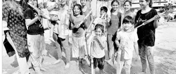
పాల్గొన్న చిన్నారులు, యువకులు పాల్గొన్న దృశ్యం