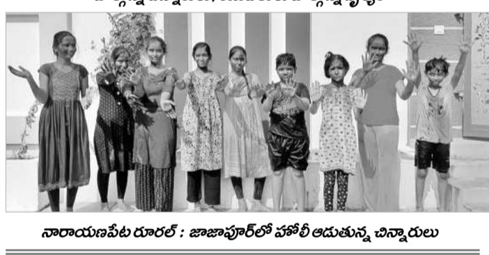
నారాయణపేట రూరల్ : జాబాపూర్ లో హోలీ ఆడుతున్న చిన్నారులు