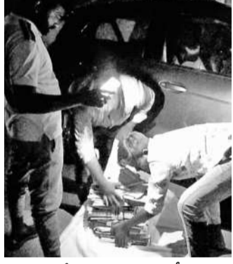
ములుగు పే అండ్ అకౌంట్స్ ఆఫీస్ నుంచి రాత్రి 8 గంటలకు పైళ్లను తరలింపున అతనితో, మరో ఇద్దరు వ్యక్తులు

హైదరాబాద్, మార్చి 14 (నమస్తే తెలంగాణ): మయనాగర్ సైబర్ నేరగాళ్ల మూలలోని మొత్తం 15 మంది ఏజెంట్లు, మధ్యస్థులలో 8 మందిని అరెస్టు చేసినట్లు సీఎస్ టీ డీజీ శిఖా గోయల్ ఓ ప్రకటనలో వెల్లడించారు. మిగిలినవారు విచారణ కన్నారని, వారిలో ఐదుగురు వదిలించి కన్నారని వివరించారు. తెలంగాణ వ్యాప్తంగా 10 మంది బాధితుల నుంచి ఫిర్యాదుల మేరకు ఈ ముఠాపై 9 కేసులు నమోదిస్తున్నట్లు తెలిపారు.