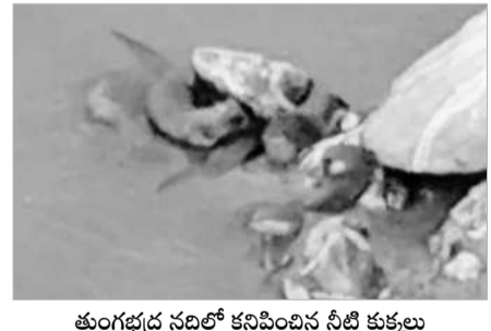
తుంగభద్ర నదిలో కనిపించిన నీటి కుక్కలు

అలంపూర్, మార్చి 14 : జోగులూరు గద్వాల జిల్లా అలంపూర్ లోని ప్రసిద్ధ క్షేత్రం సమీపంలో తుంగభద్ర నదిలో అరుదైన నీటి జీవులు కనిపించాయి. శుక్రవారం ఉదయం మార్కెట్ వాక్కు వెళ్లిన కొందరు యువకులకు నదిలో కొత్త రకం జీవులు కనిపించడంతో ఆసక్తిగా వీడియోలు తీశారు. సామాజిక మాధ్యమాలలో వైరల్ గా మారాయి. అక్కడే పట్టుకోవాలని విచారించగా.. అవి నీటి కుక్కలు, చాలా అరుదుగా కనిపిస్తుంటాయన్నారు. నీటిలో చేపలను తింటూ జీవనం సాగిస్తాయని తెలిపారు.