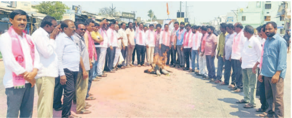
నేరేచుపల్లెలో సీఎం రేవంత్ రెడ్డి దిష్టిబొమ్మను దహనం చేస్తున్న బీఆర్ఎస్ నాయకులు