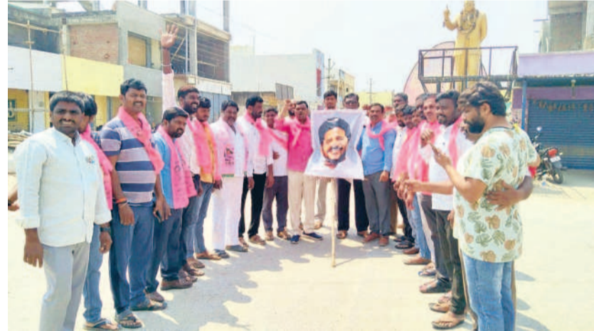
ముసుగోడులో రేవంత్ రెడ్డి ఫైర్ కేసు దహనం చేస్తున్న బీఆర్ఎస్ నాయకులు