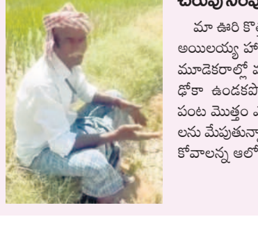
-వాటికి యాదాద్రి, రైతు, మాసాయిపేట (యాదాగిరిగట్ట మండలం)

మా ఊరి కొత్తచెరువును నింపుతామని ఎమ్మెల్యే బీర్ అయిలయ్య హామీ ఇస్తే బంగారం కుడువబట్టి నాకున్న మాదిగకొండలో వరి నాలు పెట్టిన. చెరువు నిండితే నీళ్లు డోశా ఉండకపోయేది. కానీ, నీళ్లు ఇవ్వకపోవడంతో పంట మొక్క ఎండిపోయింది. ఎండిన పొలంలో అప్పులను మేపుతున్నా కాంగ్రెస్ ప్రభుత్వానికి రైతులను అడుకోవాలన్న ఆలోచన ఉన్నట్లు కనిపించడం లేదు.