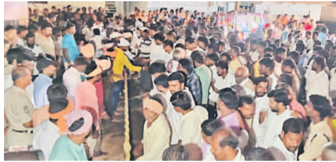
కొంతానపల్లి గ్రామంలో పిడి గుడ్డులాలటో పాల్గొన్న గ్రామస్థులు

శివ్వంపేట, మార్చి 14: శివ్వంపేట మండలం కొంతానపల్లి గ్రామంలో పిడి గుడ్డులాలటం సందర్భంగా నిరసించుకుంటే పిడి గుడ్డులాలట అనవాయితీగా వస్తున్నది. గ్రామంలోని ఎన్నో బుడగపర్ల వతందార్లు డప్పులతో మంట ఊరేగింపు చేస్తారు. గ్రామంపై అరాచకీ చావడి వద్ద పిడిగుడ్డులాలట నిరసనలు. తరతరాలుగా వస్తున్న