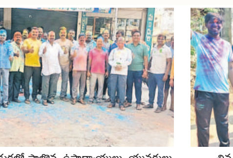
చేగుంట: హోలీ వేడుకల్లో పాల్గొన్న ఉపాధ్యాయులు, యువకులు