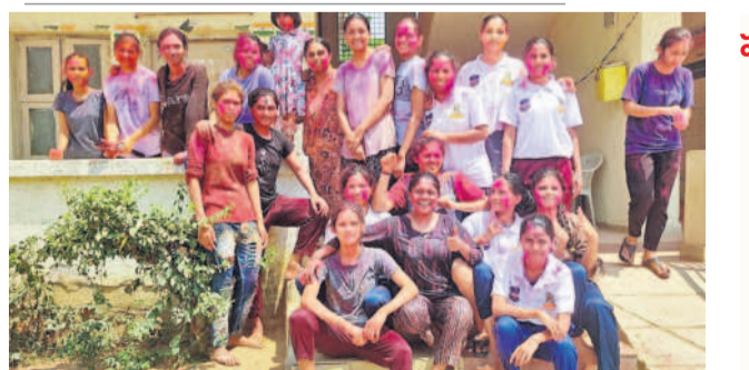
హోలీ రంగుల హోలీ చమ్మకేళిలో.. రంగులను రంగులను.. కామయ్యకు దోతులంటూ డి.లచ్చగుమ్మడి.. అంటూ ఒక రిప్పి ఒకరు రంగులు చల్లుకుంటూ, పాటలు పాడుతూ అటలు అడుతూ హోలీ పండుగను శుక్రవారం ప్రభవంగా జరుపుకొన్నారు. వసంతంలో వచ్చిన తొలి పండుగ హోలీ. ప్రకృతిలో సహజ సిద్ధంగా లభించే మోడుగ పూలతో తయారుచేసుకున్న రంగులు చల్లుకున్నారు. పట్టె, పట్టణం, చిన్నాపెద్దా తేడా లేకుండా వీధుల్లోకి వచ్చి రంగులు చల్లుకుంటూ కేరింతలు కొట్టారు. రంగుల్లో మునిగి తేలారు. ఈ సారి గురువారం రాత్రి కామ దహనం నిర్వహించారు.