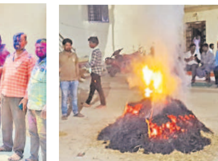
శివ్వంపేట: గూడురులో హోలీ సంబరాలలో గ్రామస్థులు