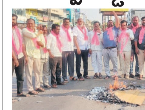
నర్సాపూర్లో నిరసన తెలుపుతున్న బీఆర్ఎస్ శ్రేణులు