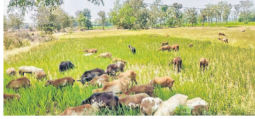
బిలిపెడె: బిల్బుల్లో ఎండిన వరి పంటను వేస్తున్న గొర్రెలు

చిన్నకరంపేట, మార్చి 14: మండలంలోని వివిధ గ్రామాల్లో భూగర్భ జలాలు అడుగంటి పోవడంతో వేసిన పంటలు ఎలా కాపాడుకోవాలో