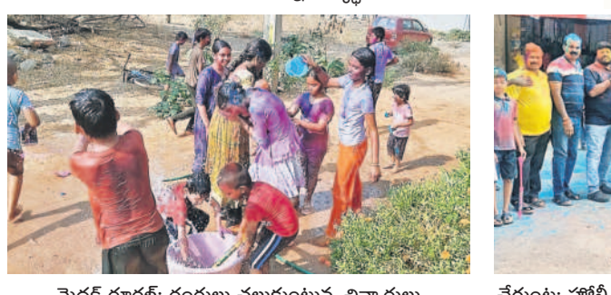
మెడక్ రూరల్: రంగులు చల్లుకుంటున్న బిచ్చారులు