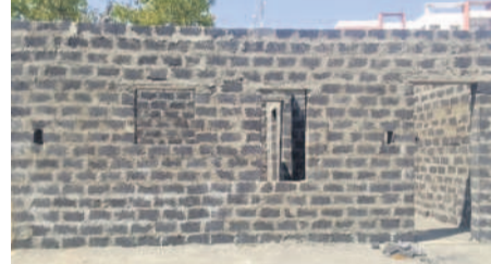
ప్రభుత్వం చూపుతున్న ఇందిరమ్మ ఇల్లు నిమూనా

రామాయంపేట రూరల్, మార్చి 14: కాంగ్రెస్ ప్రభుత్వం ఆర్థికంగా ప్రవేశపెట్టిన ఇందిరమ్మ ఇండ్లు రామాయంపేట మండల వ్యాప్తంగా ఎక్కడా నిర్మాణాలకు నోచుకోలేదు. మండలంలోని 15 పంచాయతీలు ఉన్నాయి. చాలా గ్రామాల్లో అర్హులను గుర్తించినా వారికి ఎలాంటి సర్టిఫికేట్లు ఇవ్వలేదు. ఫైల్లో ప్రాజెక్టుగా దామరచెర్లు గ్రామాన్ని ఎంపిక చేశారు. ఆ గ్రామంలో 387 మంది దరఖాస్తు చేసుకోగా అందులోంచి 153