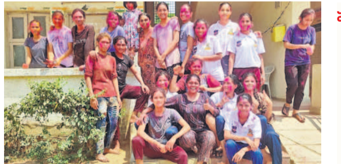
మెడక్ మున్సిపాలిటీ: జిల్లా కేంద్రంలోని గిరిజన గురుకుల డిగ్రీ కళాశాలలో హోలీ ఆడుతున్న విద్యార్థినులు