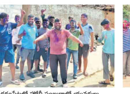
చిన్నకరంపేటలో హోలీ సంబరాలలో యువకులు