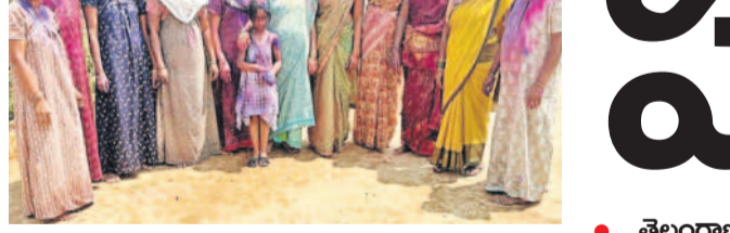
అల్లారుగిరిలో హోలీ సంబరాలలో పాల్గొన్న మహిళలు