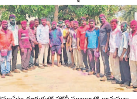
శివ్వంపేట: గూడురులో హోలీ సంబరాలలో గ్రామస్థులు