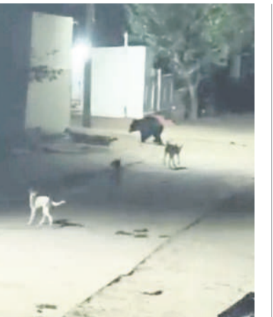
పాగిళ్ల గ్రామ వీధుల్లో సంచరిస్తున్న ఎలుగుబంటి

చందంపేట, మార్చి 14 : మండలంలోని పాగిళ్ల గ్రామంలో ఎలుగుబంటి సంచారం కలకలం రేపింది. గురువారం రాత్రి గ్రామంలోని వీధుల్లో తిరుగుతుండడంతో గ్రామస్థులు భయాందోళనకు గురయ్యారు. గ్రామానికి సమీపంలోనే అటవీ ప్రాంతం ఉండడంతో ఎలుగుబంటి గ్రామంలోకి వచ్చి ఉండొచ్చని భావిస్తున్నారు. అటవీ శాఖ అధికారులు స్పందించి ఎలుగుబంటి గ్రామ స్థూలపై దాడి చేయమమంది బందించాలని కోరుతున్నారు.