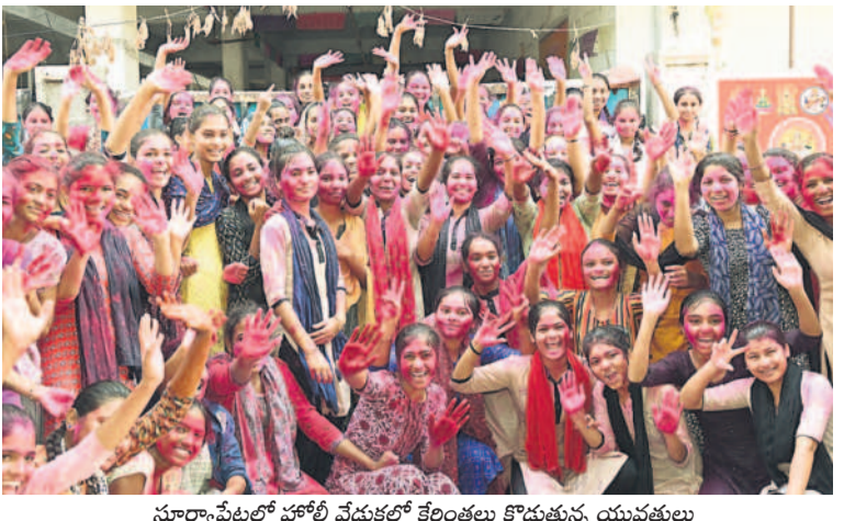
సూర్యాపేటలో హోలీ వేడుకలో కేలంతలు కొడుతున్న యువతులు