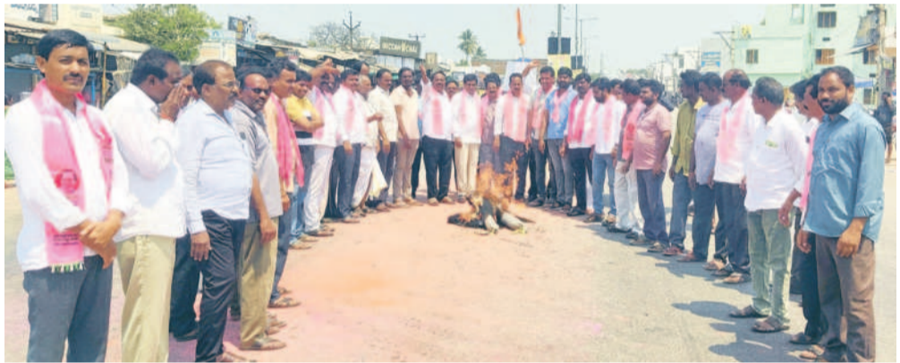
నేలమలగిరిలో సీఎం రేవంత్ రెడ్డి దిష్టిబొమ్మను దహనం చేస్తున్న బీఆర్ఎస్ నాయకులు

దహనం చేసి ఆగ్రహం వ్యక్తం చేశారు. పార్టీ నేతలు, కార్యకర్తలు నిరసన వ్యక్తం చేశారు. తక్షణమే జగదీశ్ రెడ్డిపై పెట్టిన సస్పెన్షన్ ను ఎత్తివేయాలని, ప్రభుత్వ కుట్రపూరిత చర్యలు మానుకోవాలని నినాదాలు