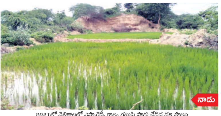
2021లో వెలిశాలలో ఎస్సారెస్సీ కాల్య గట్టుపై సాగు చేసిన వరి పొలం

రామగిరి, మార్చి 14 : రంగుల వేడుక హోలీ సంబురాలను ప్రజలు ఉమ్మడి జిల్లా వ్యాప్తంగా ఆనందోత్సాహంతో జరుపుకొన్నారు. రంగుల చల్లుకొని చిన్నా పెద్ద ఎంతాయీ చేశారు. డప్పుల దరువులు, హోరెత్తించే పాటల మధ్య చిందులు వేశారు. ప్రజాప్రతినిధులు, నాయకులు, అధికారులు హోలీ వేడుకల్లో పాల్గొని జిజ్ఞాసి ఉత్సాహపడ్డారు.