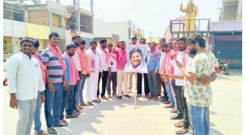
ముసుగుడులో రేవంత్ రెడ్డి ఫైర్స్ ని దహనం చేస్తున్న బీఆర్ఎస్ నాయకులు