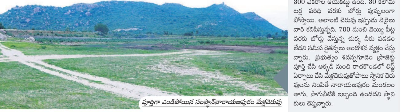
పూర్తిగా ఎండిపోయిన సంస్థాననారాయణపురం మేళ్లచెరువు

యాదాద్రి భువనగిరి, మార్చి 14 (నమస్తే తెలంగాణ) : పాలకుల నిర్లక్ష్యం రైతుల పాలిటా శాపంగా మారింది. కర్షకులకు పట్టణ మంచుతున్నది. ఏడాది శ్రీతం నిడుకుండా ఉన్న చెరువులు నేడు ఎడాదిలా కనిపిస్తున్నాయి. జిల్లాలో దాదాపు సగం చెరువులు ఎండిపోవడంతో దుర్భిక్ష పరిస్థితులు నెలకొన్నాయి. భూగర్భ జలాలు వేగంగా ఇంకిపోవడంతో బోర్లు, బావులు వట్టిపోయి పంటలు ఎండిపోతున్నాయి.